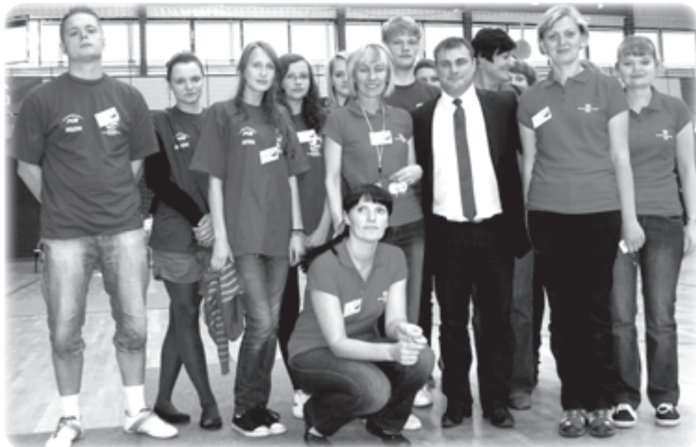
Wolontariusze i organizatorzy, także z Kwidzyna, z Leszkiem Blanikiem, ambasadorem Olimpiad Specjalnych podczas Ogólnopolskiego Dnia Treningowego w Gdańsku.

Niepełnosprawni z całego kraju uczestniczyli w Ogólnopolskim Dniu Treningowym w Gdańsku. Impreza odbyła się w hali widowiskowo sportowej AWF i S. Patronat nad nią objął Leszek Blanik, ambasador Olimpiad Specjalnych. Organizatorem był pomorski oddział Olimpiad Specjalnych. Podczas imprezy nie zabrakło kwidzyńskich akcentów. W organizację włączyły się sekcje Olimpiad Specjalnych Specjanego Ośrodka Szkolno-Wychowawczego w Kwidzynie oraz Warsztatu Terapii Zajęciowej w Górkach. WTZ prowadzony jest przez kwidzyńską Fundację „Misericordia”.