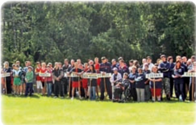
Dzień Sportu zgromadził 26 reprezentacji z trzech województw.