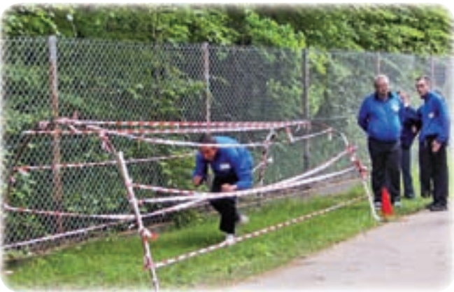
Przejsięcie przez tunel to jedna z konkurencji biegu terenowego ze stacjami.