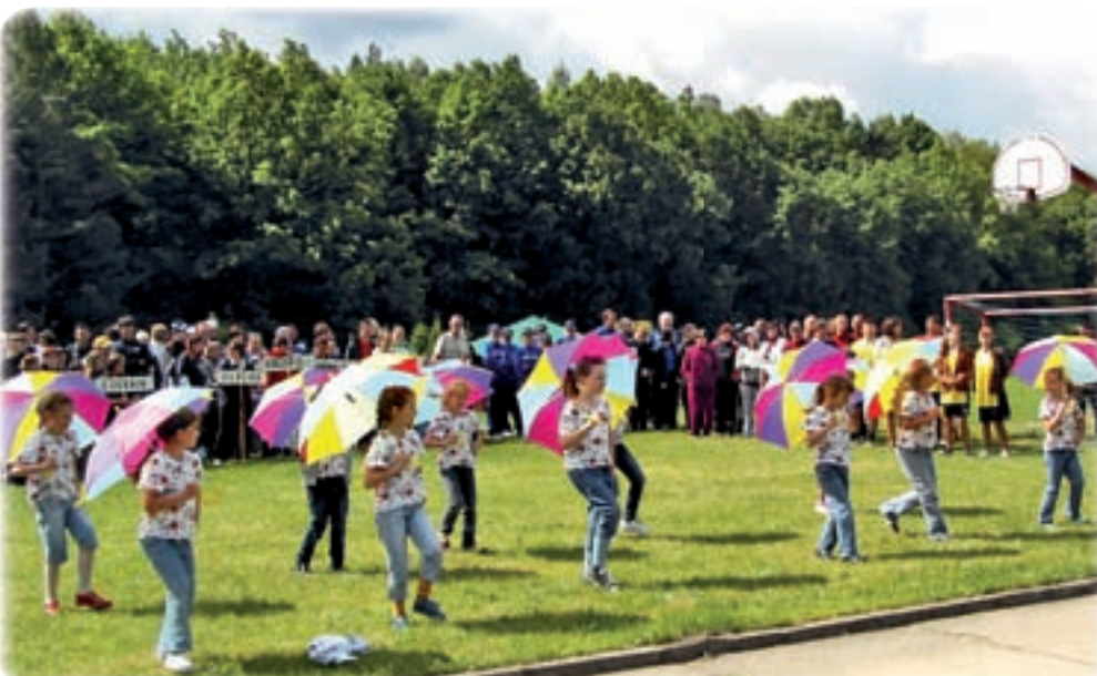
Otwarcie uświetnił pokaz tańca w wykonaniu dzieci ze Szkoły Podstawowej w Ryjewie.