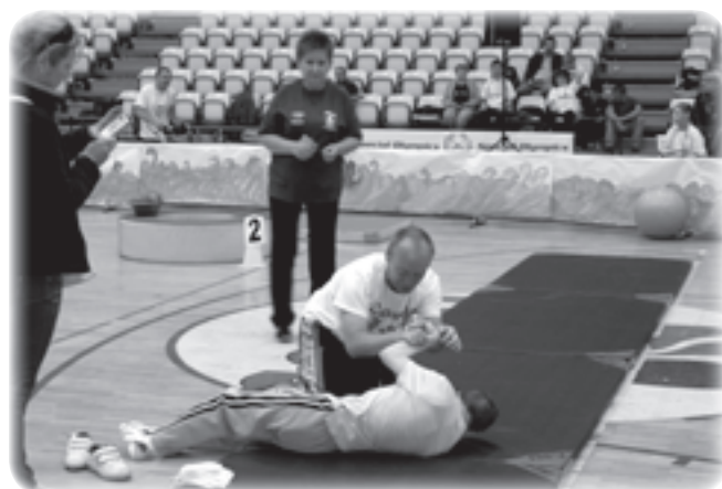
Program Treningu Aktywności Motorycznej ma charakter rehabilitacyjno-treningowy. Jest on adresowany do osób z niepełnosprawnością intelektualną, które z różnych przyczyn nie mogą brać udziału w zawodach Olimpiad Specjalnych.

W organizacji pomagali także mł. insp. Wojciech