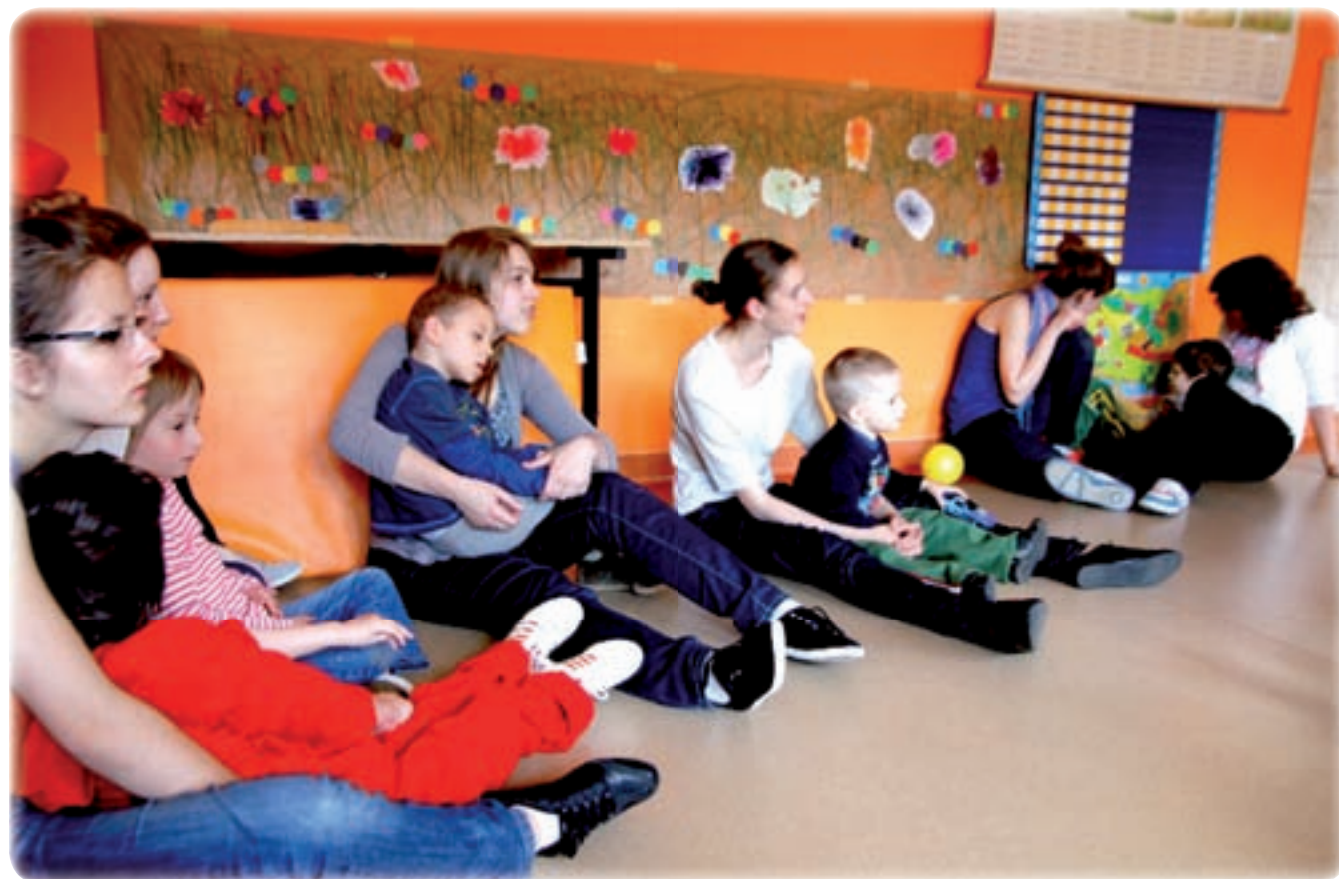
Przez dwa dni rodzice dzieci uczęszczających do Specjalnego Ośrodka Szkolno-Wychowawczego w Barcicach mogli poznawać metody pracy stosowane w placówce.

- Po zajęciach oraz w przerwie pomiędzy nimi rodzice i dzieci mogli posiedzieć w kawiarence lub skorzystać z porad fizjoterapeuty ze