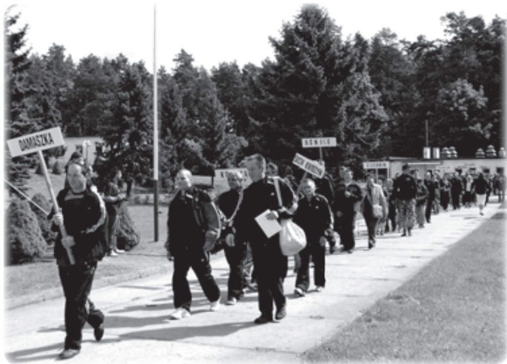
W zawodach wzięli udział niepełnosprawni sportowcy reprezentujący 26 placówek z województwa pomorskiego, warmińsko-mazurskiego i kujawsko-pomorskiego.