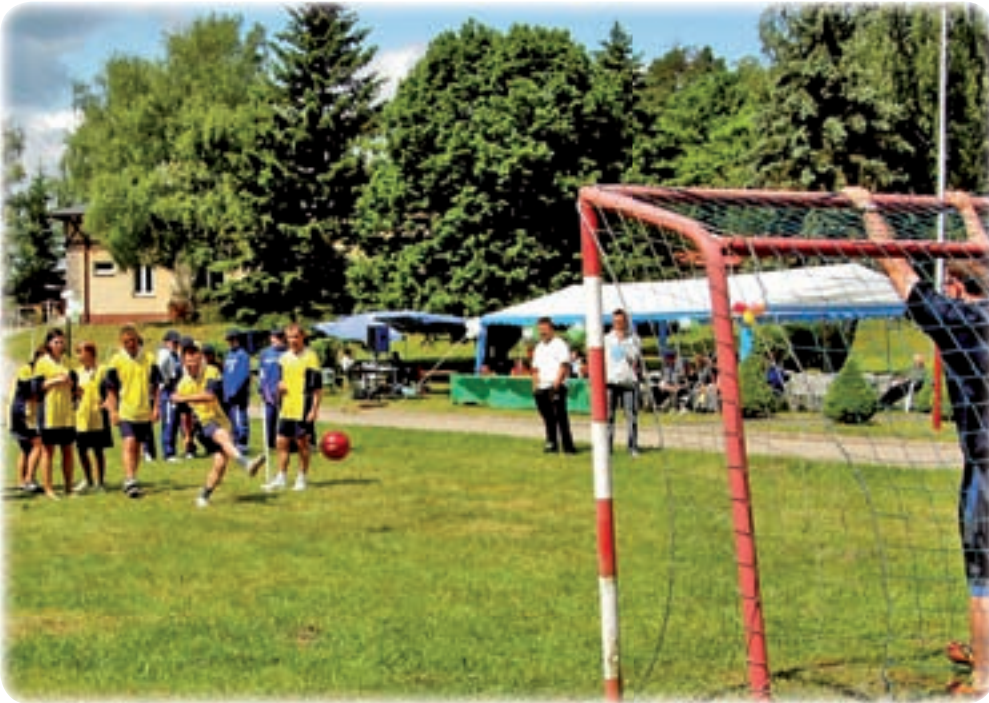
Zawodnicy musieli przebiec trasę na której przygotowano różne konkurencje, w tym strzały na bramkę.