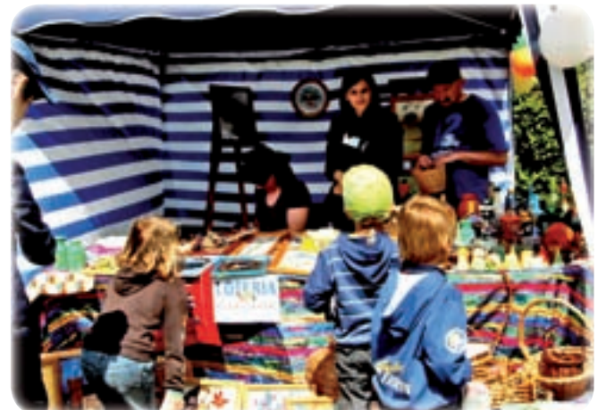
Stragan Warsztatu Terapii Zajęciowej w Ryjewie nie narzekał na brak zainteresowania. WTW prowadzi ryjewskie Stowarzyszenie Pomocy Społecznej „Słoneczne Wzgórze”.