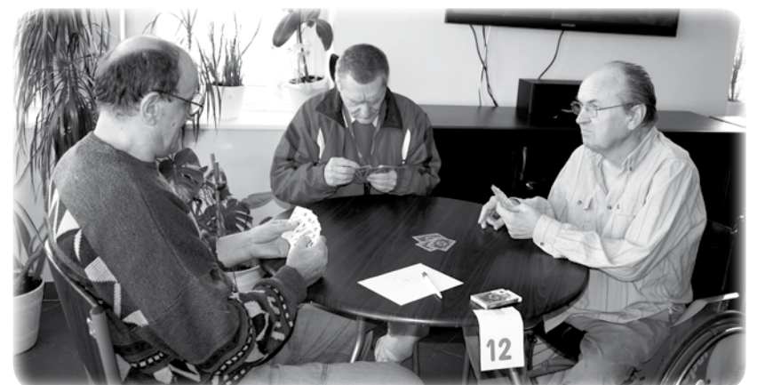
Historia ligi sięga początku lat 90.