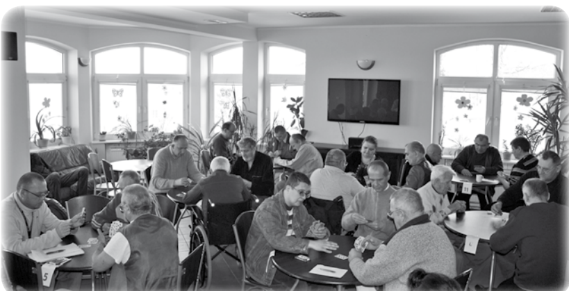
W Domu Pomocy Społecznej w Kwidzynie odbył się turniej Regionalnej Ligi Karcianej 1000.