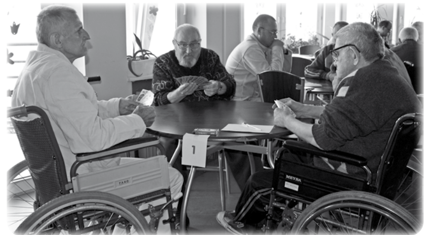
W turnieju uczestniczyło ok. 40 zawodników z domów pomocy społecznej województwa pomorskiego.

Pomocy Społecznej w Rudnie. Podczas każdego turnieju liczone są punkty, które zawodnicy zbierają podczas wszystkich zawodów. Wśród mieszkańców domów pomocy społecznej gra w tysiąca jest bardzo popularna. (jk)