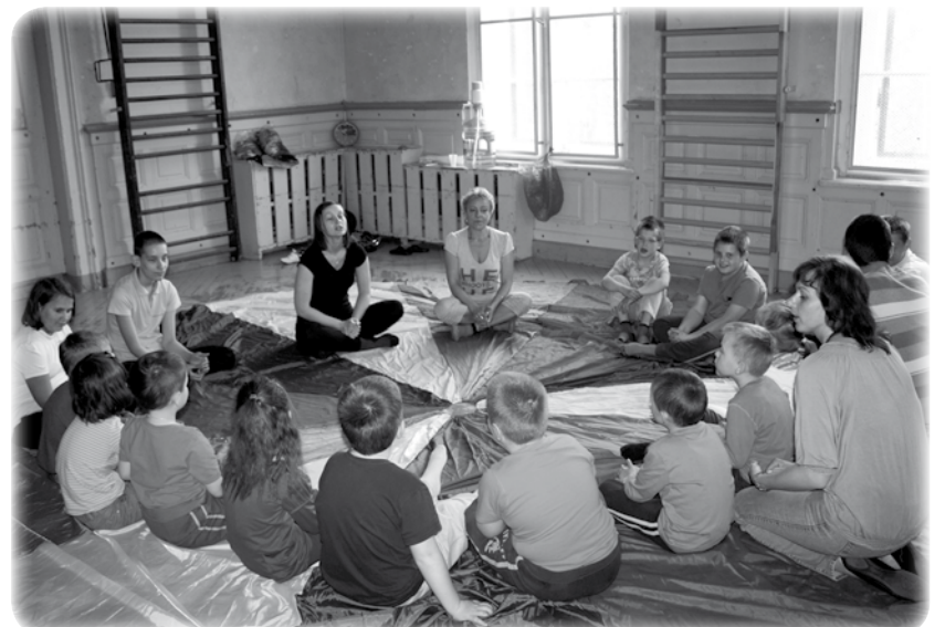
Spotkanie było także okazją do zaprezentowania Specjalnego Ośrodka Szkolno-Wychowawczego w Kwidzynie, w którym zorganizowano Dzień Otwarty.