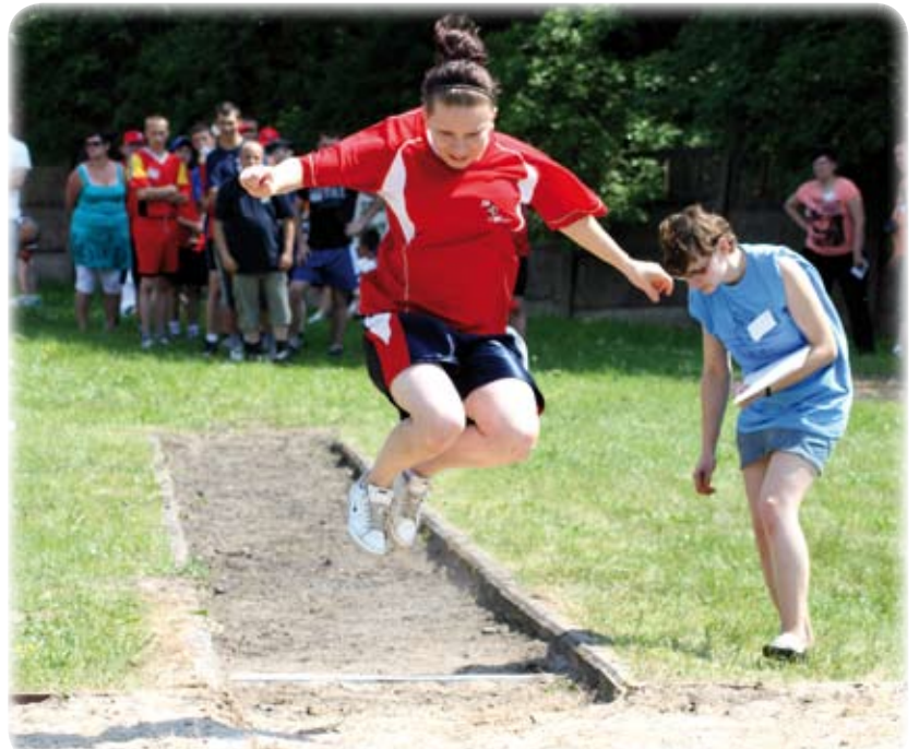
Skok w dal to jedna z najtrudniejszych konkurencji dla niepełnosprawnych zawodników.