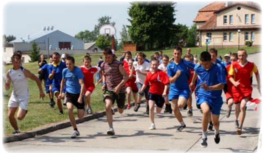
Minimaraton zawodników ze specjalnych ośrodków szkolno-wychowawczych i warsztatów terapii zajęciowej.