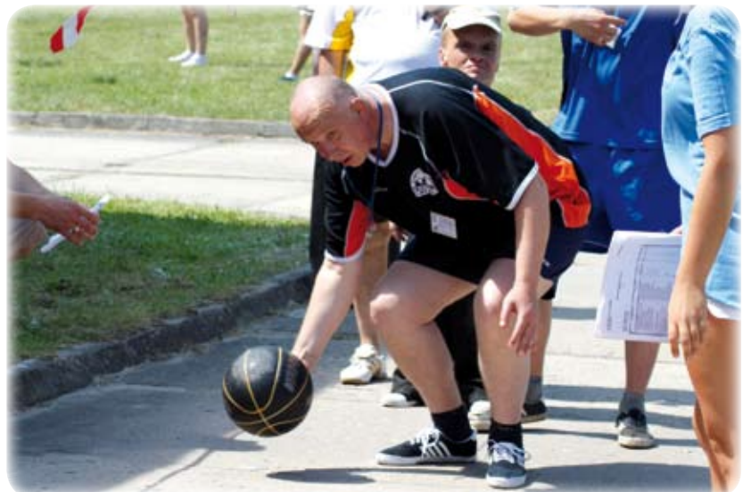
Jedną z konkurencji były kregle.