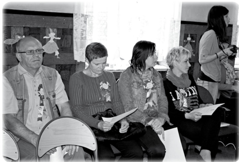
Rodzice dzieci osób z niepełnosprawnością intelektualną spotkali się w ramach Pomorskiego Programu Rodzinnego Olimpiad Specjalnych.

- Była to okazja, aby porozmawiać o codziennych problemach związanych z wychowywaniem niepełnosprawnych dzieci. Rodzice podkreślali jak ważny jest dla ich dzieci udział w zawodach organizowanych w ramach Olimpiad Specjalnych. Rodzice są pierwszymi, którzy w swoich dzieciach zawsze widzą