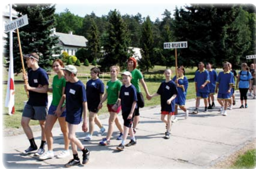
Ponad trzydzieści reprezentacji domów pomocy społecznej, warsztatów terapii zajęciowej, ośrodków szkolno-wychowawczych oraz innych placówek z województw kujawsko-pomorskiego, warmińsko-mazurskiego i pomorskiego wzięło udział w Igrzyskach Paraolimpijskich w Ryjewie.

- Cieszę się z tak dużego zainteresowania. Szczerze mówiąc, to mamy z tym problem, gdyż musimy ugościć wiele osób i zapewnić podczas igrzysk odpowiednią liczbę wolontariuszy. W tym roku padł prawdziwy rekord, gdyż zgłosiły się 34 zespoły. Spodziewaliśmy się ok. 23-24. Nikomu jednak nie odmawiamy. Cieszymy się z tak dużego zainteresowania. Chcę podkreślić, że Stowarzyszenie Pomocy Społecznej „Słoneczne Wzgórze” jest inicja-