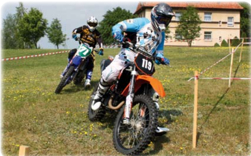
Specjalny pokaz dla uczestników paraolimpiady, podczas uroczystości otwarcia imprezy, przygotowali zawodnicy Kwidzyńskiego Klubu Motorowego im. Jana Młynarskiego.