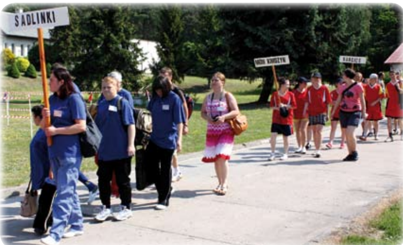
Igrzyska Paraolimpijskie otworzył przemarsz wszystkich ekip.