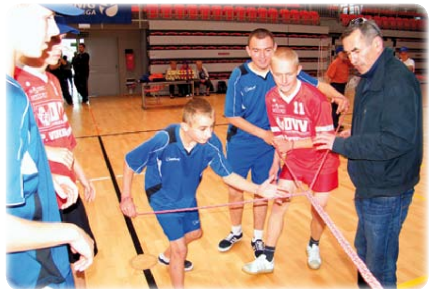
Mimo że była to tylko zabawa, zawodnicy nie oszczędzali swoich sił, aby zwyciężyć.