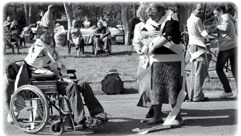
Bandażowanie partnera na czas, to jedna z konkurencji rodzinnych.