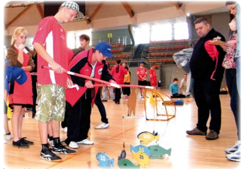
Łowienie rybek wymagało cierpliwości i opanowania.