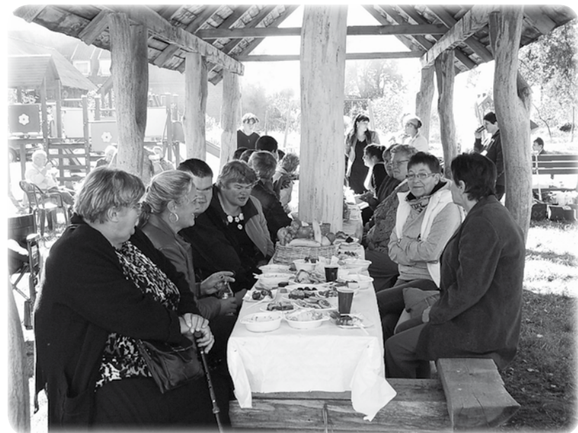
Spotkanie było okazją do porozmawiania między innymi na temat pracy Warsztatu Terapii Zajęciowej w Ryjewie.