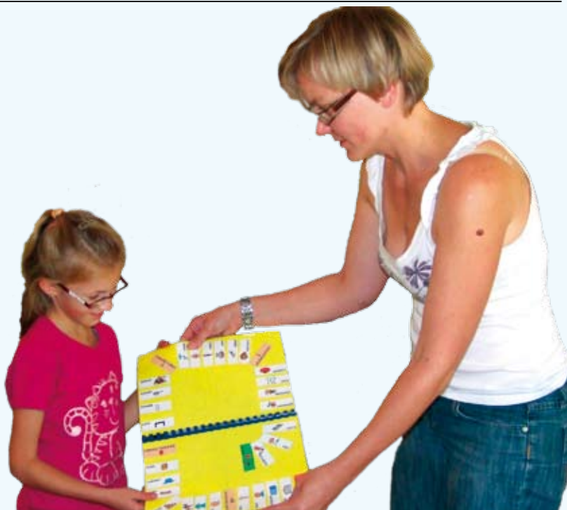
Stowarzyszenie Rehabilitacyjne Centrum Rozwoju Porozumienia w Kwidzynie od wielu lat niesie pomoc dzieciom, młodzieży oraz osobom dorosłym, które nie mówią w ogóle lub dla których komunikacja ze światem zewnętrznym jest utrudniona.