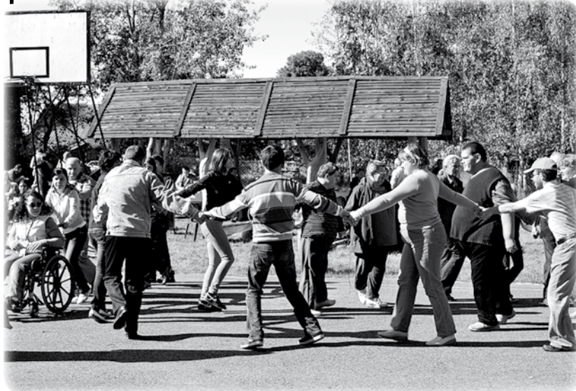
Uczestnicy Warsztatu Terapii Zajęciowej w Ryjewie wraz ze swoimi rodzinami bawili się podczas spotkania zorganizowanego w Benowie.

- Borykamy się z ciągłymi naprawami starych i wysłużonych już samochodów, przystosowanych do przewozu osób niepełnosprawnych. Bardzo trudno zebrać dziś kwotę na zakup nowego samochodu, bo dopłaty z Państwowego Funduszu Rehabilitacji Osób Niepełnosprawnych są aktualnie zbyt niskie, zaledwie 25 proc. wartości pojazdu - podkreśla