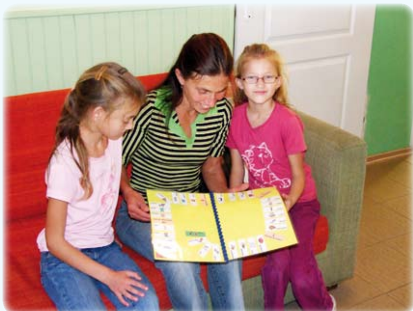
Z programu „Likwidacja barier w komunikowaniu się dzieci i młodzieży niepełnosprawnych lub zagrożonych niepełnosprawnością i ich rodziców z terenu powiatu kwidzińskiego” skorzystało już ponad 300 osób.

co zwracać uwagę - twierdzi rodzic jedno z dzieci objętych pomocą.