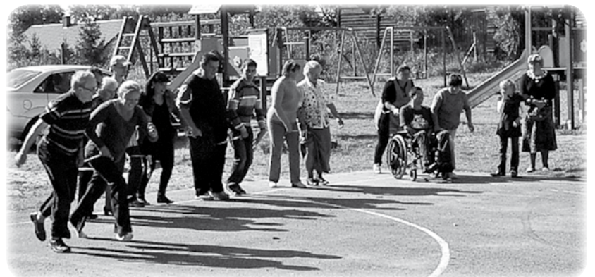
Podczas imprezy odbyły się zawody rodzinne.