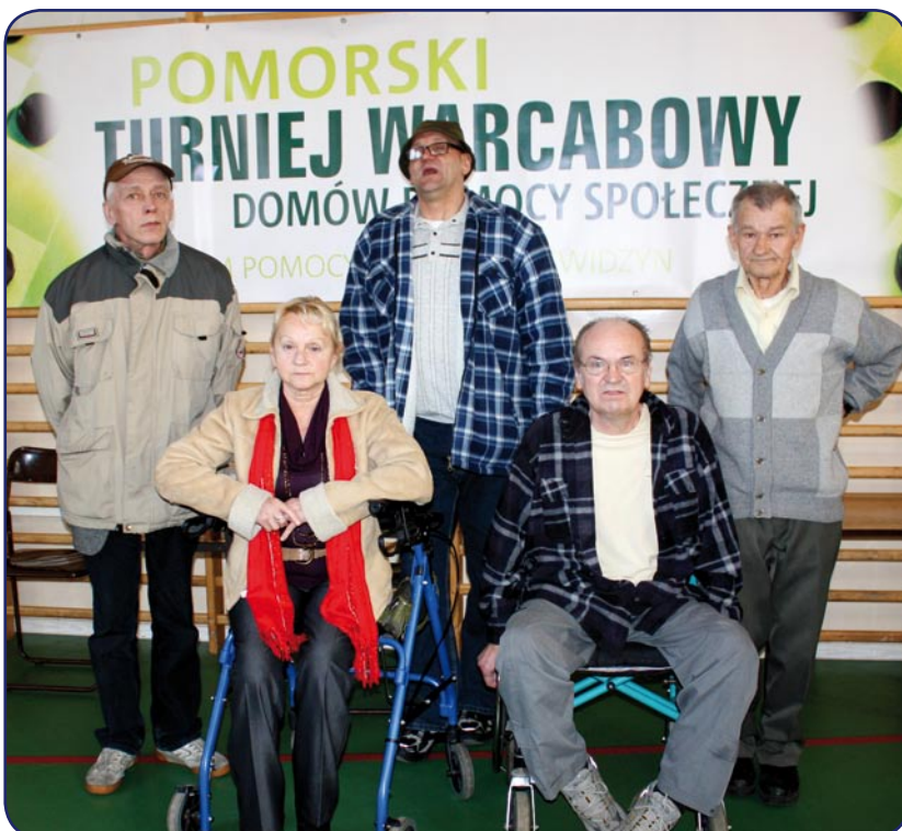
Reprezentacja gospodarzy, czyli Domu Pomocy Społecznej w Kwidzynie.