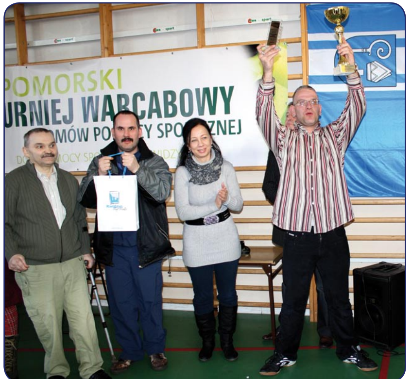
Warcabiści z Domu Pomocy Społecznej w Strzebielinku okazali się najlepsi w turnieju.