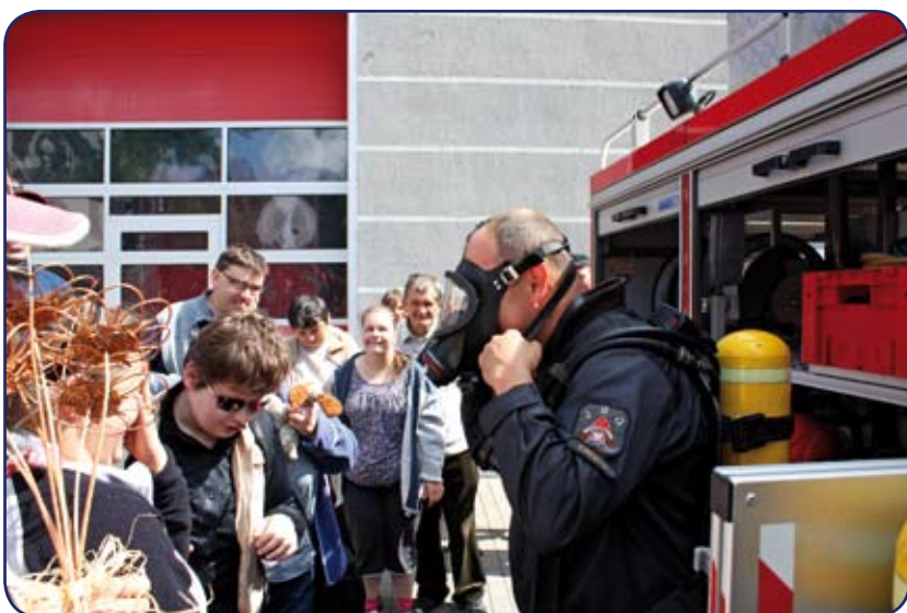
Strażacy z humorem i pasją opowiadali o swojej pracy.