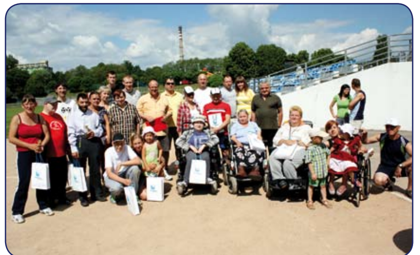
Uczestnicy i organizatorzy XV Mistrzostw Bocce dla Niepełnosprawnych.