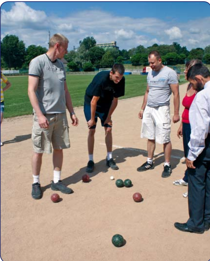
Wyrównana walka wymagała bardzo uważnego liczenia punktów.