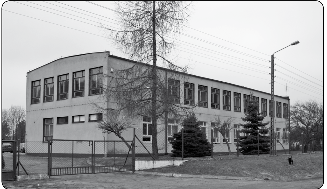
Fundacja Wspierania Społeczności Lokalnych „Sapere Aude” uzyskała ponad 49 tys. zł na likwidację barier architektonicznych w Ośrodku Rehabilitacyjno-Edukacyjno-Wychowawczym w Okrągłej Łące.

Przypomnijmy, że o pieniądze z programu mogą ubiegać się między innymi instytucje, samorządy i organizacje pozarządowe. Obszar A dotyczy dofinansowania zakupu wyposażenia obiektów, służących rehabilitacji osób niepełnosprawnych. Obszar B obejmuje likwidację barier w zakładach opieki zdrowotnej, urzędach i placówkach edukacyjnych. W obszarze C można uzyskać dofinansowanie pokrywające część kosztów