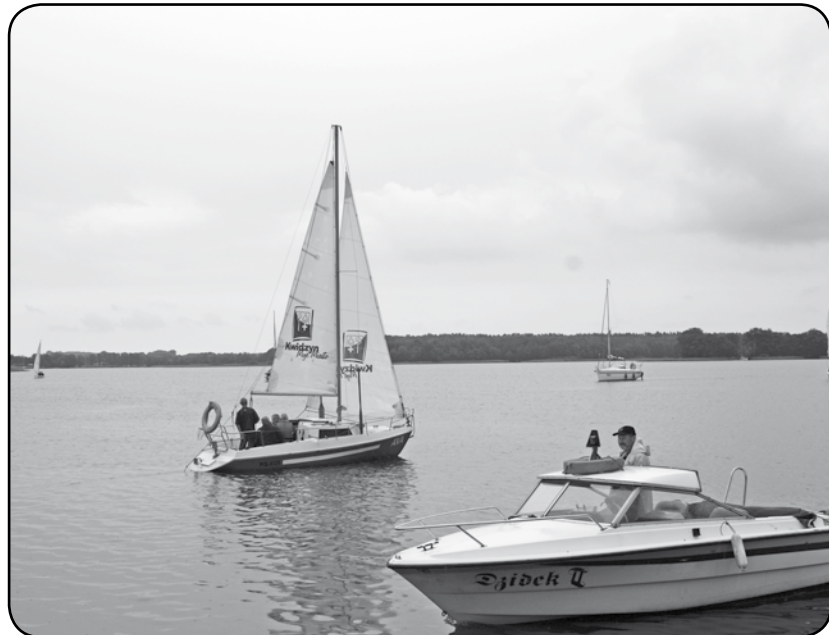
Dwa projekty zamierza zrealizować w tym roku Pomorskie Stowarzyszenie Żeglarzy Niepełnosprawnych w Kwidzynie.

Dwa projekty zamierza zrealizować w tym roku Pomorskie Stowarzyszenie Żeglarzy Niepełnosprawnych w Kwidzynie. Pod koniec ubiegłego roku Państwowy Fundusz Rehabilitacji Osób Niepełnosprawnych zakwalifikował do dofinansowania projekty organizacji. Pierwszy z nich dotyczy między innymi warsztatów motorowodnych w Giżycku.