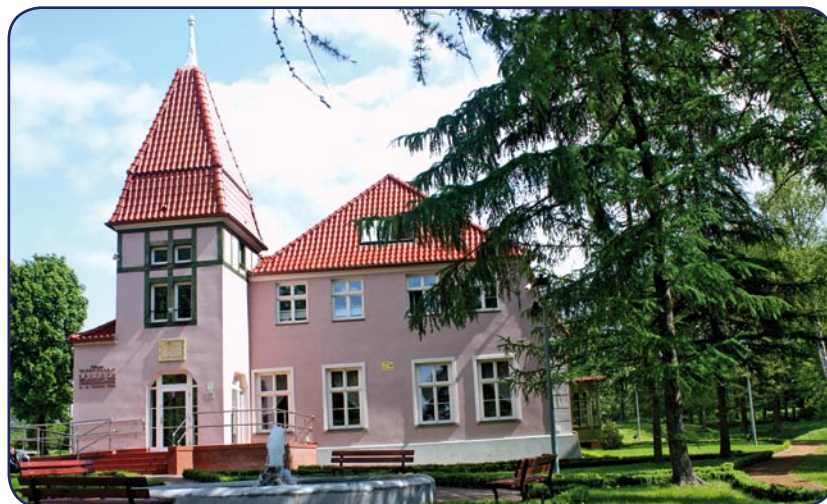
Od pierwszego stycznia 2004 roku prowadzi go kwidzyńska Fundacja „Misericordia”, w zabytkowym dworze w Górkach.

W zajęciach terapeutycznych, prowadzonych w warsztacie uczestniczy obecnie 47 osób niepełnosprawnych z powiatu kwidzyńskiego. (jk)