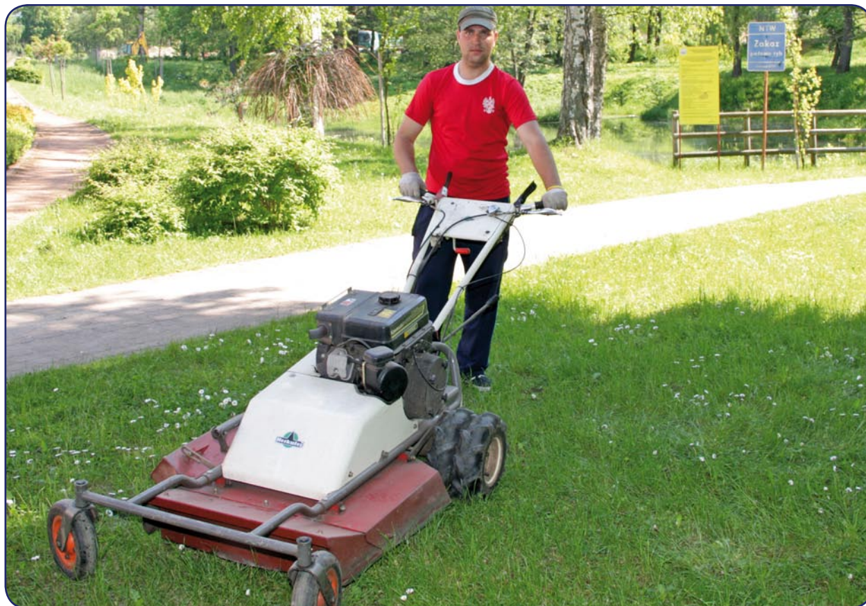
Warsztat Terapii Zajęciowej w Kwidzynie, z siedzibą w Górkach, wkroczył w 22 rok swojej działalności. W ramach warsztatu działa między innymi pracownia ogrodniczo-gospodarcza.

- Na brak zwiększania środków na funkcjonowanie Warsztatów Terapii Zajęciowej od 2008 roku oraz na niskie płace specjalistów, pracujących we wszystkich WTZ zwróciłem uwagę podczas konferencji, dotyczącej konwencji o prawach