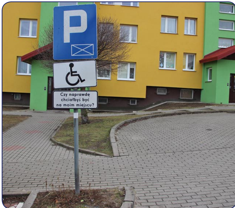
Nowy system wydawania kart dotyczy wyłącznie osób o znacznym i umiarkowanym stopniu niepełnosprawności, które mają znacznie ograniczone możliwości samodzielnego poruszania się.

Przypomnijmy, że nowy system wydawania kart dotyczy wyłącznie osób o znacznym i umiarkowanym stopniu niepełnosprawności, które mają znacznie ograniczone możliwości samodzielnego poruszania się. W przypadku umiarkowanego stopnia niepełnosprawności karta przysługuje jedynie osobie z określoną przyczyną niepełnosprawności oznaczoną symbolem 04-O (choroby narządu wzroku), 05-R (upośledzenie narządu ruchu) lub 10-N (choroba neurologiczna), przy czym nie każdej osobie posiadającej orzeczenie o stopniu znacznym lub umiarkowanym z powyższymi symbolami, zostanie przyznana karta parkingowa. Zależy to od decyzji lekarza orzecznika oraz stopnia naruszenia sprawności organizmu.