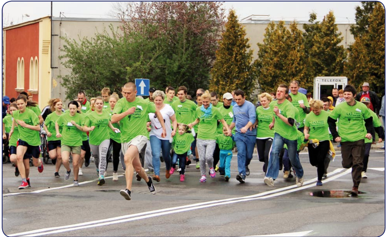
Po raz dziesiąty odbył się w Kwidzynie Bieg Osób Niepełnosprawnych. Impreza towarzyszyła Unijnemu Ogólnopolskiemu Biegowi Ulicznemu.

Niepełnosprawni startowali w kilku kategoriach wiekowych. Na starcie nie zabrakło osób niepełnosprawnych na wózkach elektrycznych. Była także kategoria wózków pchanych, w której sprawnością i wytrzymałością musieli wykazać się opiekunowie osób niepeł-