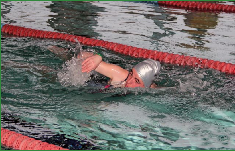
Mityng udowadnia, że osoby niepełnosprawne mogą z powodzeniem strataować w tak trudnych dyscyplinach, jak pływanie.