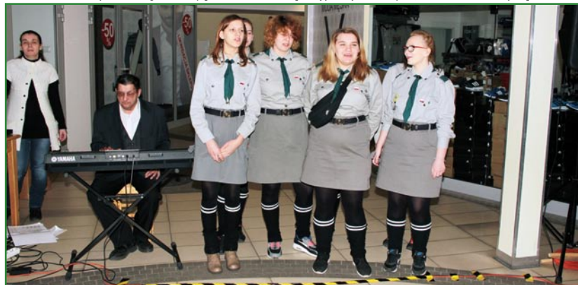
Tradycyjnie w kiermaszach uczestniczą harcerki z Młodzieżowego Ośrodka Wychowawczego w Kwidzynie.