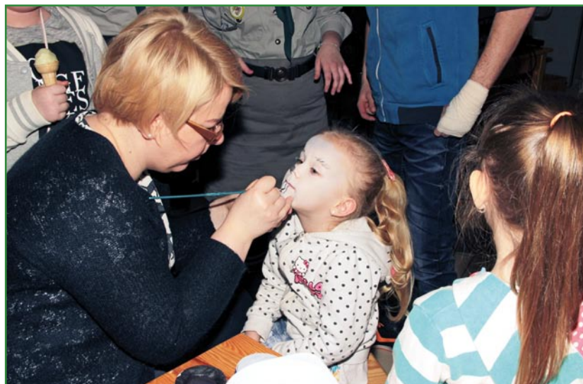
Malowanie twarzy cieszyło się dużym powodzeniem u najmłodszych uczestników kiermaszu.