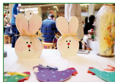
Dochód ze sprzedaży wszystkich wyrobów, wykonanych przez uczestników Warsztatu Terapii Zajęciowej w Kwidzynie, w całości zostanie przeznaczony na rehabilitację społeczną i zawodową.