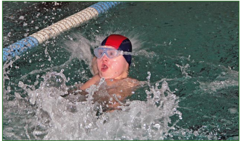
Zawodnicy dali z siebie wszystko, aby osiągnąć jak najlepsze wyniki.