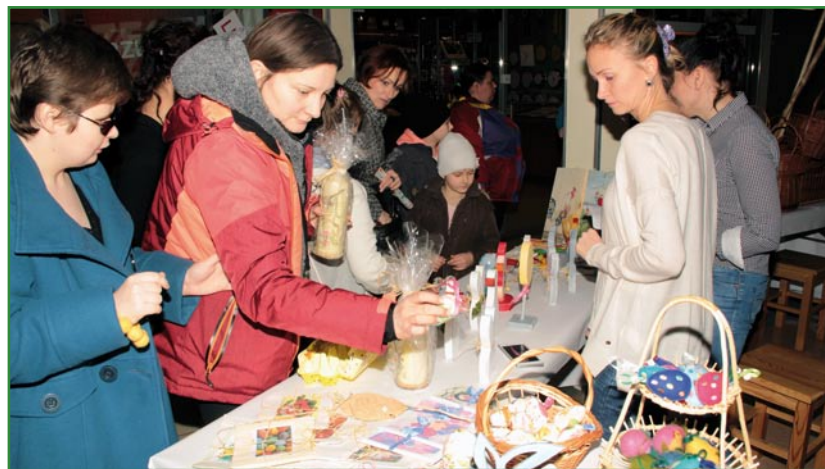
Stoiska były pełne świątecznych ozdób, wykonanych przez niepełnosprawnych uczestników WTZ.