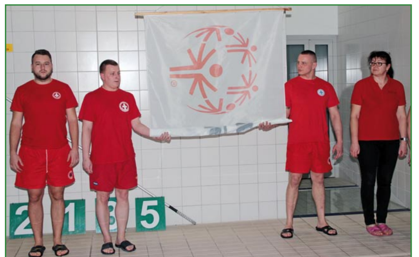
W organizacji mityngu pomogli ratownicy z Wodnego Ochotniczego Pogotowia Ratunkowego.