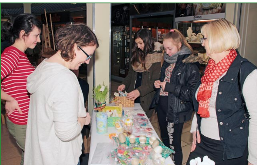
Stoisko Świetlicy Środowiskowej Stowarzyszenia Rodzin Katolickich.