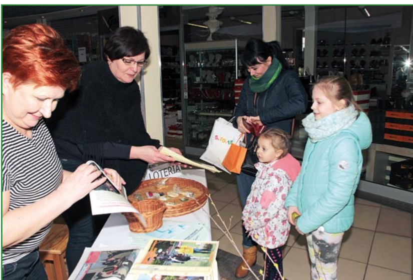
Podczas kiermaszu nie mogło zabraknąć świątecznej loterii. Każdy los wygrał.

W Galerii Handlowej Kopernik odbył się kiermasz wielkanocny, zorganizowany przez Warsztat Terapii Zajęciowej w Kwidzynie, prowadzony przez Fundację „Misericordia”. Współorganizatorzy to Świetlica Środowiskowa Stowarzyszenia Rodzin Katolickich w Kwidzynie, Młodzieżowy Ośrodek Wychowawczy w Kwidzynie oraz Galeria Handlowa Kopernik. Podczas kiermaszu można było kupić wielkanocne ozdoby oraz inne wyroby, przygotowane przez niepełnosprawnych uczestników warsztatu oraz świetlicę środowiskową. Przygotowane zostały także warsztaty artystyczne podczas których można było między innymi przygotować świąteczną kartkę oraz stworzyć palmę wielkanocną. Dochód ze sprzedaży wszystkich wyrobów wykonanych przez uczestników Warsztatu Terapii Zajęciowej w Kwidzynie w całości zostanie przeznaczony na rehabilitację społeczną i zawodową.