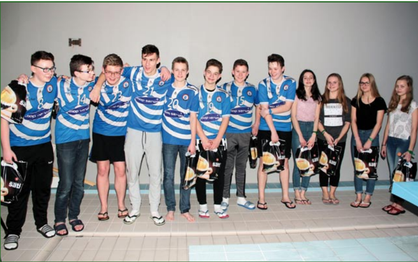
Niemożliwa byłaby organizacja mityngu bez wsparcia wolontariuszy.