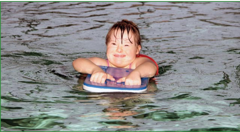
Zawodnicy o nieco mniejszych możliwościach pływackich mieli do pokonania dystans 15 m.