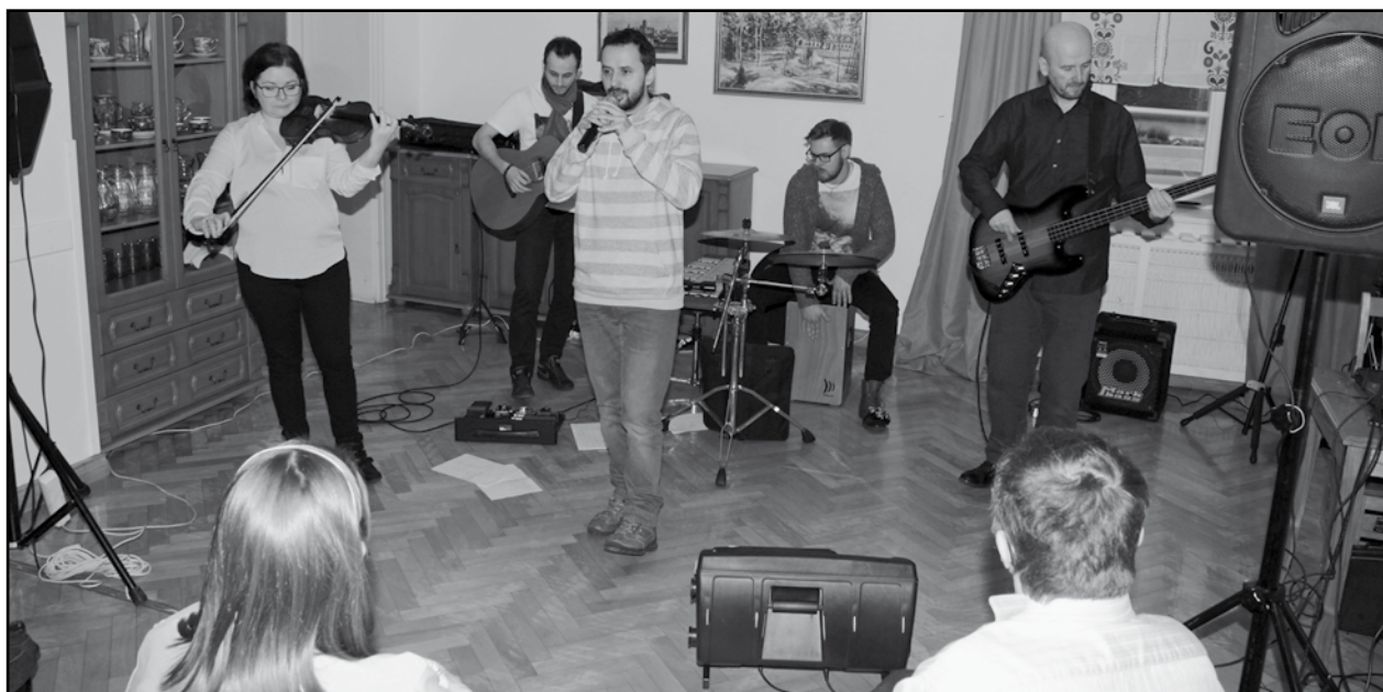
Muzycy zagrali i zaśpiewali dla niepełnosprawnych uczestników warsztatu oraz wychowanek Młodzieżowego Ośrodka Wychowawczego w Kwidzynie.