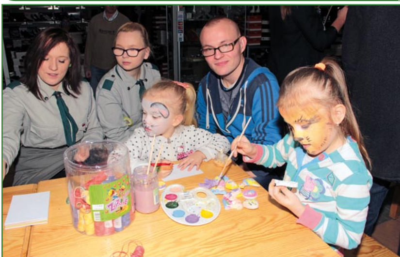
Malowanie świątecznych ozdób podczas warsztatów artystycznych.