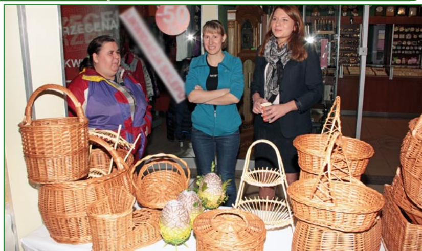
Kiermasz wielkanocny został zorganizowany przez Warsztat Terapii Zajęciowej w Kwidzynie, w Galerii Handlowej Kopernik.