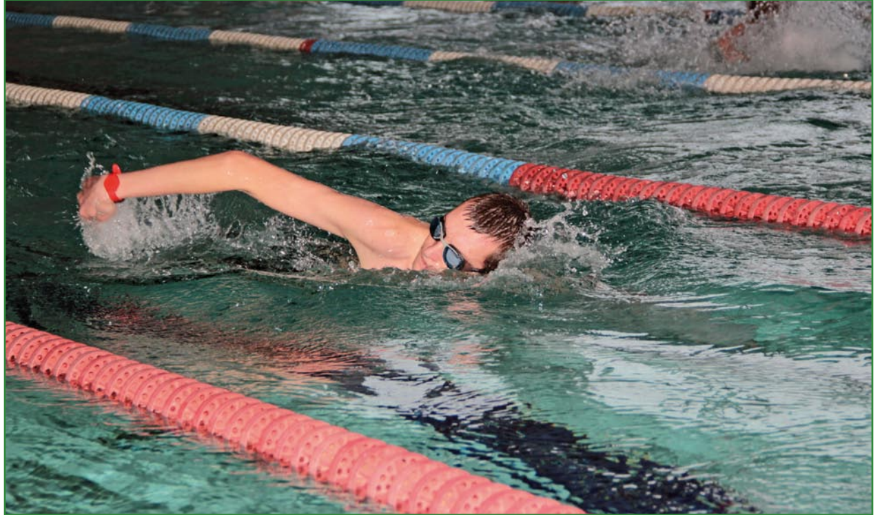
Niepełnosprawni pływacy z województwa pomorskiego wzięli udział w Pomorskim Mityngu Pływackim Olimpiad Specjalnych.

W zawodach wystartowali zawodnicy z domów pomocy społecznej w Kwidzynie i Ryjewie, Zespołu Szkół Specjalnych w Kwidzynie i Warsztatu Terapii Zajęciowej w Kwidzynie.