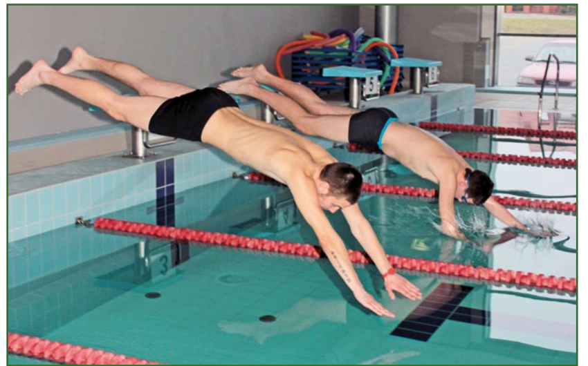
W zawodach wzięło udział dziesięć klubów Olimpiad Specjalnych z całego województwa.