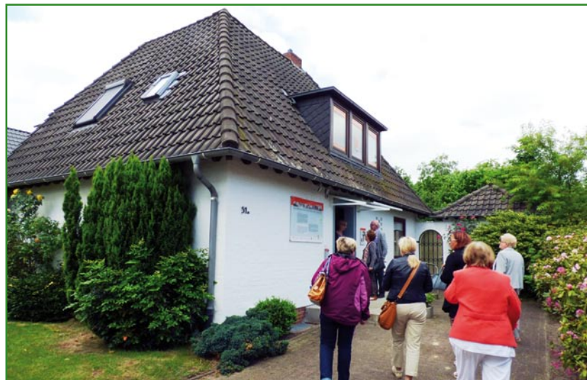
Delegacja z powiatu kwidzyńskiego odwiedziła między innymi „Musterhaus zum Wohnen mit Zukunft”, dom dostosowany dla osób starszych.