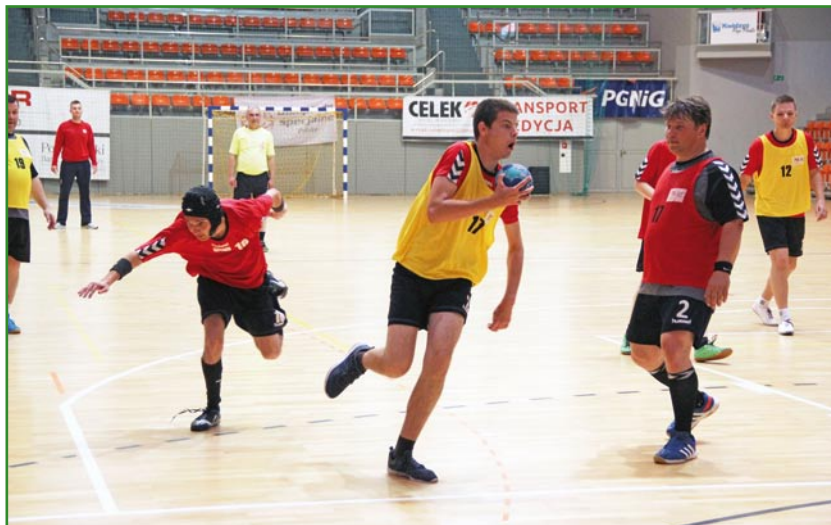
Mecz został rozegrany w ramach programu Sportów Zunifikowanych. To program Olimpiad Specjalnych, który pozwala na wspólną rywalizację sportowców niepełnosprawnych intelektualnie oraz w pełni sprawnych.