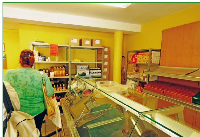
W Schwanewede funkcjonuje organizacja „Tafel in Schwanewede Lebensmittel an Bedürftige”, która zajmuje się zdobywaniem i gromadzeniem artykułów spożywczych ze sklepów sieciowych, których termin przydatności do spożycia się kończy. Towary są rozdzielane osobom potrzebującym. Na zdjęciu: miejsce wydawania towarów