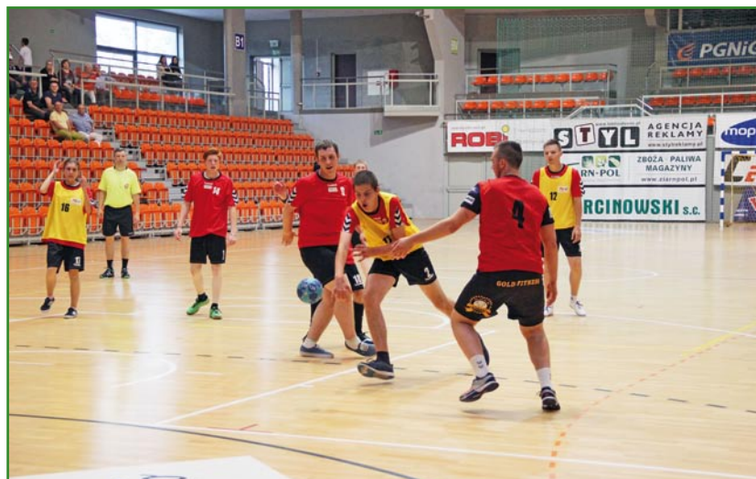
Podobnie jak w ubiegłym roku skład drużyny złożony jest z proporcjonalnej liczby zawodników i partnerów, czyli zawodników w pełni sprawnych.