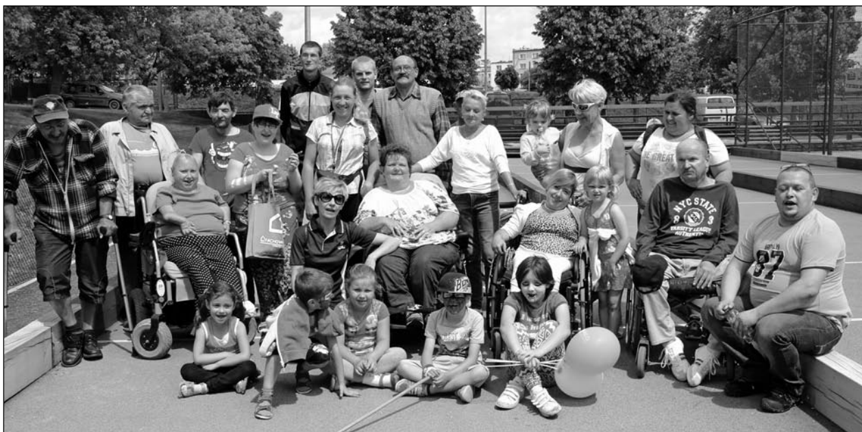
Uczestnicy siedemnastej edycji Mistrzostw Bocce dla Niepełnosprawnych. Organizatorem imprezy w tym roku było Kwidzyńskie Centrum Sportu i Rekreacji.