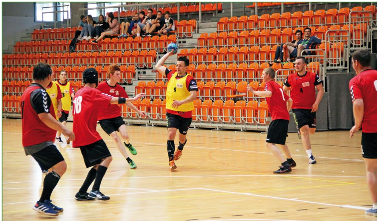
Podczas Dni Kwidzyna drużyny Olimpiad Specjalnych Polska i MMTS Kwidzyn rozegrały pokazowy mecz piłki ręcznej.