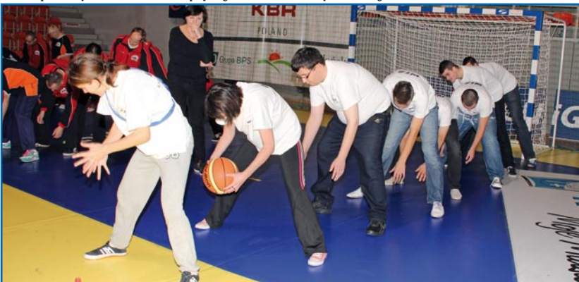
W olimpiadzie wzięła udział reprezentacja Warsztatu Terapii Zajęciowej w Kwidzynie