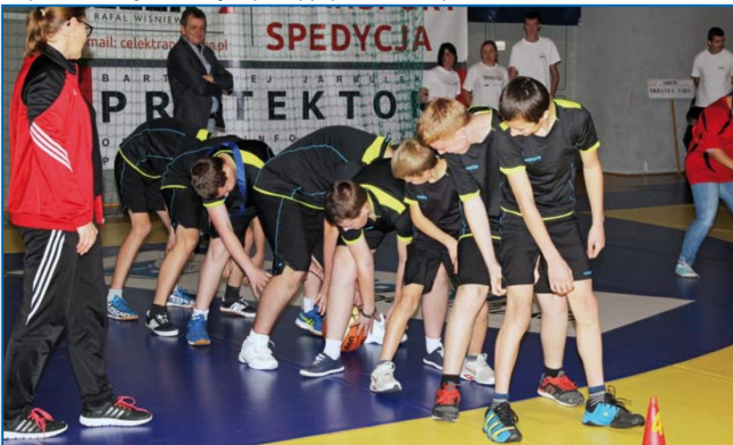
Toczenie piłki w wykonaniu zawodników Specjalnego Ośrodka Szkolno-Wychowawczego w Barcicach.