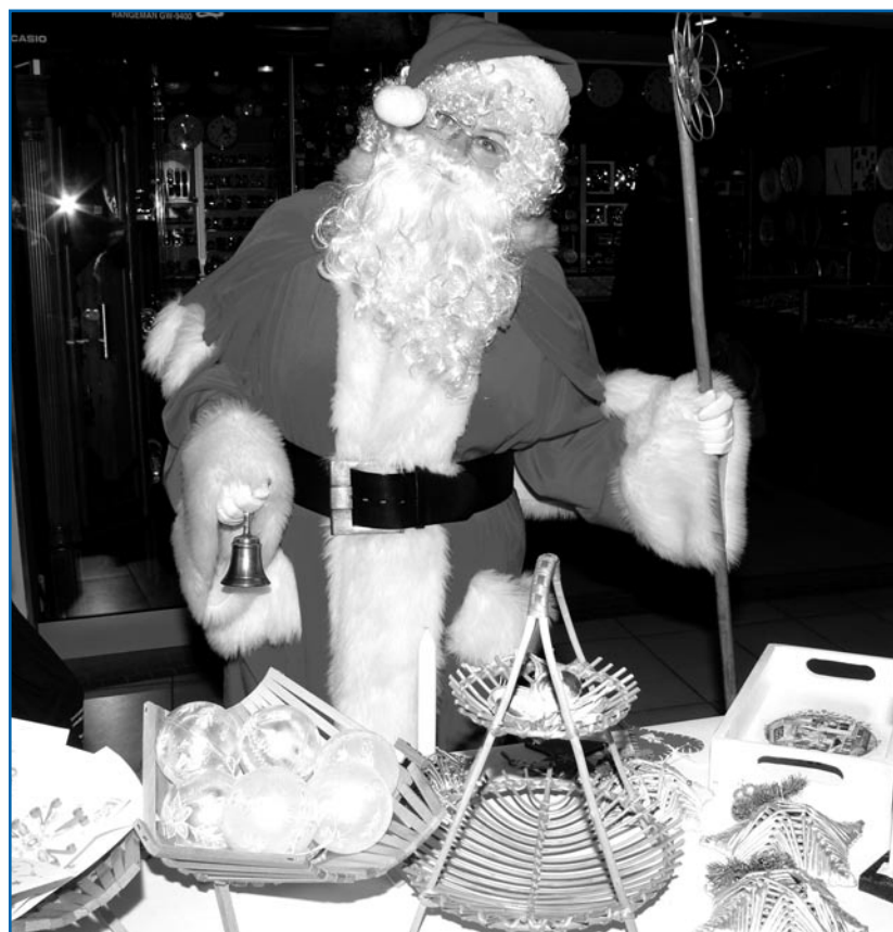
Świąteczny kiermasz wyrobów wykonanych w Warsztacie Terapii Zajęciowej w Kwidzynie odbędzie się 10 grudnia (sobota) w godz. 10-13 w Galerii Handlowej Kopernik.