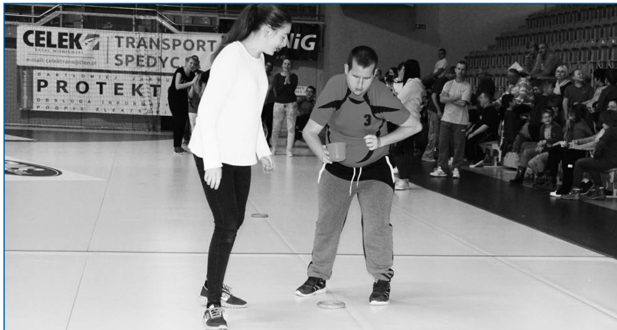
Niepełnosprawne osoby z różnych ośrodków z całego powiatu rywalizowały podczas Halowej Olimpiady Osób Niepełnosprawnych. Organizatorem imprezy jest Kwidziński Klub Lekkoatletyczny Rodło.

- Do tej pory tylko kibicowałem. W tym roku postanowiłem wystartować we wszystkich konkurencjach. Bardzo mi się podobało. Dobrze się bawiłem i chciałbym wziąć udział w kolejnych zawodach - powiedział