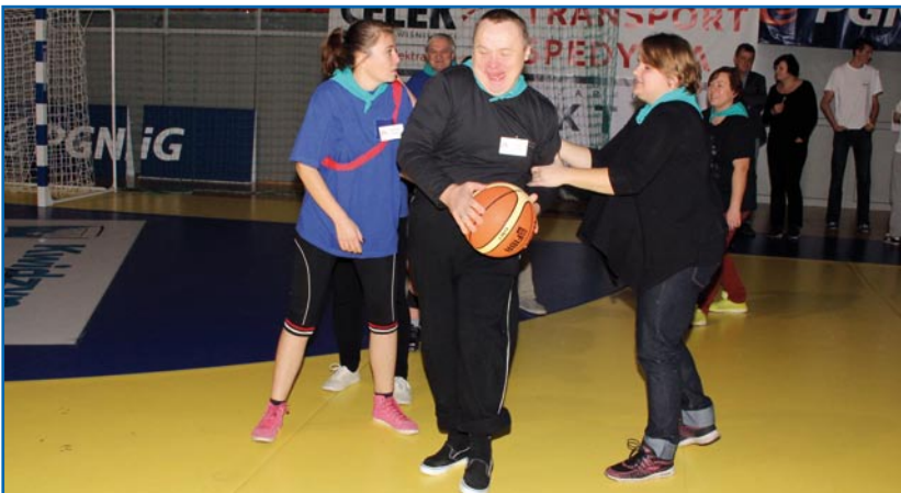
Drużyna Środowiskowego Domu Samopomocy z Okrąglej Łąki dała z siebie wszystko.