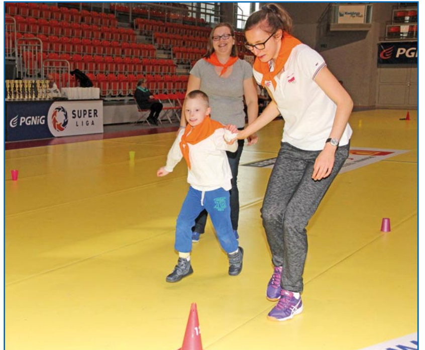
Dla wszystkich, w tym uczestników olimpiady z Ośrodka Rehabilitacyjno-Edukacyjno-Wychowawczego, impreza to przede wszystkim dobra zabawa.