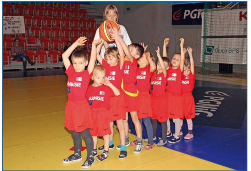
Gumisie z Przedszkola Integracyjnego w Kwidzynie bardzo dobrze przygotowali się do zawodów.