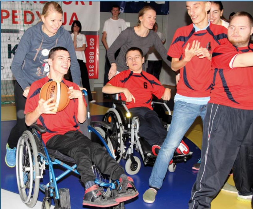
Zawodnicy z Zespołu Szkół Specjalnych w Kwidzynie podczas jednej z konkurencji

Po raz piątą odbyła się Halowa Olimpiada Osób Niepełnosprawnych. Konkurencje w formie zabawowej rozegrano w hali wodowiskowo-sportowej przy ul. Wiejskiej w Kwidzynie.