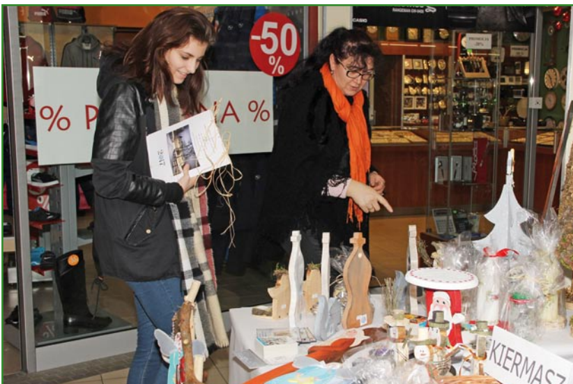
Osoby, które szukały oryginalnych ozdób, które upiększą mieszkania podczas świąt Bożego Narodzenia, miały w czym wybierać.