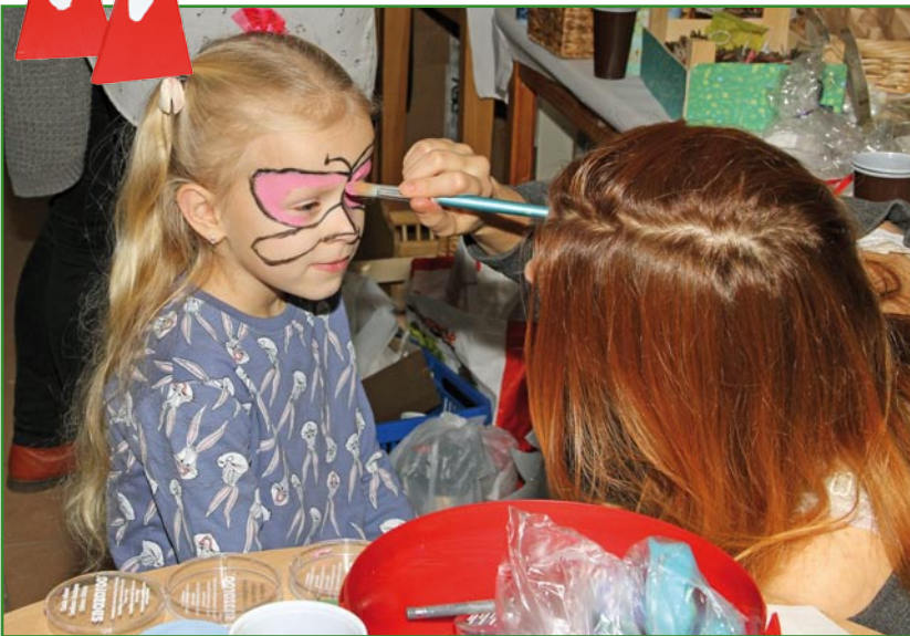
Malowanie twarzy to jedna z propozycji Światlic Środowiskowych Stowarzyszenia Rodzin Katolickich w Kwidzynie.