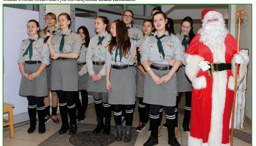
W świąteczny nastrój wprowadziły wszystkich harcerki z 68 Drużyny Harcerskiej „Wesołe Włóczęgi” im Marii Grzegorzewskiej, działającej w Młodzieżowym Ośrodku Wychowawczym w Kwidzynie.