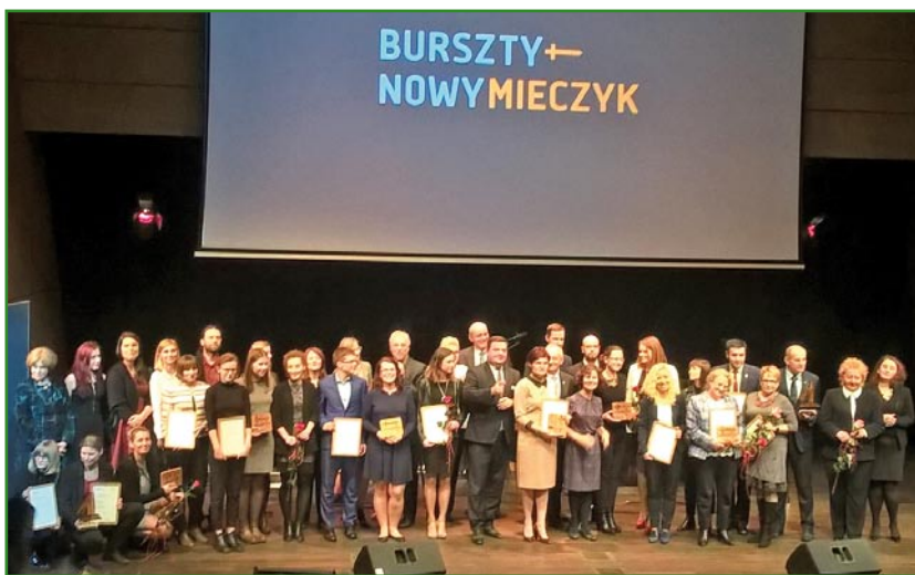
Nagrody wręczone zostały w trakcie gali w Europejskim Centrum Solidarności w Gdańsku.