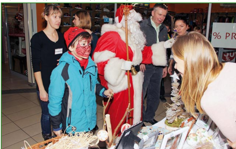
Wszystkie ozdoby zostały wykonane podczas zajęć prowadzonych dla niepełnosprawnych uczestników WTZ w Kwidzynie.