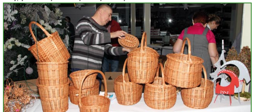
Pieniądze ze sprzedaży w całości przeznaczane są na rehabilitację społeczną i zawodową uczestników WTZ w Kwidzynie.