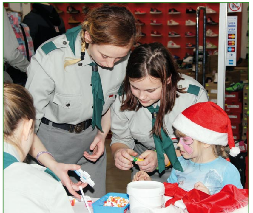
Podczas kiermaszu odbyły się artystyczne warsztaty.