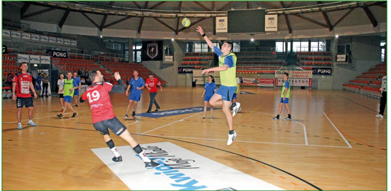
Turniej Regionalny Zunifikowanej Piłki Ręcznej Olimpiad Specjalnych odbył się w Kwidzynie. To pierwsze tego typu zawody w kraju zorganizowane w tej dyscyplinie.

- Bardzo się cieszę, że tak dużo imprez organizowanych jest dla osób niepełnosprawnych w naszym powiecie. Stworzony został cały cykl różnych imprez, turniejów i zawo-