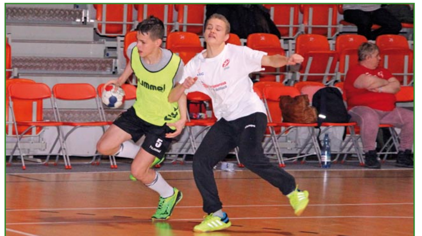
Walka była zacięta, ale jako podkreślają organizatorzy liczył się przede wszystkim udział. Medale otrzymali wszyscy uczestnicy.

Regionalny Olimpiad Specjalnych Polska Pomorskie, Klub Olimpiad Specjalnych „Olimp” przy Zespole Szkół Specjalnych w Kwidzynie,