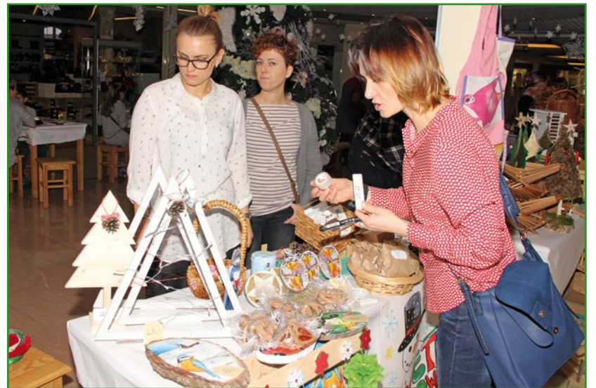
Stoisko Światlic Środowiskowych Stowarzyszenia Rodzin Katolickich.