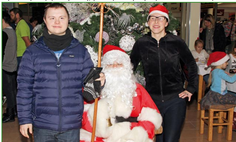
Nie mogło zabraknąć pamiątkowego zdjęcia z Mikołajem.