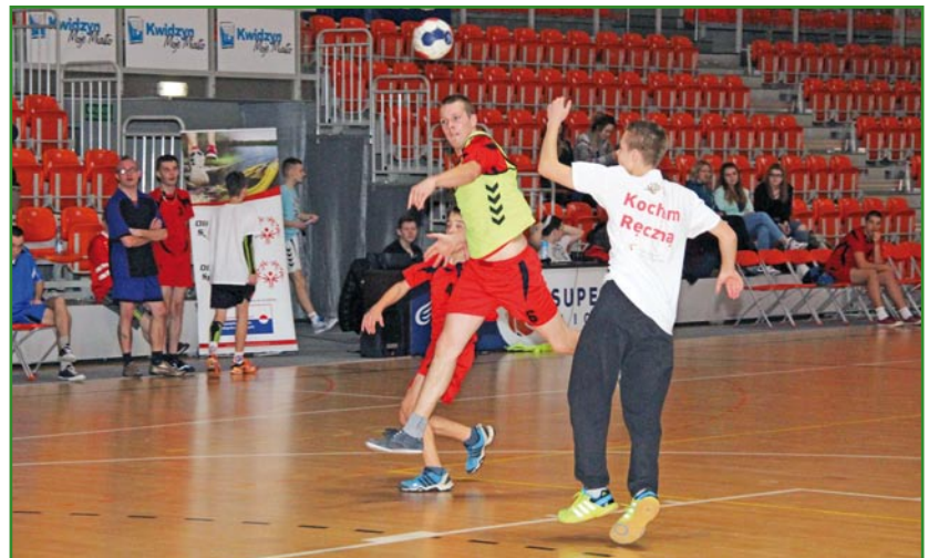
Kwidzyn stał się miejscem, w którym do Olimpiad Specjalnych wkracza tak popularna w mieście piłka ręczna.

Zgodnie z ideą sportów zunifikowanych w skład każdej drużyny wchodzi proporcjonalna liczba zawodników niepełnosprawnych i partnerów, czyli zawodników w pełni sprawnych. Podczas pierwszego tur-