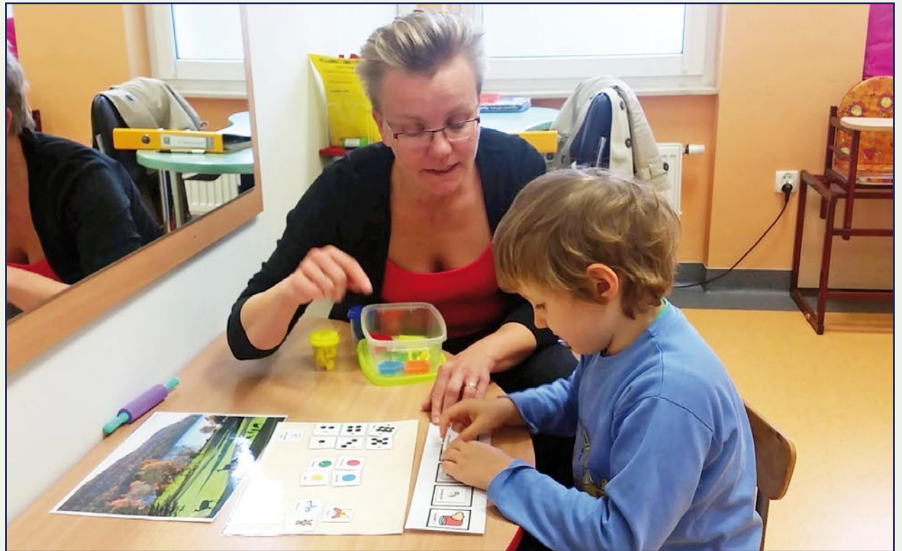
Dzieci z zaburzeniami w porozumiewaniu się kolejny rok mogły liczyć na wsparcie Stowarzyszenia Rehabilitacyjnego Centrum Rozwoju Porozumiewania w Kwidzynie.

- Materiały były przygotowywane podczas realizacji projektów w poprzednich latach. To między innymi: pielęgnacja dziecka - pozycje do karmienia i odbicia przy karmieniu piersią i butelką, pielęgnacja dziecka z zaburzeniami ruchowymi - noszenie dziecka - cztery sposoby,