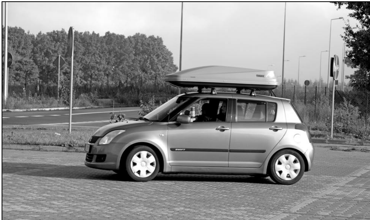
W ubiegłym roku do Powiatowego Centrum Pomocy Rodzinie w Kwidzynie wpłynęło 27 wniosków, w tym na dofinansowanie prawa jazdy.

Do połowy kwietnia potrwa realizacja programu „Aktywny samorząd”. To program Państwowego Funduszu Rehabilitacji Osób Niepełnosprawnych, w którym kolejny już rok uczestniczy samorząd powiatu. Dofinansowanie można uzyskać między innymi na zakup i montaż oprzyrządowania do posiadanego samochodu, uzyskania prawa jazdy kategorii B lub zakupu sprzętu komputerowego. W ubiegłym roku do Powiatowego Centrum Pomocy Rodzinie w Kwidzynie wpłynęło 27 wniosków, w tym na dofinansowanie prawa jazdy.