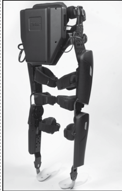
Re-Walk to egzozskielet, który umożliwia osobom z uszkodzeniami rdzenia kręgowego normalne poruszanie się.

Re-Walk to egzozskielet, który umożliwia osobom z uszkodzeniami rdzenia kręgowego normalne poruszanie się. Są dostępne dwa modele - do codziennego poruszania się i do rehabilitacji. Egzozskielet ten zyskał