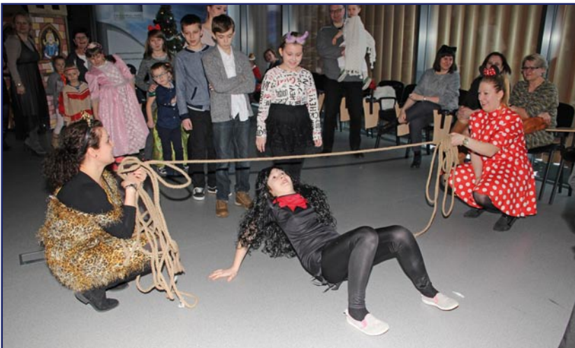
Zespół ds. Pieczy Zastępczej z Powiatowego Centrum Pomocy Rodzinie przygotował różnego rodzaju konkursy i zabawy.

Zastępczej z naszego centrum przygotował różnego rodzaju konkursy i zabawy. Dla dzieci przygotowane zostały także warsztaty teatralne. Dla wszystkich przygotowany został poczęstunek. Rodziny zastępcze