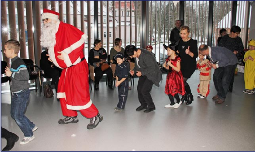
Ponad 120 dzieci z rodzin zastępczych bawiło się podczas balu karnawałowego.

Ponad 120 dzieci z rodzin zastępczych bawiło się podczas balu karnawałowego. Impreza została zorganizowana w siedzibie Kwidzyńskiego Parku Przemysłowo-Technologicznego. Organizatorem balu było Powiatowe Centrum Pomocy Rodzinie w Kwidzynie.