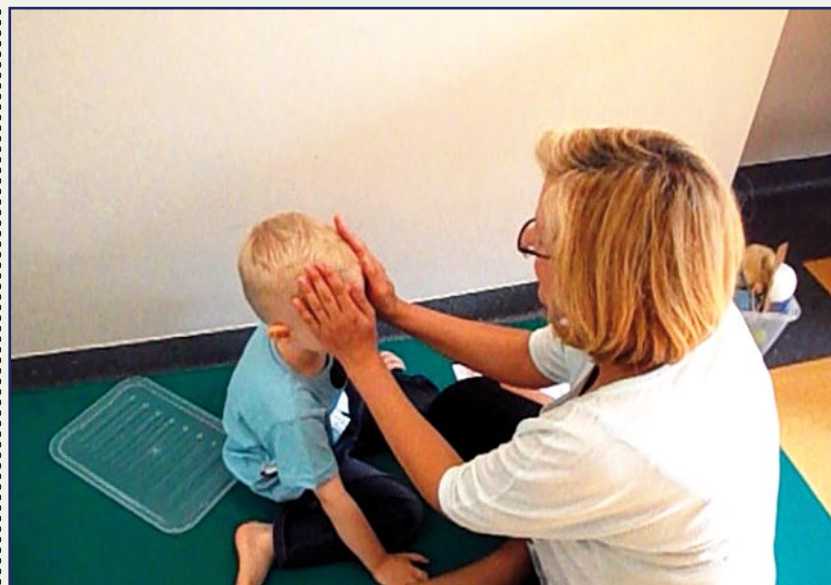
Z pomocy, w ramach projektu „Wspomaganie umiejętności porozumiewania się - likwidacja barier w komunikowaniu się dzieci i młodzieży niepełnosprawnych lub zagrożonych niepełnosprawnością i ich rodziców z terenu powiatu kwidzyńskiego” skorzystało kilkaset dzieci.

- Wyniki badań ankietowych zostały opublikowane na stronie internetowej naszego stowarzyszenia oraz na facebooku. 100 proc. badanych stwierdziło, że należy