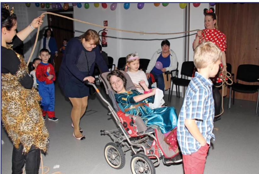
Organizatorem balu było Powiatowe Centrum Pomocy Rodzinie dla dzieci z rodzin zastępczych.

Oprócz dzieci w zabawie uczestniczyło ok. 50 rodziców zastępczych. (jk)