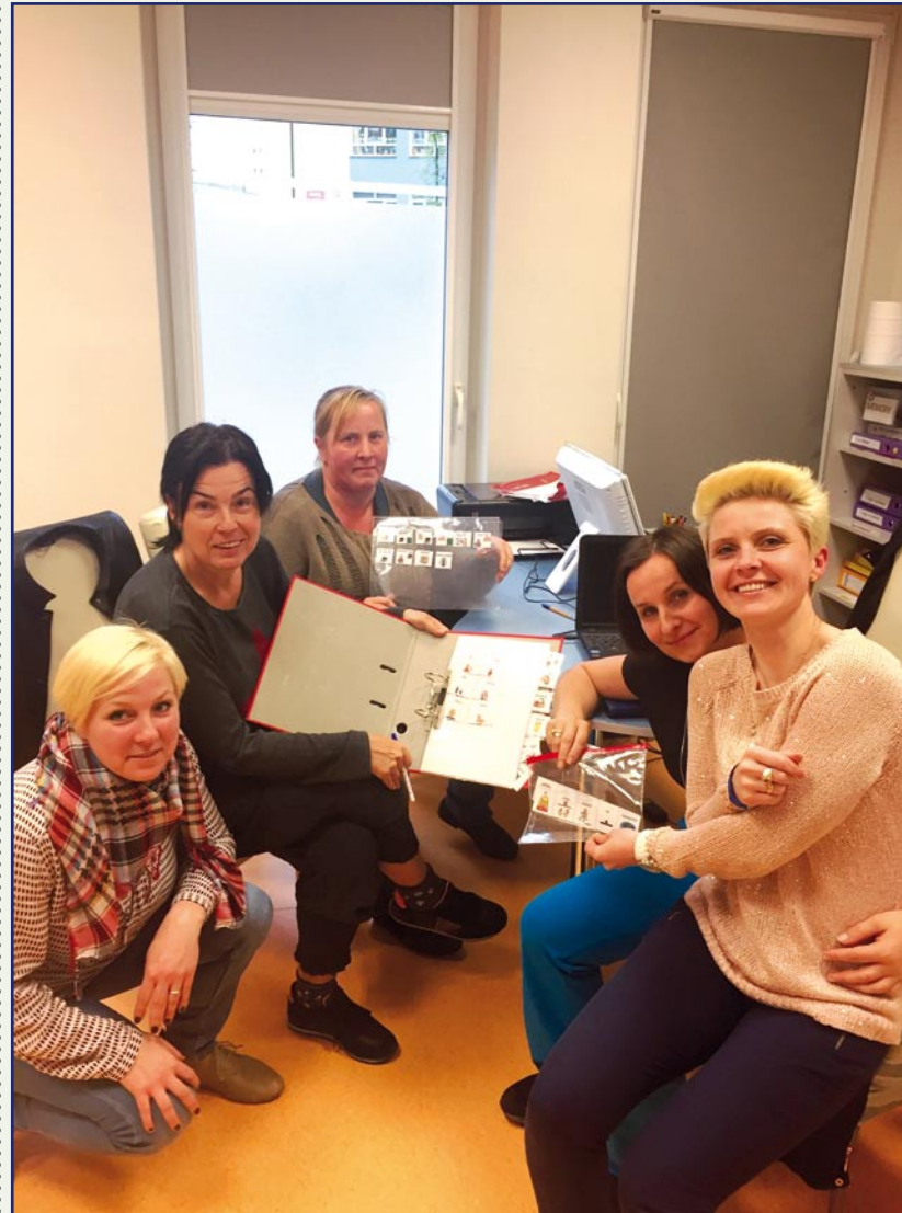
Za realizacją projektu stoją specjaliści. Każde dziecko objęte było opieką 3 lub 4 osobowego zespołu, w którym znajdowali się między innymi psycholog, logopeda, pedagog, terapeuta zajęciowy, rehabilitant lub informatyk.

- Ważne jest by budowanie systemu komunikacyjnego oparte było na aktywnym modelu uczestnictwa składającym się z diagnozy, strategii terapeutycznych oraz superwizji.