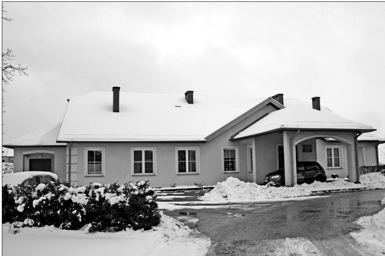
Na ok. 1,5 mln zł szacowany jest koszt rozbudowy budynku Hospicjum im. św. Wojciecha w Kwidzynie. Placówka prowadzona jest przez Kwidzyńskie Towarzystwo Przyjaciół Chorych.

W 2014 roku samorząd powiatu został członkiem wspierającym Kwidzyńskie Towarzystwo Przyjaciół Chorych w Kwidzynie. Jak uzasadniał wówczas Włodzimierz