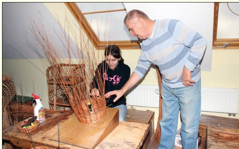
Pracownia wikliniarska, to jedna z pracowni funkcjonujących w Warsztacie Terapii Zajęciowej.

liwi samodzielne funkcjonowanie. Podczas zajęć niepełnosprawni mieszkańcy powiatu kwidzyńskiego zdobywają wiele umiejętności, które