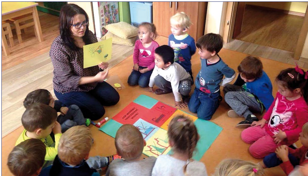
Dzieci mogą brać udział w licznych, nieodpłatnych zajęciach dodatkowych. Placówka realizuje szereg programów autorskich.