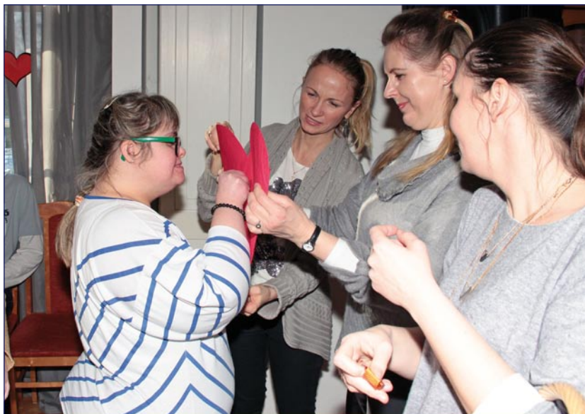
Walentynkowe zabawy i konkursy cieszyły wszystkich uczestników.