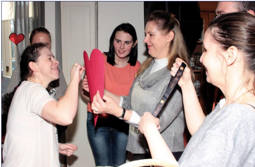
Organizatorzy przygotowali dla wszystkich walentynkowe konkursy

Niepełnosprawni uczestnicy warsztatów terapii zajęciowej z Malborka, Dzierzgonia, Koniecwałdu i Kwidzyna bawili się podczas walentynkowej imprezy. W zabawie udział wzięły także wychowanki Młodzieżowego Ośrodka Wychowawczego w Kwidzynie. Imprezę zorganizował kwidzyński WTZ z siedzibą w Górkach (gmina Kwidzyn). Wprawdzie taniec wypełnił większość czasu, ale nie zabrakło walentynkowych konkursów przygotowanych dla wszystkich uczestników zabawy.