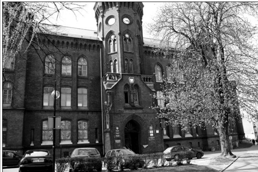
Szczegółowych informacji w sprawie dofinansowania kosztów nauki udzielają pracownicy Powiatowego Centrum Pomocy Rodzinie przy ul. Grudziądzkiej 30 w Kwidzynie. Tel. 55 279 9915 lub 55 646 18 00.

Do 30 marca niepełnosprawni studenci mogą składać wnioski o dofinansowanie kosztów nauki, dotyczące roku akademickiego 2016/2017. Wnioski dotyczące roku akademickiego 2017/2018 będzie można składać do 10 października bieżącego roku. Dofinansowanie udzielane jest w ramach pilotażowego programu „Aktywny samorząd” Państwowego Funduszu Rehabilitacji Osób Niepełnosprawnych. W programie kolejny rok uczestniczy samorząd powiatu. Przekazanie dofinansowania następuje w dwóch transzach.