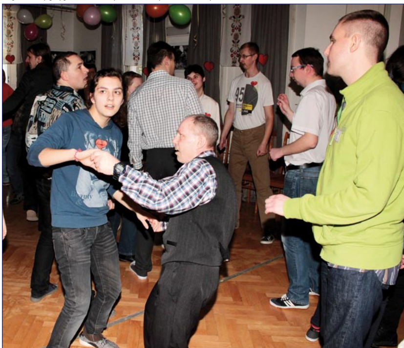
Uczestnicy warsztatów terapii zajęciowej z Malborka, Dzierzgonia, Koniecwałdu i Kwidzyna oraz wychowanki Młodzieżowego Ośrodka Wychowawczego w Kwidzynie bawili się podczas walentynkowej imprezy w siedzibie kwidzyńskiego WTZ w Górkach.