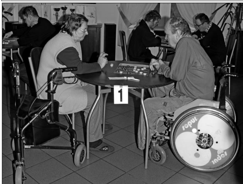
27 lutego zawodnicy z domów pomocy społecznej oraz warsztatów terapii zajęciowej w Kwidzynie i Ryjewie będą walczyli o Puchar Dyrektora Domu Pomocy Społecznej w Kwidzynie.

W Domu Pomocy Społecznej w Kwidzynie rozegrany zostanie turniej warcabowy dla osób niepełnosprawnych. 27 lutego zawodnicy z domów pomocy społecznej oraz warsztatów terapii zajęciowej w Kwidzynie i Ryjewie będą walczyli o puchar dyrektora placówki. Turniej organizowany jest już od ponad 10 lat.