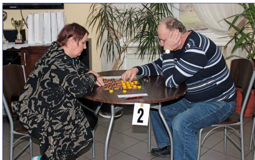
Najlepsi warcabiści z powiatu kwidzyńskiego wystartują już w przyszłym tygodniu w Pomorskim Turnieju Warcabowym Domów Pomocy Społecznej.