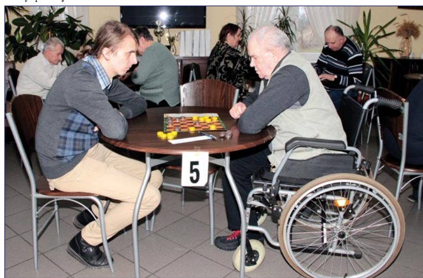
Jak zawsze w tego typu turniejach do ostatniej partii nie było wiadomo, kto wygra.