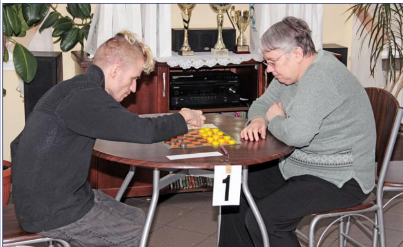
Zawody po raz piętnasty zorganizował Dom Pomocy Społecznej w Kwidzynie.