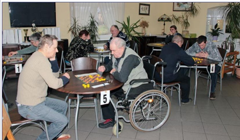
W Domu Pomocy Społecznej w Kwidzynie odbyły się zawody warcabowe. Wzięli w nich udział mieszkańcy domów pomocy społecznej oraz warsztatów terapii zajęciowej w Ryjewie i Kwidzynie.