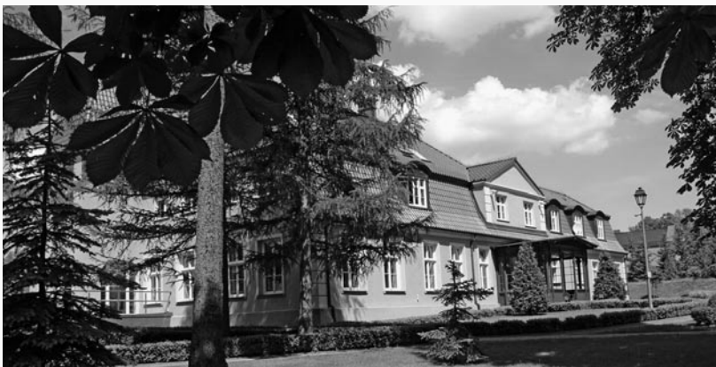
Obecnie w zajęciach terapeutycznych Warsztatu Terapii Zajęciowej w Górkach uczestniczy 47 niepełnosprawnych osób.

Warsztat Terapii Zajęciowej w Kwidzynie, z siedzibą w Górkach, to placówka, w której prowadzona jest rehabilitacja społeczna i zawodowa dla niepełnosprawnych mieszkańców powiatu kwidzyńskiego. To miejsce aktywnej rehabilitacji. Zajęcia prowadzone w WTZ mają w przyszłości ułatwić osobom niepełnosprawnym posiadającym znaczny lub umiarkowany stopień niepełnosprawności znalezienie zatrudnienia lub nauczyć samodzielności. Warsztat Terapii Zajęciowej funkcjonuje od poniedziałku do piątku, w godz. 7.00-15.00.