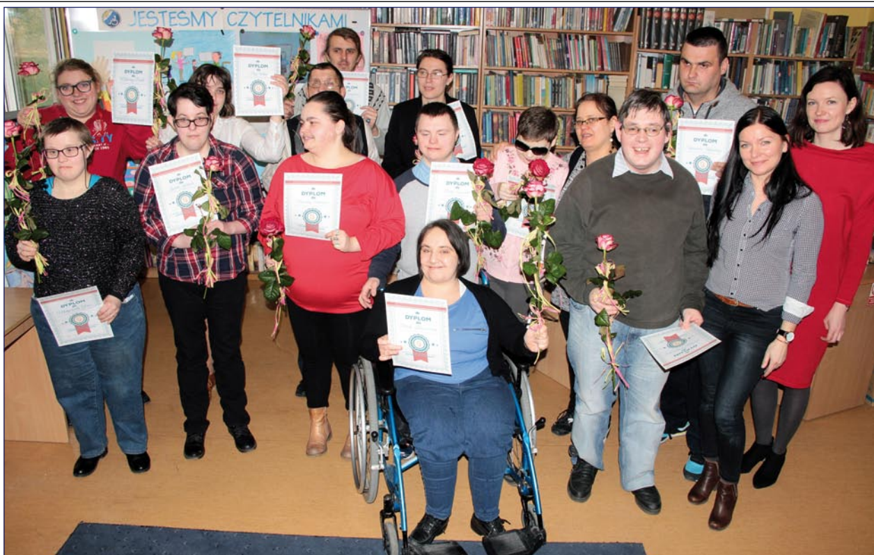
W filii dla niepełnosprawnych Biblioteki Miejsko-Powiatowej zorganizowana została wystawa prac osób niepełnosprawnych. Na zdjęciu: uczestnicy i organizatorzy wystawy.

- Posiadamy nie tylko tradycyjne książki, ale także takie, których można posłuchać na płytach CD, także w formacie mp3. Przeznaczone są między innymi dla osób niewidomych i słabo widzących. Z naszych zbiorów mogą również korzystać terapeuci, nauczyciele, studenci oraz opiekunowie osób