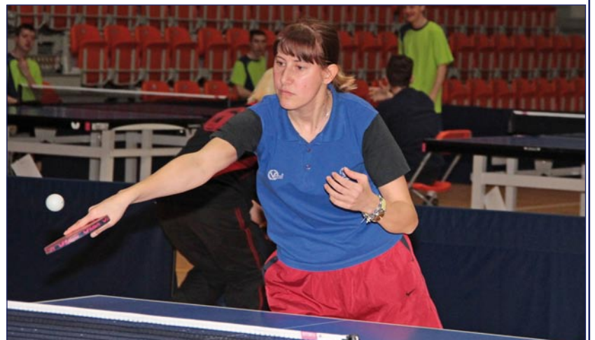
Utytulowana tenisistka z Kwidzyna, ze względu na wysoki poziom swoich umiejętności, tym razem musiała stawić czoła mężczyznom i poradziła sobie znakomicie, zajmując drugie miejsce w turnieju.

dzisiejskie Centrum Sportu i Rekreacji. (jk)