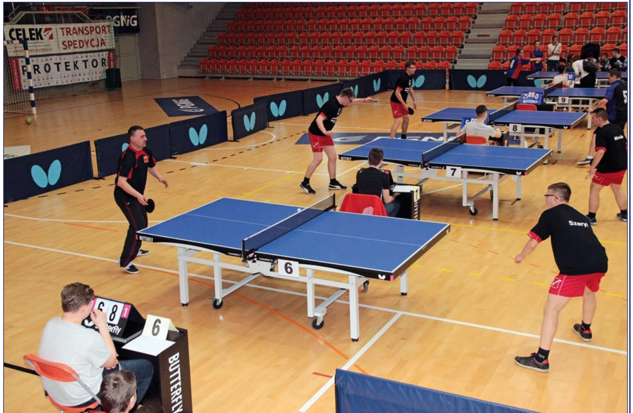
Najwięcej osób wzięło udział w turnieju tenisa stołowego. Tenisiści mieli do swojej dyspozycji profesjonalny, światowej marki sprzęt.

równoważni z którymi problem miałby także osoby w pełni sprawne. Najwięcej osób wzięło udział w turnieju tenisa stołowego. Tenisiści mieli do swojej dyspozycji profesjonalny, światowej marki sprzęt.