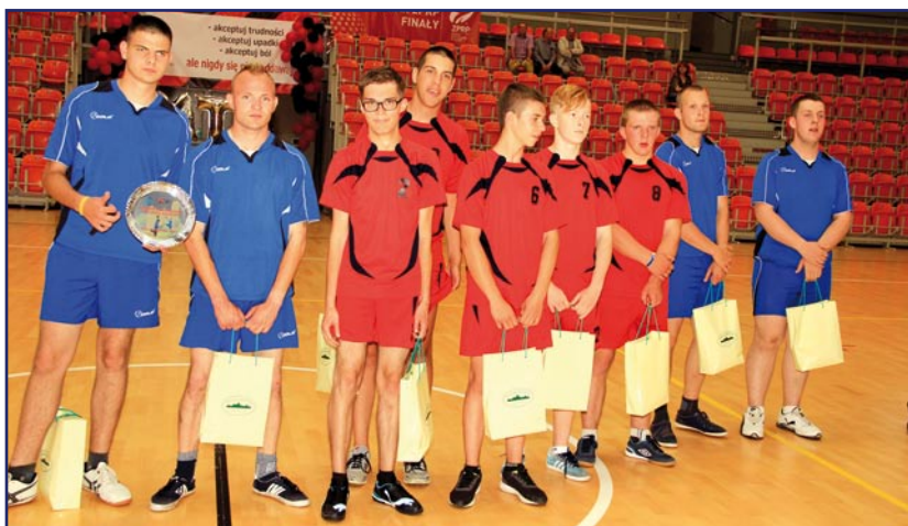
Kwidzyńska drużyna piłkarzy ręcznych Olimpiad Specjalnych.

pojawiła się w połowie lat 80. w Stanach Zjednoczonych. Niepełnosprawni zawodnicy pierwsze mecze rozgrywali z koszykarzami NBA. (jk)