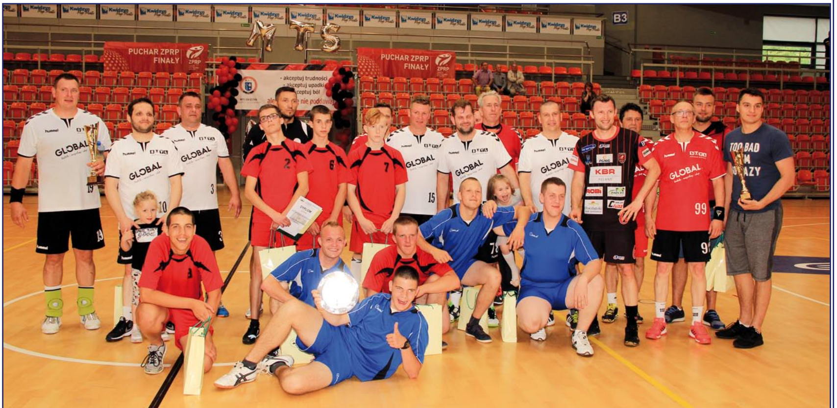
Kilka pokoleń piłkarzy ręcznych MMTS Kwidzyn z niepełnosprawnymi uczestnikami „Sztafety Pokoleń”.

Niepełnosprawni piłkarze ręczni trenujący w ramach Olimpiad Specjalnych zagraли podczas meczu integracyjnego, który odbył się podczas Dni Kwidzyna. Była to część turnieju rozgrywanego pod nazwą „Sztafeta Pokoleń”, w którym wzięli udział obecni i byli piłkarze ręczni MMTS Kwidzyn. Był to kolejny już mecz rozegrany w ramach programu Sportów Zunifikowanych. To program Olimpiad Specjalnych, który pozwala na wspólną rywalizację sportowców niepełnosprawnych intelektualnie oraz w pełni sprawnych.