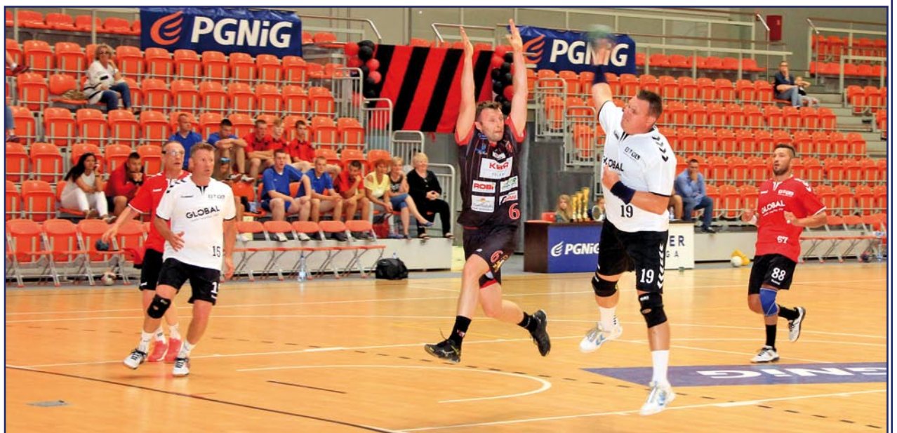
W „Sztafecie Pokoleń” wzięli udział obecni i byli piłkarze MMTS Kwidzyn. W tym meczu niepełnosprawni piłkarze byli kibicami.