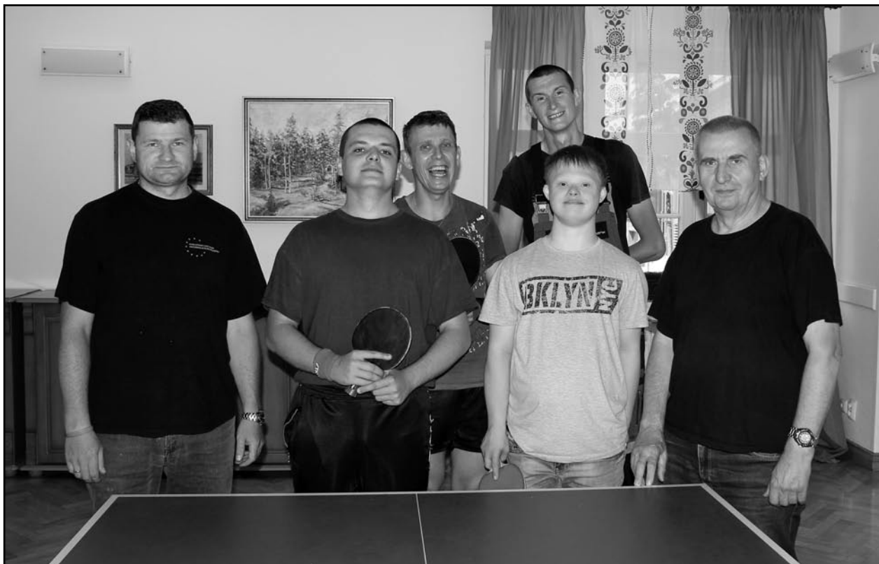
Dwie drużyny tenisistów z Warsztatu Terapii Zajęciowej w Kwidzynie, z siedzibą w Górkach, zwyciężyły w swoich grupach podczas czwartej kolejki Pomorskiej Ligi Tenisa Stołowego Osób Niepełnosprawnych, która odbyła się w hali Morskiego Robotniczego Klubu Sportowego w Gdańsku. Na zdjęciu: drużyny wraz z opiekunami.

Dwie drużyny tenisistów z Warsztatu Terapii Zajęciowej w Kwidzynie, z siedzibą w Górkach, zwyciężyły w swoich grupach podczas czwartej kolejki Pomorskiej Ligi Tenisa Stołowego Osób Niepełnosprawnych, która odbyła się w hali Morskiego Robotniczego Klubu Sportowego w Gdańsku. Tenisiści, w zależności od poziomu sprawności, startują w trzech grupach: A, B i C. Razem z niepełnosprawnymi tenisistami w ligowych rozgrywkach biorą udział także opiekunowie.