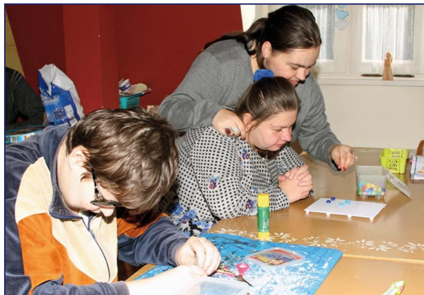
Pracownia terapii życia codziennego uczy stawiania pierwszych kroków na drodze do samodzielności.

w pracowniach terapii życia codziennego, edukacyjno-stolarskiej, ceramicznej, plastycznej, komputerowej, wikliniarskiej, redakcyjnej, artystycznej i ogrodniczo-gospodarczej. Wobec wszystkich uczestników zajęć terapeutycznych stosowane są dwie formy rehabilitacji medycznej: kinezyterapia (obejmuje między innymi ćwiczenia gimnastyczne i różne formy czynnego wypoczynku i relaksu) i fizykoterapia (elektroterapia, termoterapia, światłolecznictwo i ultradźwięki, magnetoterapia, laseroterapia). Obecnie w zajęciach terapeutycznych Warsztatu Terapii Zajęciowej w Górkach uczestniczy 47 niepełnosprawnych osób. Warsztat powstał w październiku 1993 roku przy Domu Pomocy Społecznej w Kwidzynie. Od pierwszego stycznia 2004 roku prowadzi go kwidzyńska Fundacja „Misericordia”, w zabytkowym dworcu w Górkach (gmina Kwidzyn).