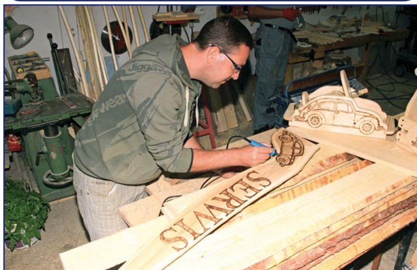
Zajęcia w pracowni edukacyjno-stolarskiej pozwalają przygotować niepełnosprawnych uczestników WTZ do pracy.

Warsztat Terapii Zajęciowej w Kwidzynie, z siedzibą w Górkach, to placówka, w której prowadzona jest rehabilitacja społeczna i zawodowa dla niepełnosprawnych mieszkańców powiatu kwidzyńskiego. To miejsce aktywnej rehabilitacji. Zajęcia prowadzone w WTZ mają w przyszłości ułatwić osobom niepełnosprawnym posiadającym znaczny lub umiarkowany stopień niepełnosprawności znalezienie zatrudnienia lub nauczyć samodzielności. Warsztat Terapii Zajęciowej funkcjonuje od poniedziałku do piątku, w godz. 7.00-15.00.