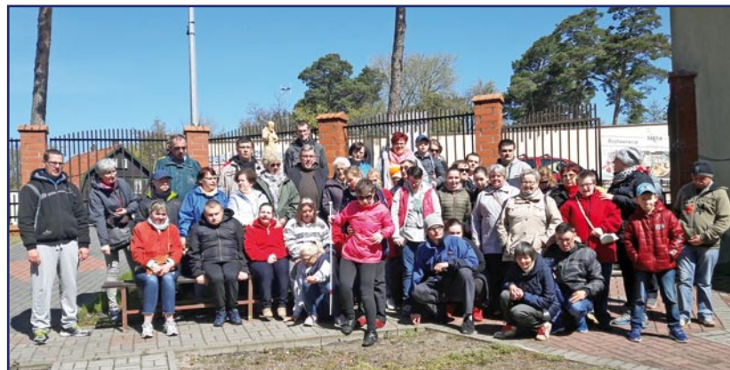
Uczestnicy Warsztatu Terapii Zajęciowej oraz mieszkańcy Domu Pomocy Społecznej w Kwidzynie od ponad 20 lat uczestniczą w rekolekcjach.

- W tym roku byłem ósmy raz. Wszystko mi się podoba. Znam już wszystkie miejsca. To odskocznia od tego co mam na co dzień. Dobrze się