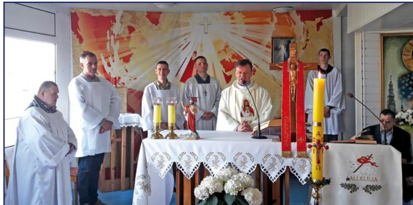
Niepełnosprawni uczestnicy Warsztatu Terapii Zajęciowej w Kwidzynie i mieszkańcy kwidzyńskiego Domu Pomocy Społecznej uczestniczyli w rekolekcjach, które organizuje Dom Zakonny Księża Werbistów.

Niepełnosprawni uczestnicy Warsztatu Terapii Zajęciowej w Kwidzynie i mieszkańcy kwidzyńskiego Domu Pomocy Społecznej uczestniczyli w rekolekcjach, które odbyły się w Krynicy Morskiej. Rekolekcyjne spotkania organizuje Dom Zakonny Księża Werbistów.