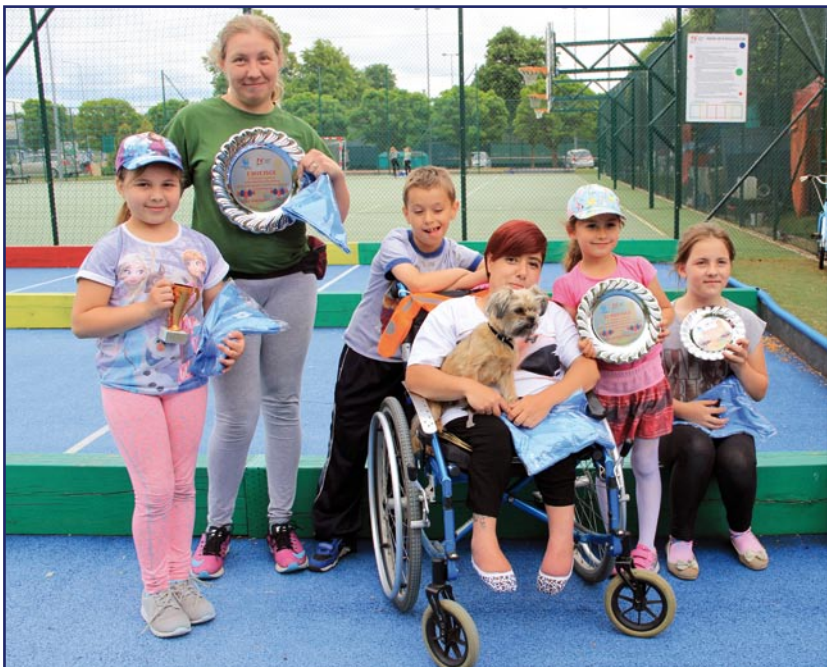
Zwycięzcy turnieju bocce dla niepełnosprawnych osób.

Po raz osiemnasty rozegrane zostały Mistrzostwa Bocce dla Niepełnosprawnych. Turniej tradycyjnie odbył się na stadionie miejskim podczas Dni Kwidzyna. Organizatorem turnieju jest Kwidzyńskie Centrum Sportu i Rekreacji. Tym razem w zawodach wzięła jednak udział mniejsza liczba zawodników niż w ubiegłym roku.