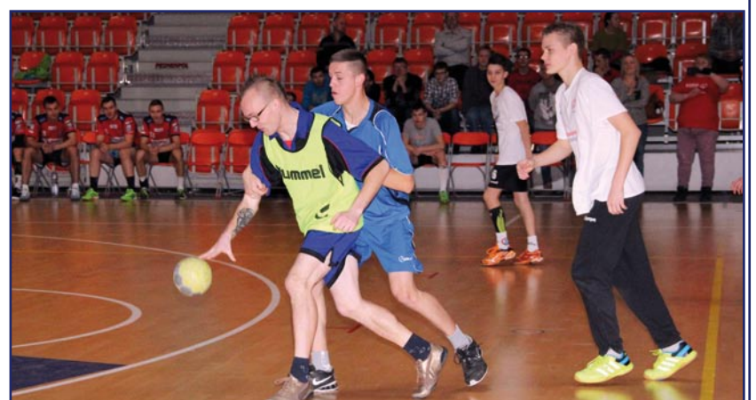
W ubiegłym roku odbył się w Kwidzynie pierwszy w Polsce turniej zunifikowanej piłki ręcznej.