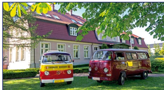
Przed zlotem miłośnicy volkswagenów odwiedzili siedzibę kwidzyńskiego warsztatu w Górkach (gmina Kwidzyn).