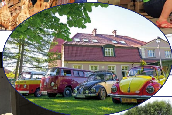
Uczestnicy zlotu, którzy wzięli udział w licytacji, okazali się hojni dla Warsztatu Terapii Zajęciowej.