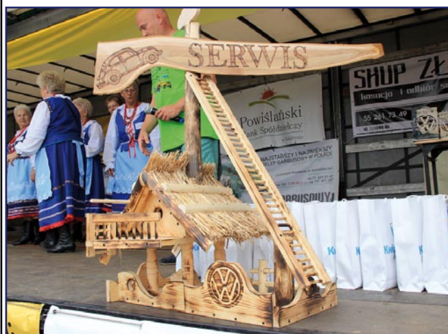
Przedmioty do aukcji wybrali organizatorzy zlotu.

wali. Nasi zlotowicze często zbierają wszystko co ma tylko znaczek VW. To praw-