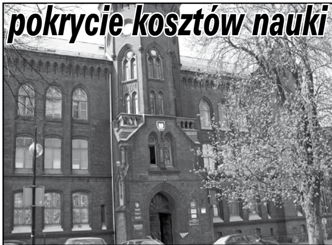
W Powiatowym Centrum Pomocy Rodzinie w Kwidzynie można uzyskać szczegółowe informacje na temat dofinansowania do kosztów nauki.

Dofinansowanie można uzyskać na kształcenie w szkole policealnej, kolegium, szkole wyższej, w tym studia pierwszego i drugiego stopnia, jednolite studia magisterskie, studia podyplomowe lub doktoranckie, prowadzone przez szkoły wyższe w systemie stacjonarnym dziennym lub niestacjonarnym wieczorowym, zaocznym lub eksternistycznym, w tym również za pośrednictwem internetu, a także przewodu doktorskiego, otwartego poza studiami doktoranckimi