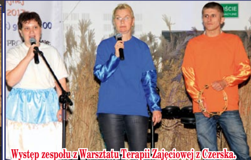
Występ zespołu z Warsztatu Terapii Zajęciowej z Czerska.