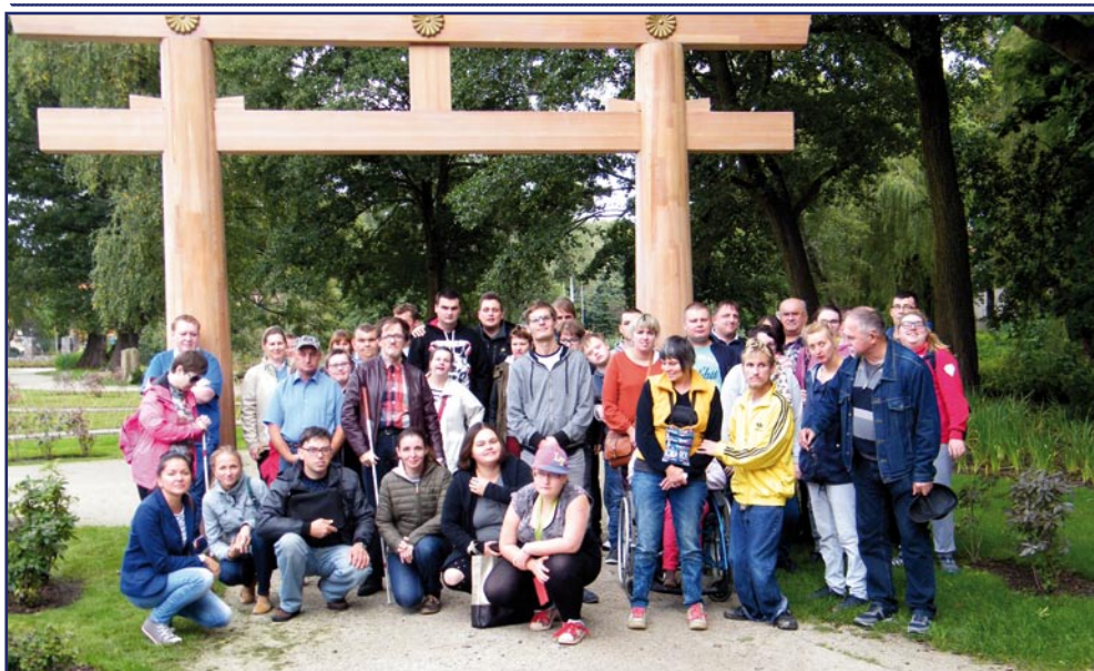
Uczestnicy WTZ w Kwidzynie, prowadzonego przez Fundację „Misericordia”, podczas wycieczki do Trójmiasta odwiedzili również Park Oliwski.