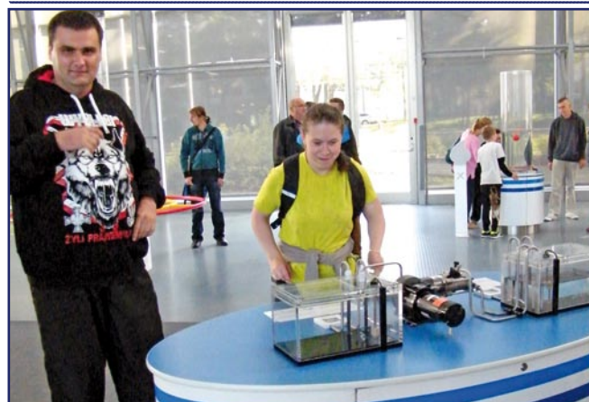
Niepełnosprawni uczestnicy WTZ w Kwidzynie znakomicie bawili się w Centrum Nauki Experyment w Gdyni.