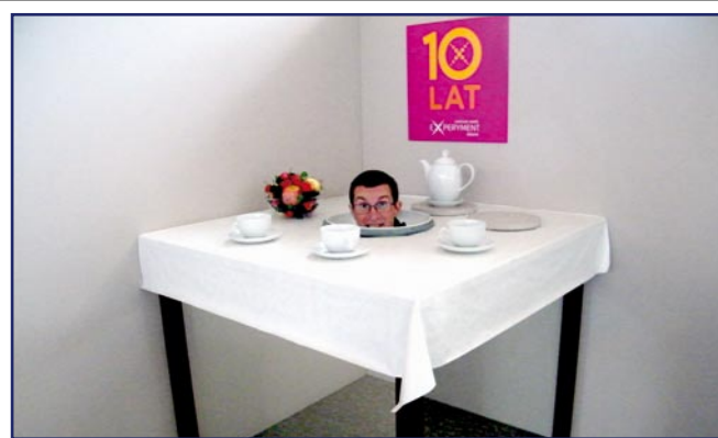
Centrum Nauki Experyment łączy naukę i zabawę.