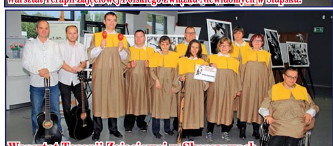
Warsztat Terapii Zajęciowej w Skarszewach.