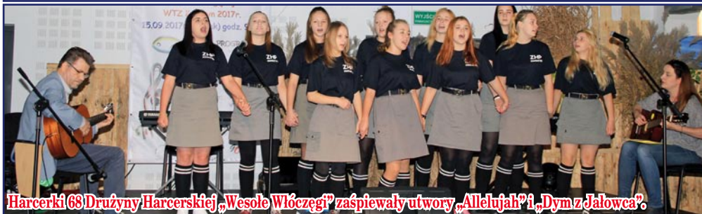
Harcerki 68 Drużyny Harcerskiej „Wesołe Włóczgi” zaśpiewały utwory „Alleluja” i „Dym z Jąłowca”.