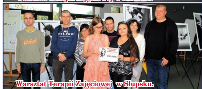
Warsztat Terapii Zajęciowej w Słupsku.