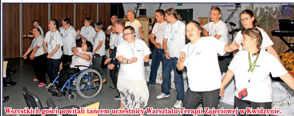
Wszystkich gości powitali tańcem uczestnicy Warsztatu Terapii Zajęciowej w Kwidzynie.

sieli wstać bardzo wcześnie, aby dojechać do Kwidzyna. Tak było w przypadku Warsztatu Terapii Zajęciowej Polskiego Związku Niewidomych w Słupsku. Członkowie zespołu, którzy zaśpiewali podczas naszej imprezy, aby zdążyć na czas musieli wstać o czwartej rano. Realizacja naszej integracyjnej imprezy nie byłaby możliwa, gdy-