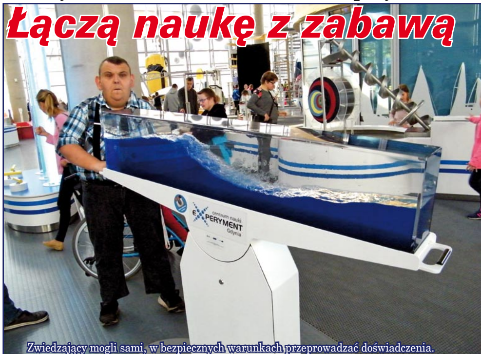
Zwiedzający mogli sami, w bezpiecznych warunkach, przeprowadzać doświadczenia.

Uczestnicy Warsztatu Terapii Zajęciowej w Kwidzynie, z siedzibą w Górkach, odwiedzili Centrum Nauki Experyment w Gdyni. To jedno z pierwszych tego typu miejsc w Polsce, w którym zabawa łączona jest z nauką. Podczas zwiedzania uczestnicy mogli doświadczać różnych zjawisk oraz przekonać się na własnej skórze, w jaki sposób przebiegają zjawiska fizyczne. W Centrum Nauki Experyment znajdują się stanowiska zaprojektowane w sposób interaktywny, aby zwiedzający mogli sami, w bezpiecznych warunkach przeprowadzać doświadczenia i badać zjawiska z różnych dziedzin nauki. Uczestnicy WTZ w Kwidzynie, prowadzonego przez Fundację „Misericordia”, podczas wycieczki do Trójmiasta odwiedzili również Park Oliwski. Wyjątkowo kapryśna pogoda okazał się dla niepełnosprawnych uczestników wycieczki wyjątkowo łaskawa.