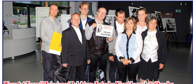
Warsztat Terapii Zajęciowej Polskiego Związku Niewidomych w Słupsku.