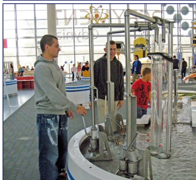
Podczas zwiedzania uczestnicy mogli doświadczać różnych zjawisk oraz przekonać się na własnej skórze, w jaki sposób przebiegają zjawiska fizyczne.