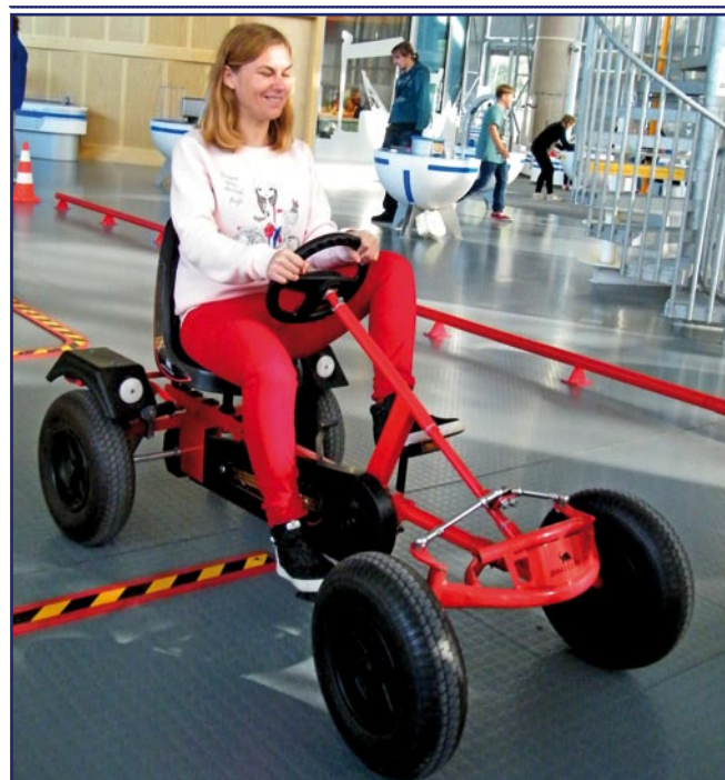
Centrum proponuje atrakcyjne formy poznawania zjawisk fizycznych.