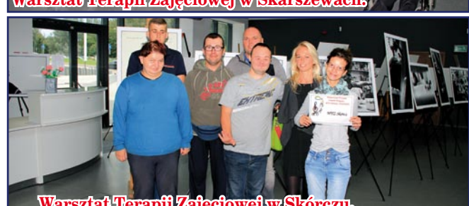
Warsztat Terapii Zajęciowej w Skórczu.