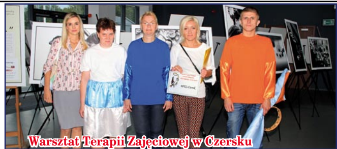
Warsztat Terapii Zajęciowej w Czersku