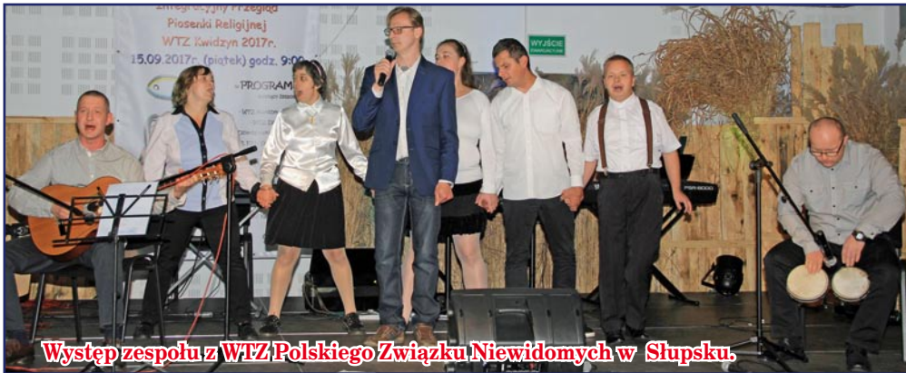
Występ zespołu z WTZ Polskiego Związku Niewidomych w Słupsku.