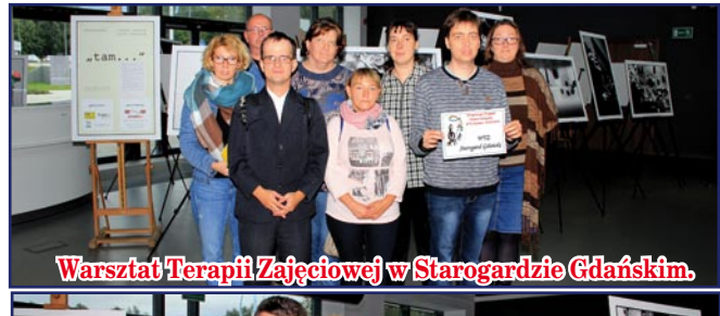
Warsztat Terapii Zajęciowej w Starogardzie Gdańskim.