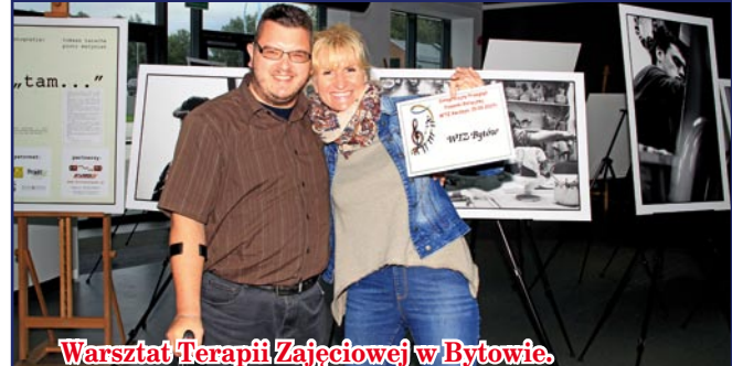
Warsztat Terapii Zajęciowej w Bytowie.