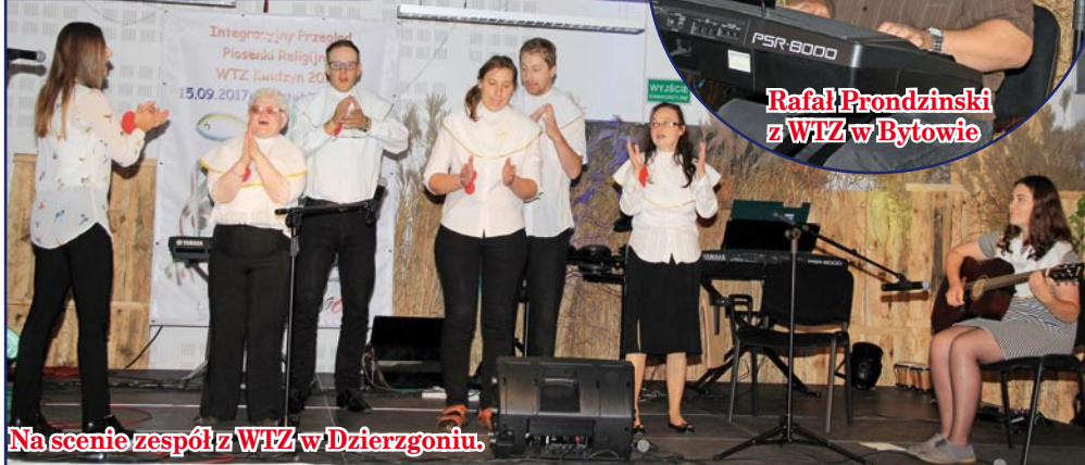
Na scenie zespół z WTZ w Dzierżgoniu.