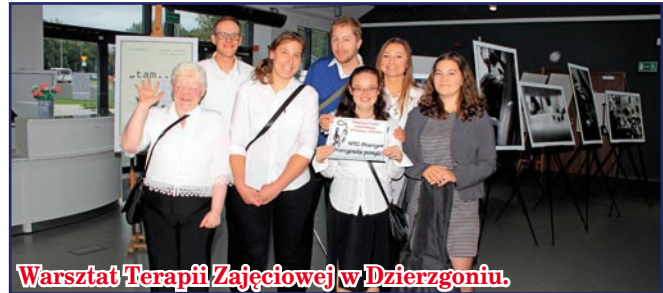
Warsztat Terapii Zajęciowej w Dzierżgoniu.