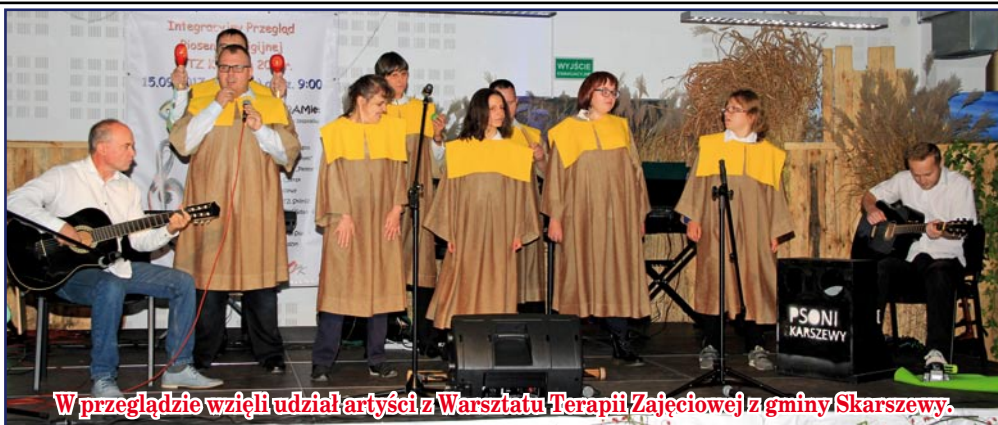
W przeglądzie wzięli udział artyści z Warsztatu Terapii Zajęciowej z gminy Skarszewy.