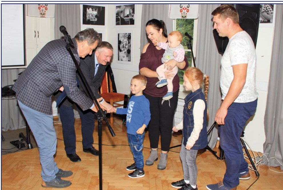
Podziękowania dla miłośników VW garbusów, którzy przybyli na spotkanie w WTZ z dziećmi.