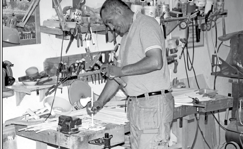
Pieniądze z PFRON przeznaczone są między innymi na rehabilitację społeczną i zawodową prowadzoną w ramach warsztatów terapii zajęciowej.

Samorząd powiatu musiał zwrócić ponad 7 tys. zł ze środków, które otrzymał z Państwowego Funduszu Rehabilitacji Osób Niepełnosprawnych na rehabilitację społeczną i zawodową niepełnosprawnych mieszkańców powiatu kwidzińskiego. Rada powiatu podjęła już uchwałę, w której ponownie podzielono pieniądze, uwzględniając zwróconą kwotę. Powodem zwrotu pieniędzy były błędne dane podane przez Główny Urząd Statystyczny na podstawie których PFRON wyliczył pieniądze przekazane samorządom.