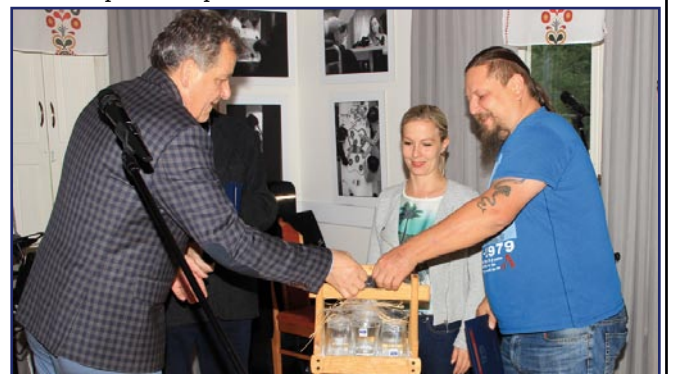
Nie zabrakło upominków wykonanych w Warsztacie Terapii Zajęciowej.