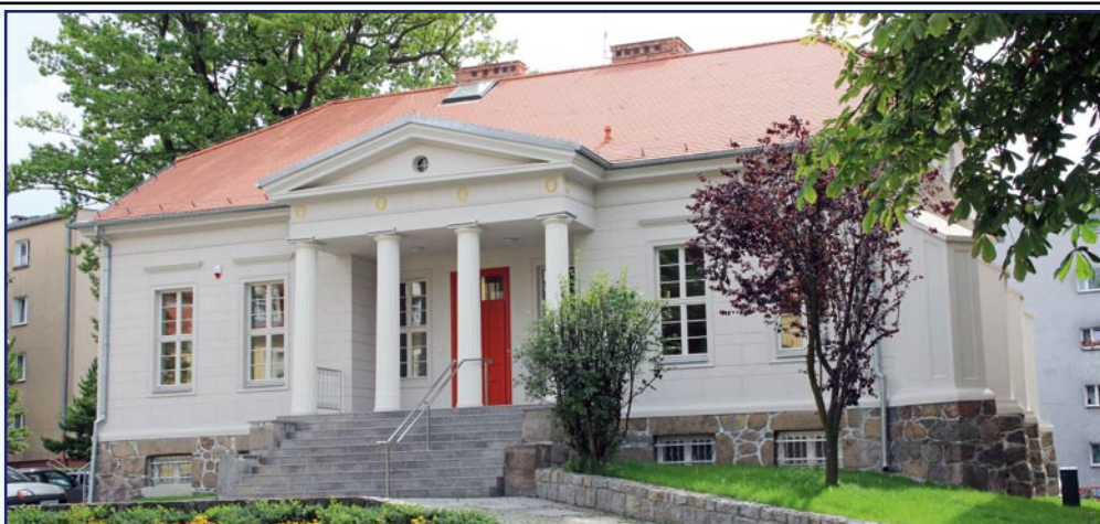
Dzienny Dom Pobytu „Senior +” mieści się w zabytkowym budynku przy ul. Warszawskiej w Kwidzynie.