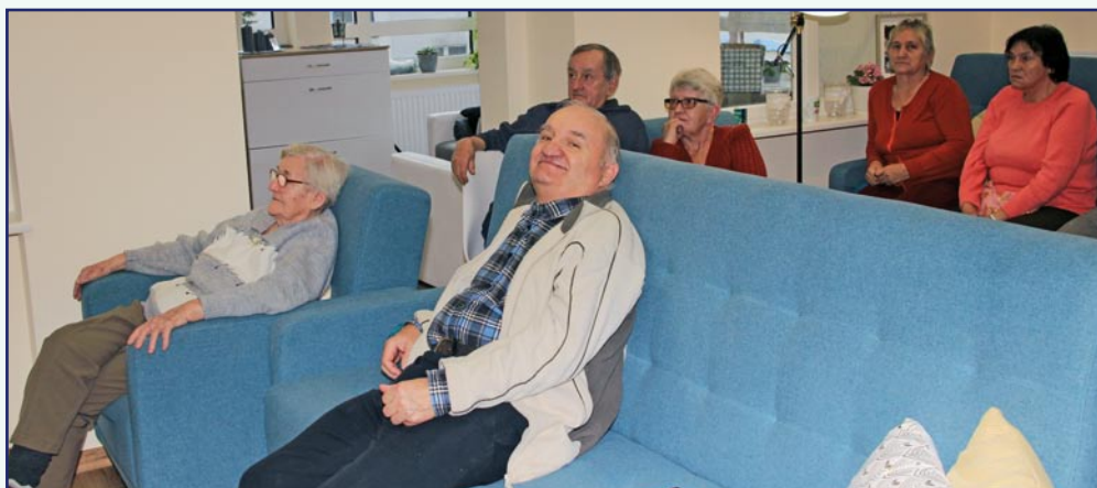
Dzienny Dom Pobytu „Senior +” rozpoczął działalność z początkiem września bieżącego roku. Zajęcia prowadzone są w dni robocze, w godz. 7.30-15.30.