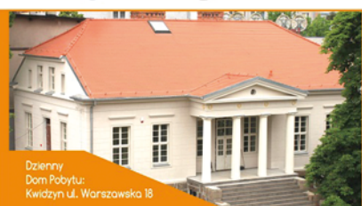
Dzienny Dom Pobytu: Kwidzyn ul. Warszawska 18