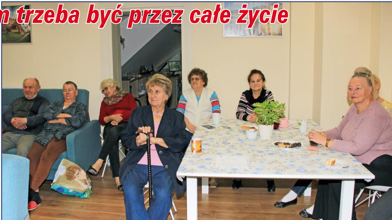
Aktywni seniorzy z Kwidzyna znaleźli swoje miejsce, w którym mogą poszerzać wiedzę oraz realizować swoje pasje.

W domu rozpoczęto realizację projektu „Bezpieczny senior”, przygotowanego przez Stowarzyszenie Rekreacyjno-Sportowe „Motywacja”. Celem projektu jest nauka bezpiecznych zachowań i właściwego postępowania w sytuacjach