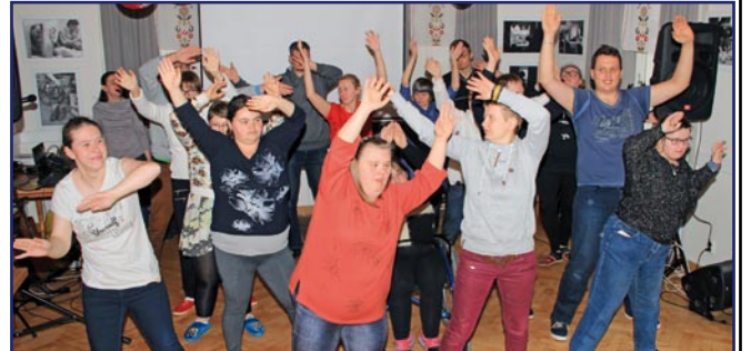
Uczestnicy WTZ podziękowali tańcem za zorganizowanie aukcji.