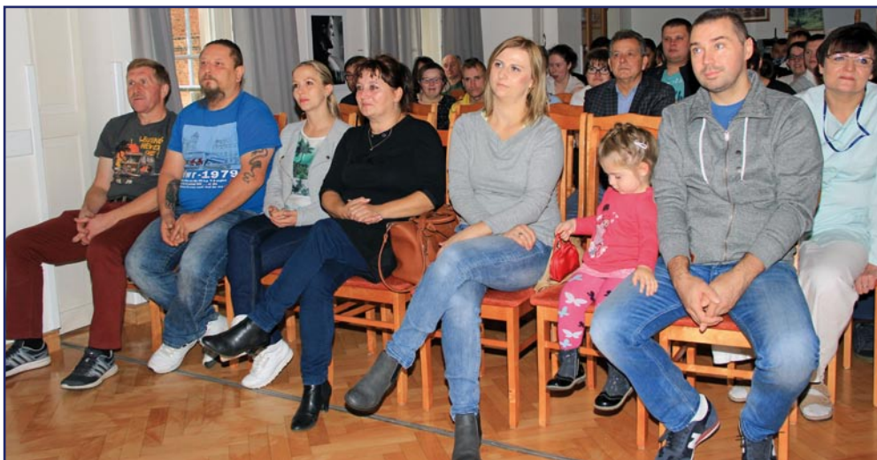
Na spotkanie w WTZ organizatorzy aukcji przybyli z całymi rodzinami.