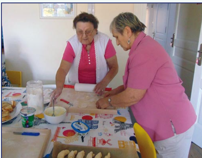
Pieczenie rogalików w Dziennym Domu Pobytu „Senior+”