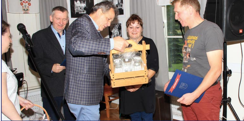
W Warsztacie Terapii Zajęciowej w Kwidzynie, z siedzibą w Górkach, podziękowano miłośnikom VW garbusa za zorganizowanie aukcji charytatywnej.

Uczestnicy Warsztatu Terapii Zajęciowej w Kwidzynie, z siedzibą w Górkach, podziękowali piosenkami i tańcem organizatorom „Złoty Śladami Pana Samochodzika VW Garbusa & Co”. Miłośnicy VW garbusa zorganizowali podczas wakacji aukcję charytatywną podczas której zebrano pieniądze na rehabilitację społeczną i zawodową.