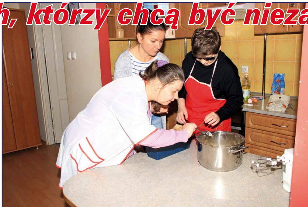
Zajęcia prowadzone w WTZ mają w przyszłości ułatwić osobom niepełnosprawnym posiadającym znaczny lub umiarkowany stopień niepełnosprawności znalezienie zatrudnienia lub nauczyć samodzielności. Na zdjęciu: zajęcia w pracowni terapii życia codziennego.

WTZ prowadzi Fundacja „Misericordia”. Do WTZ przyjmowane są tylko osoby, które chcą aktywnie uczestniczyć