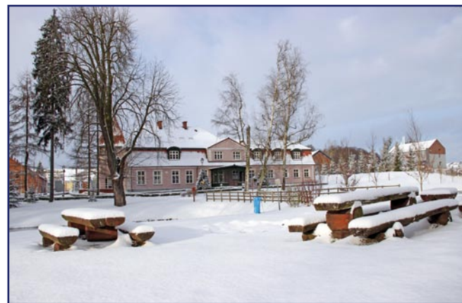
Od pierwszego stycznia 2004 roku WTZ prowadzi kwidzyńska Fundacja „Misericordia”, w zabytkowym dworcu w Górkach (gmina Kwidzyn).

ZADANIE WSPÓŁFINANSOWANE ZE ŚRODKÓW OTRZYMANÝCH W RAMACH PROGRAMU WIELOLETNIEGO „SENIOR +” NA LATA 2015-2020