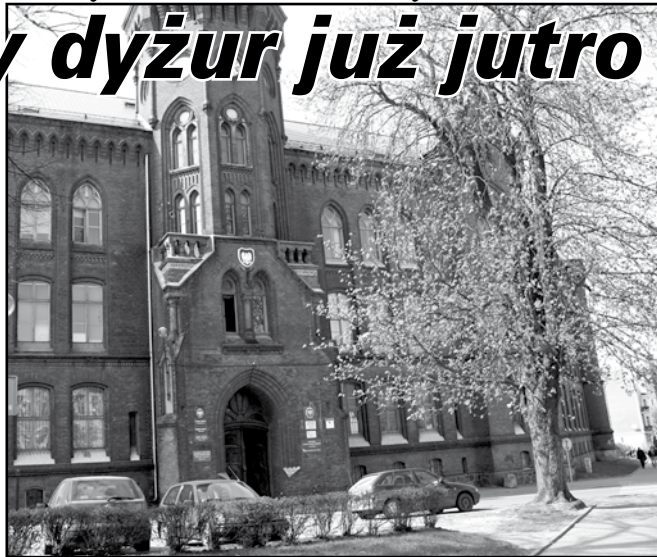
Już jutro w Powiatowym Centrum Pomocy Rodzinie przy ul. Grudziądzkiej w Kwidzynie odbędzie się pierwszy dyżur pracowników Powiatowego Zespołu do spraw Orzekania o Niepełnosprawności w Malborku. Dyżur odbędzie się w godz. 9.30-12.00 (pokój nr 20).

Już jutro w Powiatowym Centrum Pomocy Rodzinie przy ul. Grudziądzkiej w Kwidzynie odbędzie się pierwszy dyżur pracowników Powiatowego Zespołu do spraw Orzekania o Niepełnosprawności w Malborku. Dyżur odbędzie się w godz. 9.30-12.00 (pokój nr 20). Dyżury zespołu rozpoczęły się w październiku 2015 roku. Nadal jednak komisje orzekające będą zbierały się w siedzibie zespołu w Malborku.