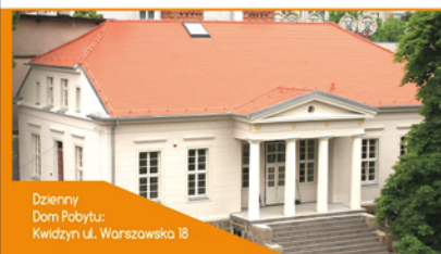
Dzienny Dom Pobytu: Kwidzyn ul. Warszawska 18