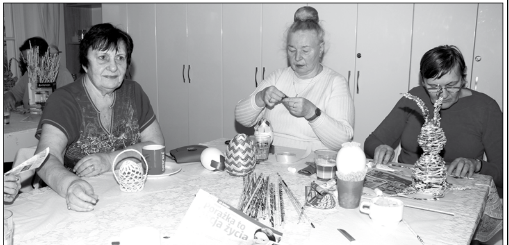
Panie w Dziennym Domu Pobytu Senior+ nie wiedzą co to nuda. Podczas zajęć przygotowują oryginalne wielkanocne ozdoby.

ZADANIE WSPÓRFINANSOWANE ZE ŚRODKÓW OTRZYMANÝCH W RAMACH PROGRAMU WIELOLETNIEGO „SENIOR+” NA LATA 2019-2020