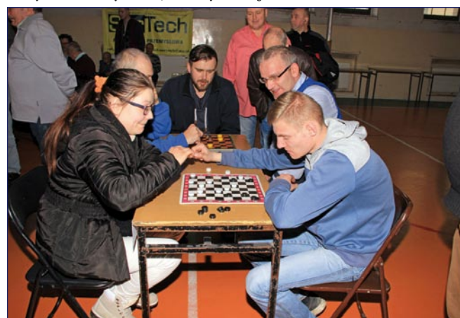
Podczas turnieju rozegrano ponad 200 partii.