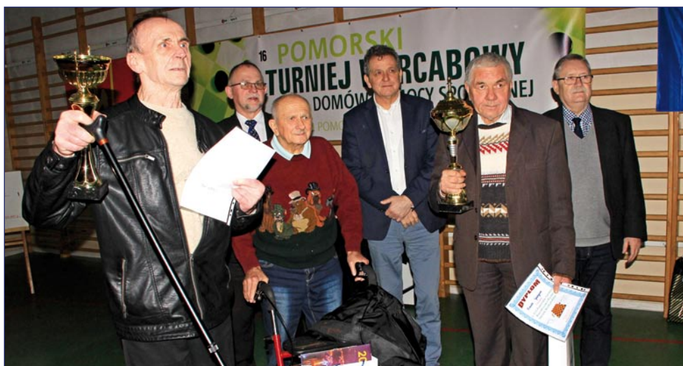
Puchar Burmistrza Kwidzyna za pierwsze miejsce drużynowo trafił w ręce warcabistów z Domu Pomocy Społecznej w Stegnie