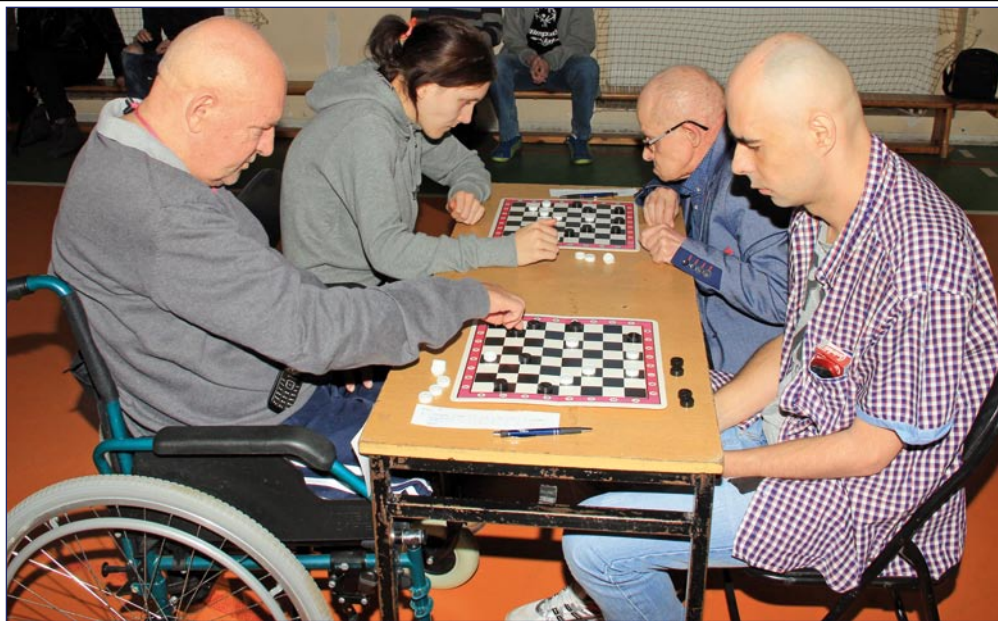
W Pomorskim Turnieju Warcabowym Domów Pomocy Społecznej wzięło udział ok. 70 zawodników z całego Pomorza.