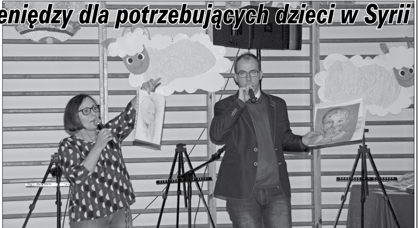
Wiosenny Kiermasz Świąteczny w Szkole Podstawowej w Tychnowach został połączony z finałem projektu edukacyjnego UNICEF pod nazwą „Pomóż dzieciom w Syrii przetrwać zimę”. W ramach projektu odbyła się aukcja, którą prowadzili koordynatorzy Szkolnego Klubu UNICEF. Przedmiotami licytacji były prace malarskie i fotograficzne oraz dary rzeczowe i usługi ofiarowane przez przyjaciół szkoły oraz rodziców.

Wszyscy, którzy przybyli na kiermasz mogli podziwiać przepiękne prace malarskie i plastyczne dzieci, które powstały podczas