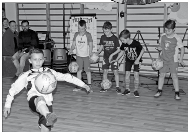
Uczniowie prezentowali swoje umiejętności.