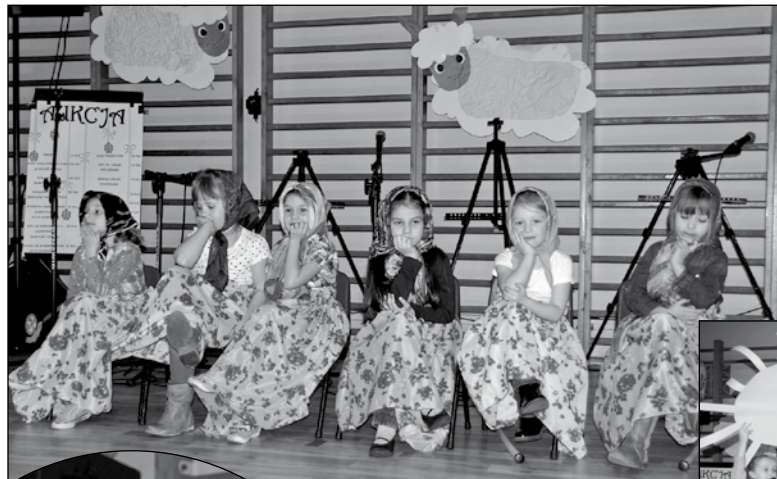
Podczas przerw w licytacji odbywały się występy dzieci z oddziałów przedszkolnych oraz uczniów starszych klas.

W Szkole Podstawowej w Tychnowach działa Szkolny Klub Wolontariatu. Placówka uczestniczyła w akcji Szlachetna Paczka i organizuje także doraźną pomoc dla