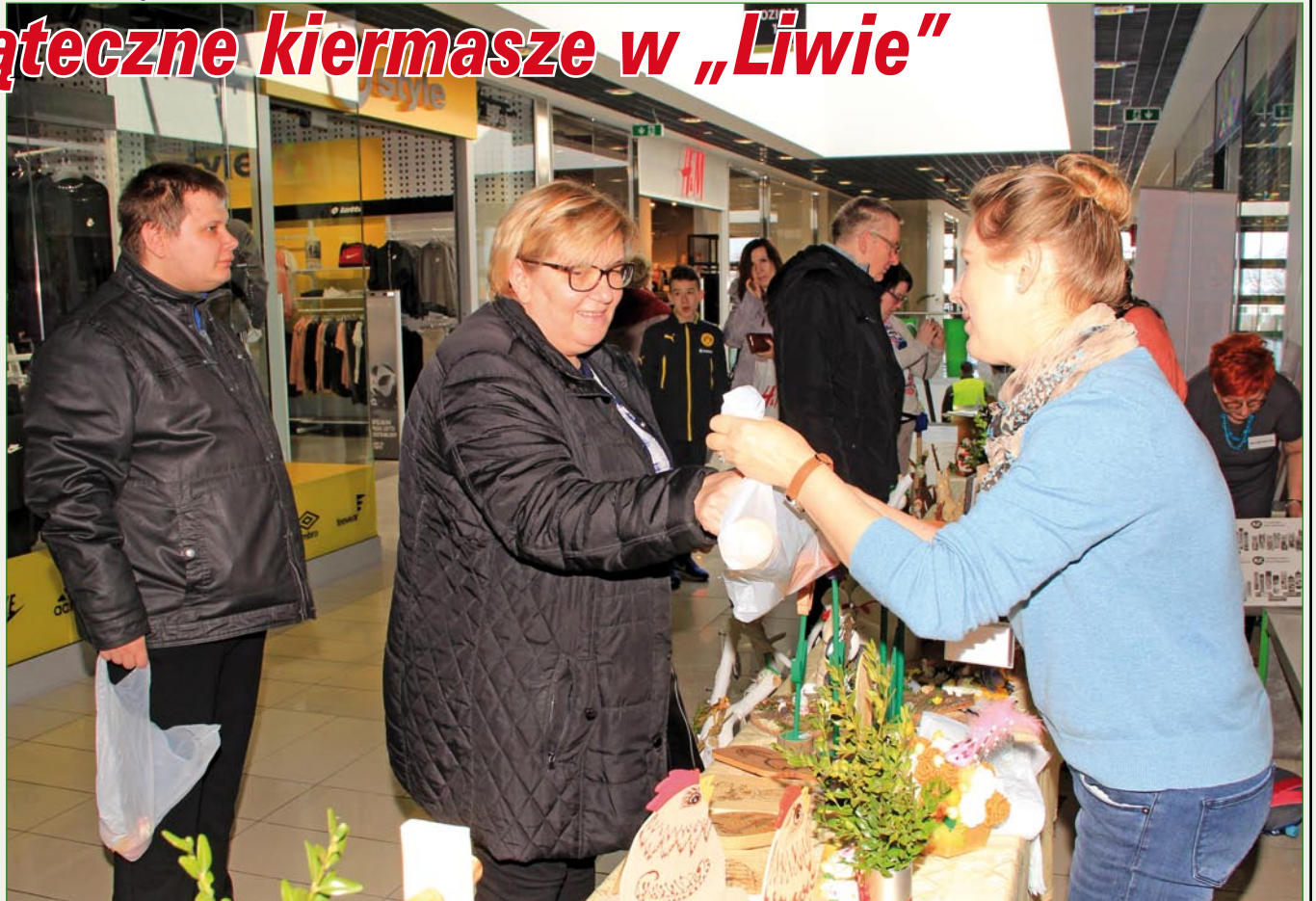
Zajęczki, baranki, koszyki i pisanki, to tylko niektóre z wyrobów, które pojawiły się na stoiskach podczas corocznych przedświątecznych kiermaszów wielkanocnych organizowanych przez Warsztat Terapii Zajęciowej w Kwidzynie. Mieszkańcy mogli zaopatrzyć się w wyjątkowe i niepowtarzalne ozdoby, które upiększą podczas świąt każdy dom.

- W tym roku kiermasz odbył się dwa razy w Centrum Handlowym „Liwa”, z którym współpracujemy już kolejny rok. Bardzo dziękujemy za wsparcie kierownictwu Centrum. Kiermasze organizujemy już od kilkunastu lat. Dochód ze sprzedaży wyrobów w całości przeznaczamy na rehabilitację społeczną i zawodową niepełnosprawnych uczestników naszego warsztatu. Kiermasz to nie możliwość kupienia przez odwiedzających na-