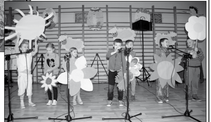
Kiermasz był okazją do zaprezentowania talentów uczniów.

również kawiarenki z najlepszymi na świecie, jak podkreślają organizatorzy, domowymi ciastami i stoiska z ozdobami świątecznymi, przygotowanymi własnoręcznie przez uczniów i pracowników szkoły.