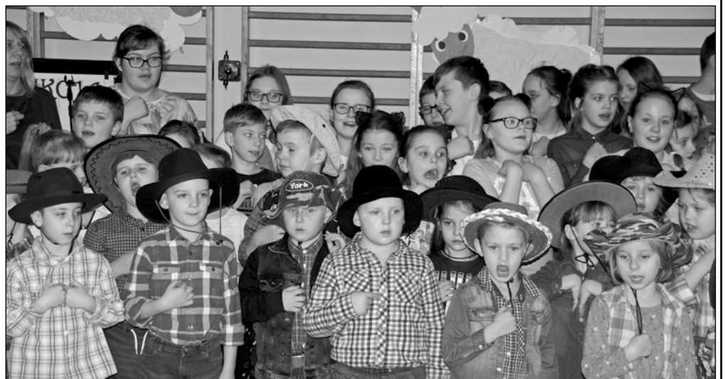
To już trzecia akcja szkoły organizowana w ramach współpracy z UNICEF, w której aktywnie uczestniczyły dzieci ze szkoły Podstawowej w Tychnowach.