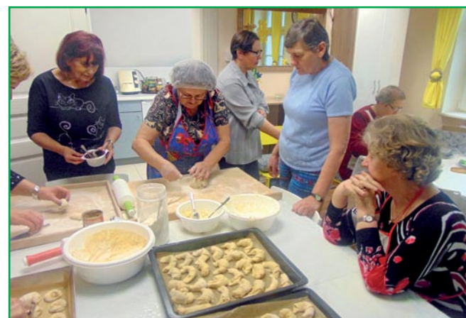
Zajęcia kulinarne, to stały element zajęć w domu.

to jest już lista oczekujących, co świadczy o tym, że utworzenie domu było strzałem w dziesiątkę i z całą pewnością bardzo mocno rozważymy utworzenie