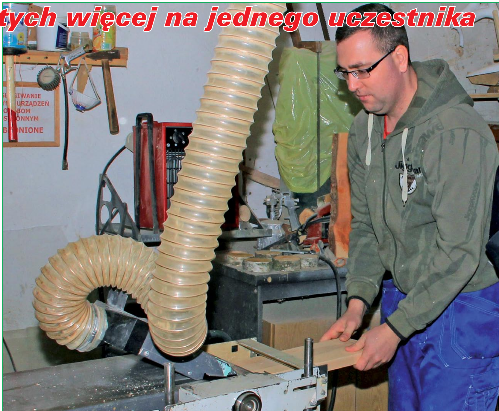
Wzrosła kwota związana z uczestnictwem osób niepełnosprawnych w warsztatach terapii zajęciowej. Rada powiatu przyjęła uchwałę, w której zwiększono środki na funkcjonowanie W TZ w Ryjewie i Kwidzynie. Na zdjęciu: zajęcia w pracowni edukacyjno-stolarskiej, prowadzone w Warsztacie Terapii Zajęciowej w Kwidzynie, z siedzibą w Gorkach.