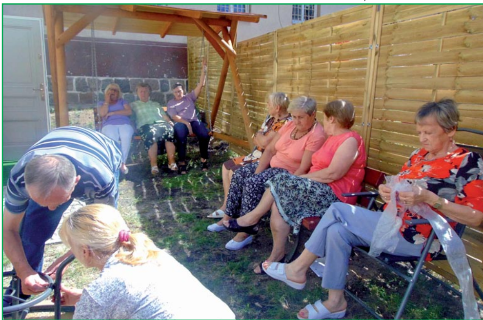
Dzięki władzom miasta seniorzy mają swój własny ogródek o powierzchni 72 m kw.

z oferty placówki. Razem z Radą seniorów zostaliśmy zaproszeni na wspólne ognisko. Było to doskonała okazja, aby porozmawiać na temat domu.