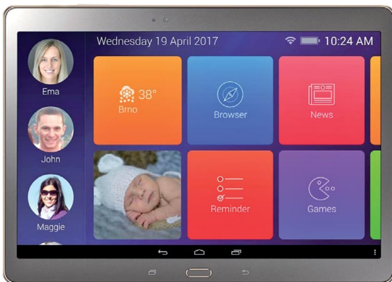
Aplikacja dla seniorów.

Państwowy Fundusz Rehabilitacji Osób Niepełnosprawnych uruchomił bezpłatną usługę SMSinfo. Na swój numer telefonu komórkowego na adres smsinfo@pfron.org.pl (numer należy wpisać w temacie wiadomości. Zgłoszone numery będą selektywnie autoryzowane telefonicznie przez pracowników PFRON, a następnie, bez danych osobowych wprowadzane do bazy użytkowników usługi. W każdym momencie można zrezygnować z usługi, ponownie przesyłając zgłoszenie na adres smsinfo@pfron.org.pl (w temacie wpisując numer telefonu i słowo rezygnacja).