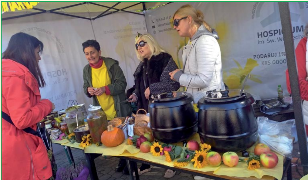
Kwidzyńskie Towarzystwo Przyjaciół Chorych wystawiło swoje stoisko podczas imprezy „Smak jesieni”.