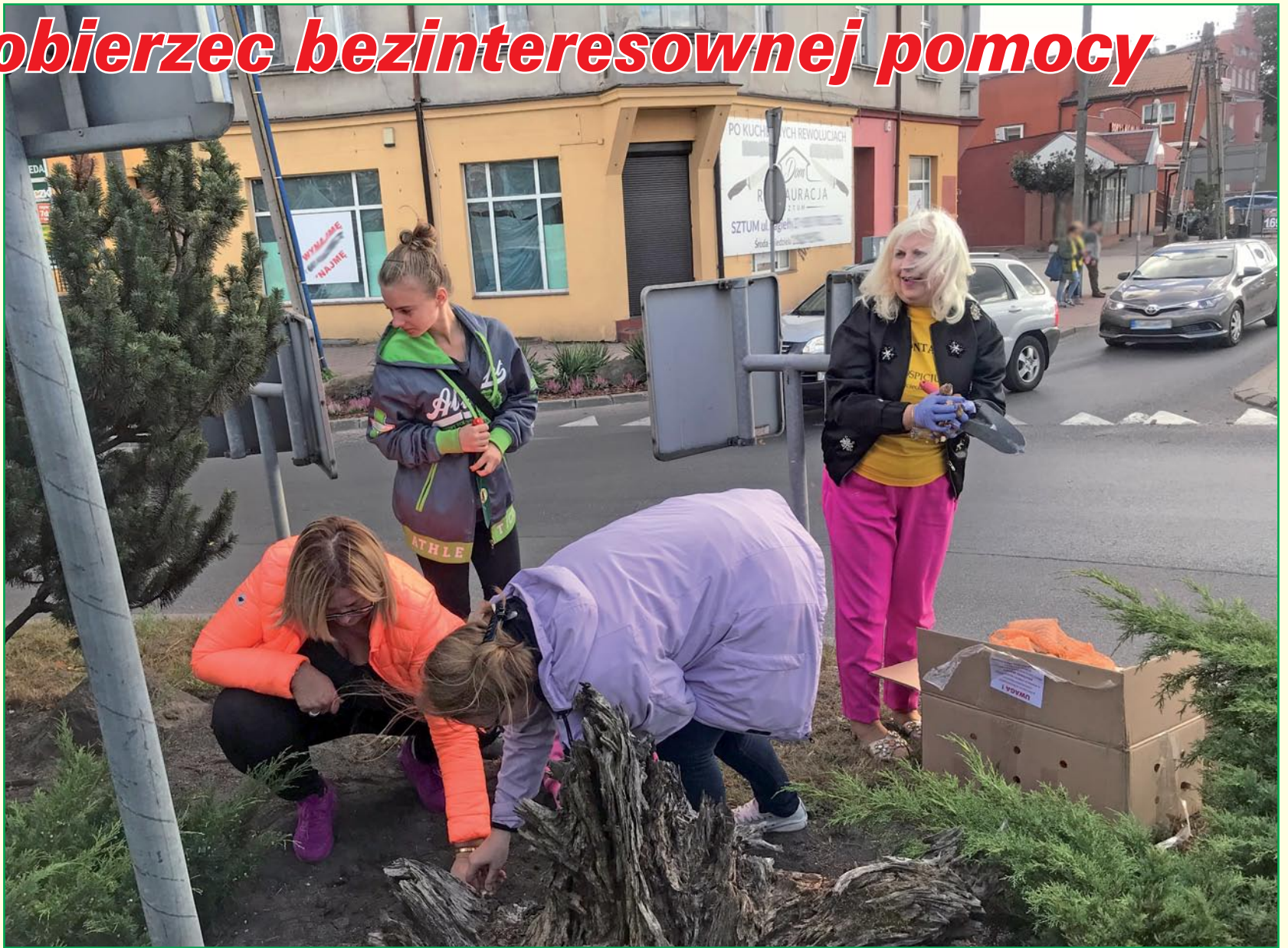
W Kwidzynie odbyła się druga edycja programu „Pola nadziei”. Jego celem jest promowanie idei wolontariatu i niesienia bezinteresownej pomocy podopiecznym Hospicjum Świętego Wojciecha. Jesienią sadzone są żonkile, natomiast wiosną kwiaty będą rozdawane, w zamian za wsparcie na rzecz hospicjum.