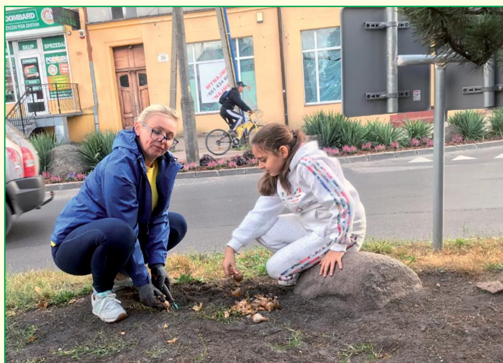
Żonkile posadzone w różnych punktach miasta. „Pola nadziei” to kacja organizowana przez Kwidzyńskie Towarzystwo Przyjaciół Chorych.

Kwidzyńskie Towarzystwo Przyjaciół Chorych wystawiło swoje stoisko