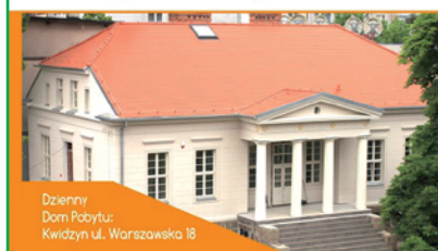
Dzienny Dom Pobytu: Kwidzyn ul. Warszawska 18