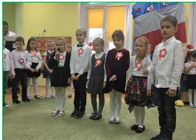
Podczas występu dzieci deklamowały wiersze patriotyczne opowiadające o historii Polski

Przedszkole z Oddziałami Integracyjnymi w Kwidzynie