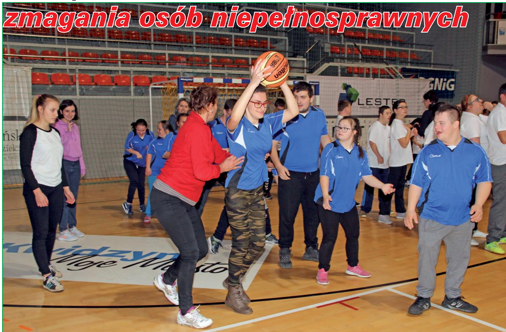
Niepełnosprawne osoby z ośrodków z całego powiatu wzięły udział w Powiatowej Olimpiadzie Kół i Środowisk Osób Niepełnosprawnych. Impreza odbyła się w hali widowiskowo-sportowej przy ul. Wiejskiej w Kwidzynie.