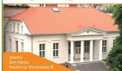
Dzienny Dom Pobytu: Kwidzyn ul. Warszawska 18