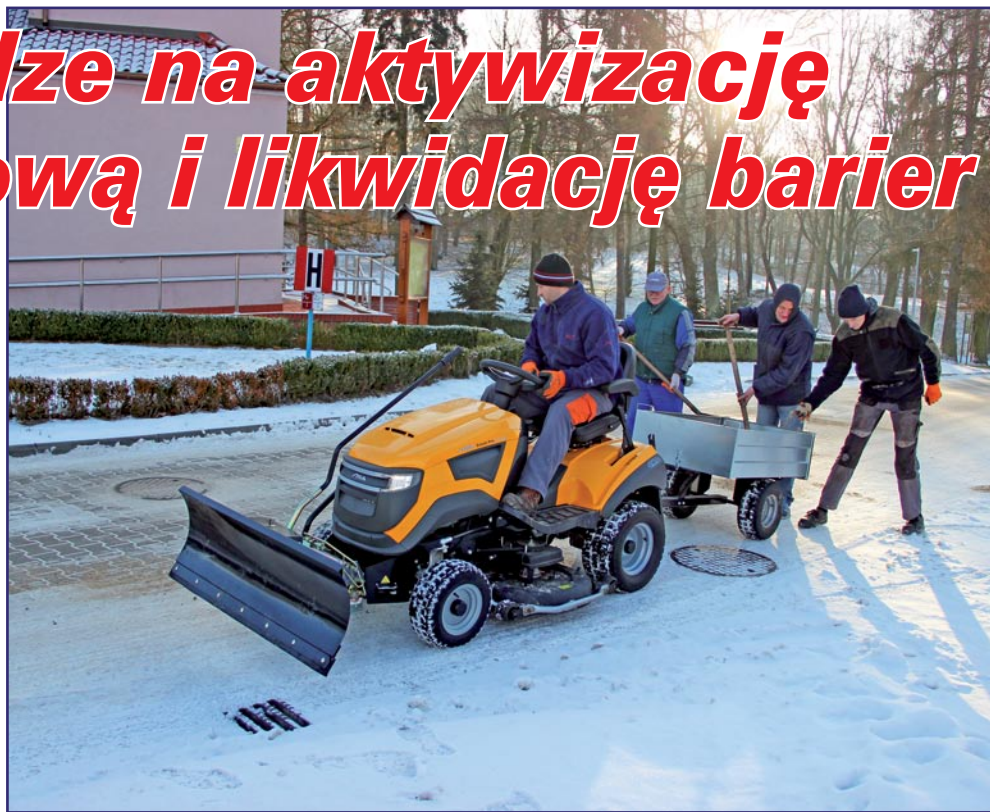
Do pracy na otwartym rynku przygotowuje osoby niepełnosprawne Warsztat Terapii Zajęciowej w Kwidzynie, z siedzibą w Górkach. Na zdjęciu: zajęcia w pracowni ogrodniczo-gospodarczej.

O pieniądze ubiegać się mogą instytucje oraz samorządy. Ustalone zostały przez PFRON kierunki działań oraz warunki brzegowe obowiązujące w tym roku. Dofinansowanie będzie można uzyskać między innymi na likwidację barier w urzędach, placówkach edukacyjnych lub środowiskowych domach