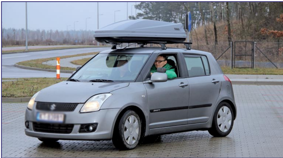
Osoby niepełnosprawne z dysfunkcją słuchu otrzymają pomoc w uzyskaniu prawa jazdy oraz zakupie i montażu oprzyrządowania do posiadanego samochodu. To jedna z nowych form pomocy wprowadzonych w pilotażowym programie „Aktywny samorząd” Państwowego Funduszu Rehabilitacji Osób Niepełnosprawnych.

Osoby niepełnosprawne z dysfunkcją słuchu otrzymają pomoc w uzyskaniu prawa jazdy oraz zakupie i montażu oprzyrządowania do posiadanego samochodu. To jedna z nowych form pomocy wprowadzonych w pilotażowym programie „Aktywny samorząd” Państwowego Funduszu Rehabilitacji Osób Niepełnosprawnych. W programie kolejny rok uczestniczy samorząd powiatu kwidzyńskiego.