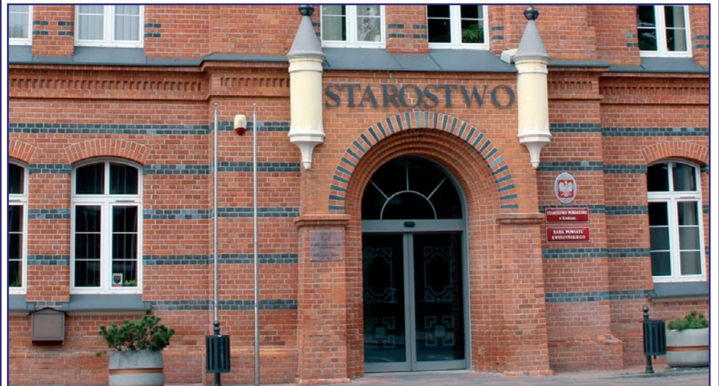
Mieszkańcy powiatu kwidzyńskiego mogą już korzystać z bezpłatnej pomocy prawnej. Nieodpłatne poradnictwo obywatelskie prowadzone jest w budynku Starostwa Powiatowego w Kwidzynie oraz w siedzibie Miejsko-Gminnego Ośrodka Pomocy Społecznej w Prabutach.

Mieszkańcy powiatu kwidzyńskiego mogą już korzystać z bezpłatnej pomocy prawnej. Nieodpłatne poradnictwo obywatelskie prowadzone jest w budynku Starostwa Powiatowego w Kwidzynie oraz w siedzibie Miejsko-Gminnego Ośrodka Pomocy Społecznej w Prabutach. Dotychczas z pomocy mogły korzystać wybrane grupy osób, w tym młodzież do 26 roku życia oraz osoby, które ukończyły 65 lat. Od 1 stycznia z pomocy prawnej może skorzystać każdy, ale pod warunkiem, że złoży oświadczenie, że nie jest w stanie zapłacić za tego typu usługę.