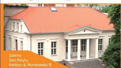
Dzienny Dom Pobytu: Kwidzyn ul. Warszawska 18