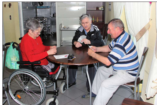
Mieszkańcy kwidzyńskiego DPS regularnie uczestniczą w turniejach karcianych 1000.