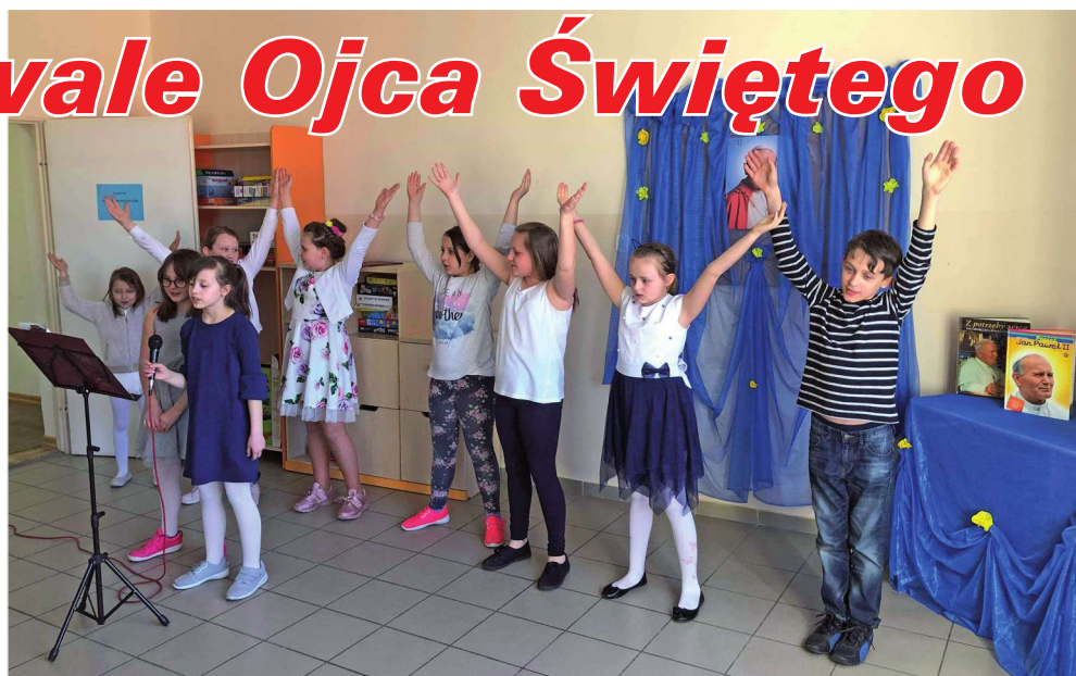
W placówce wsparcia dziennego przy ul. Hallera w Kwidzynie został zorganizowany koncert poświęcony pamięci św. Jana Pawła II.

Placówki wsparcia dzien- nego funkcjonują w ramach