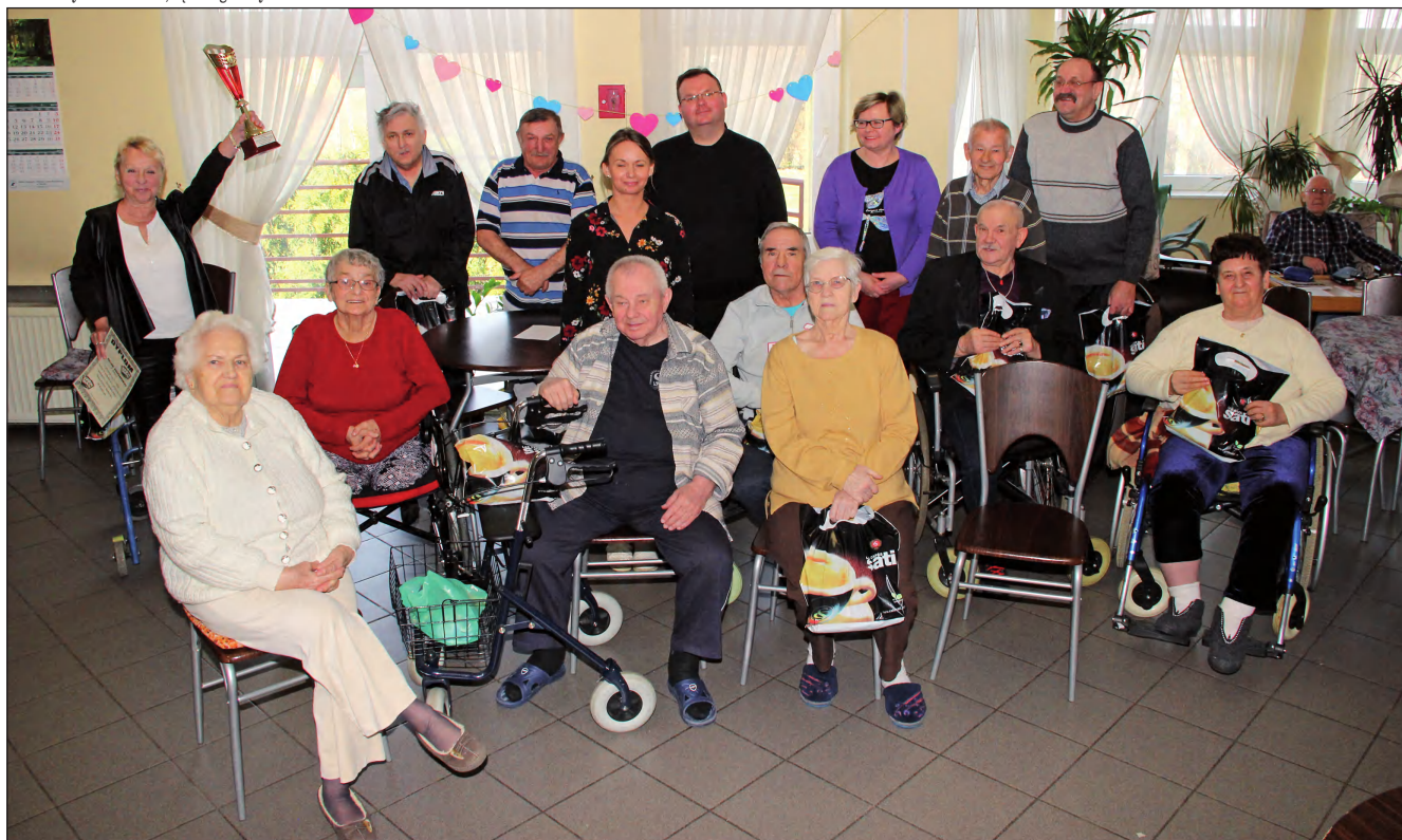
Uczestnicy i organizatorzy turnieju o Puchar Kierownika Działu Opiekuńczo-Terapeutycznego DPS