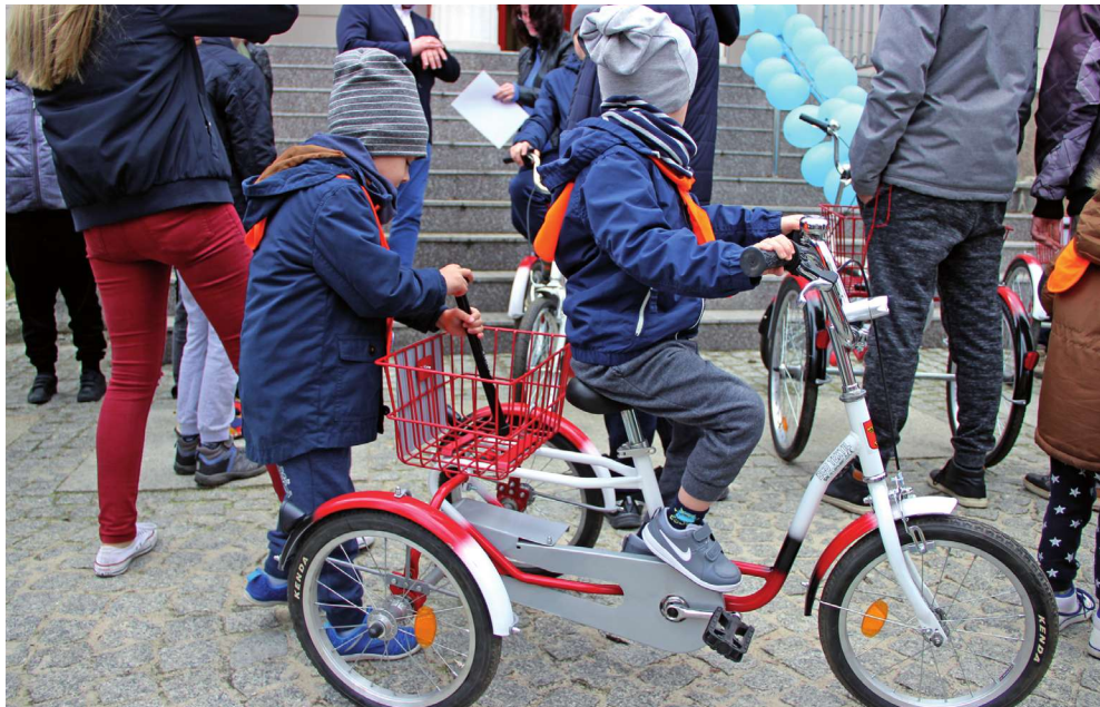
Sześć trójkołowych rowerów rehabilitacyjnych trafiło do osób niepełnosprawnych w Kwidzynie. Wszystkie pochodzą z wypożyczalni, którą otworzyło w Kwidzynie Stowarzyszenie Na Rzecz Osób z Autyzmem „SNOA” we współpracy z Fundacją EcoTextil. Partnerem przedsięwzięcia jest Polski Czerwony Krzyż.

- Otwieramy w Kwidzynie wypożyczalnię rowerów, które zostały ufundowane z recyklingu odzieży pozyskanej na terenie miasta Kwidzyna. Program wdrażamy od roku. Mamy umowę z Urzędem Miejskim w Kwidzynie na zbiórkę odzieży. Chcemy pokazywać, że środki pozyskane ze zbiórki odzieży trafiają do mieszkańców. Dzięki realizacji projektu otwieramy kolejną już wypożyczalnię w województwie pomorskim. Rowery, które będą wypożyczane są warte ok. 13 tys. zł. Przekazujemy nieodpłatnie sześć rowerów dla różnych grup wiekowych.