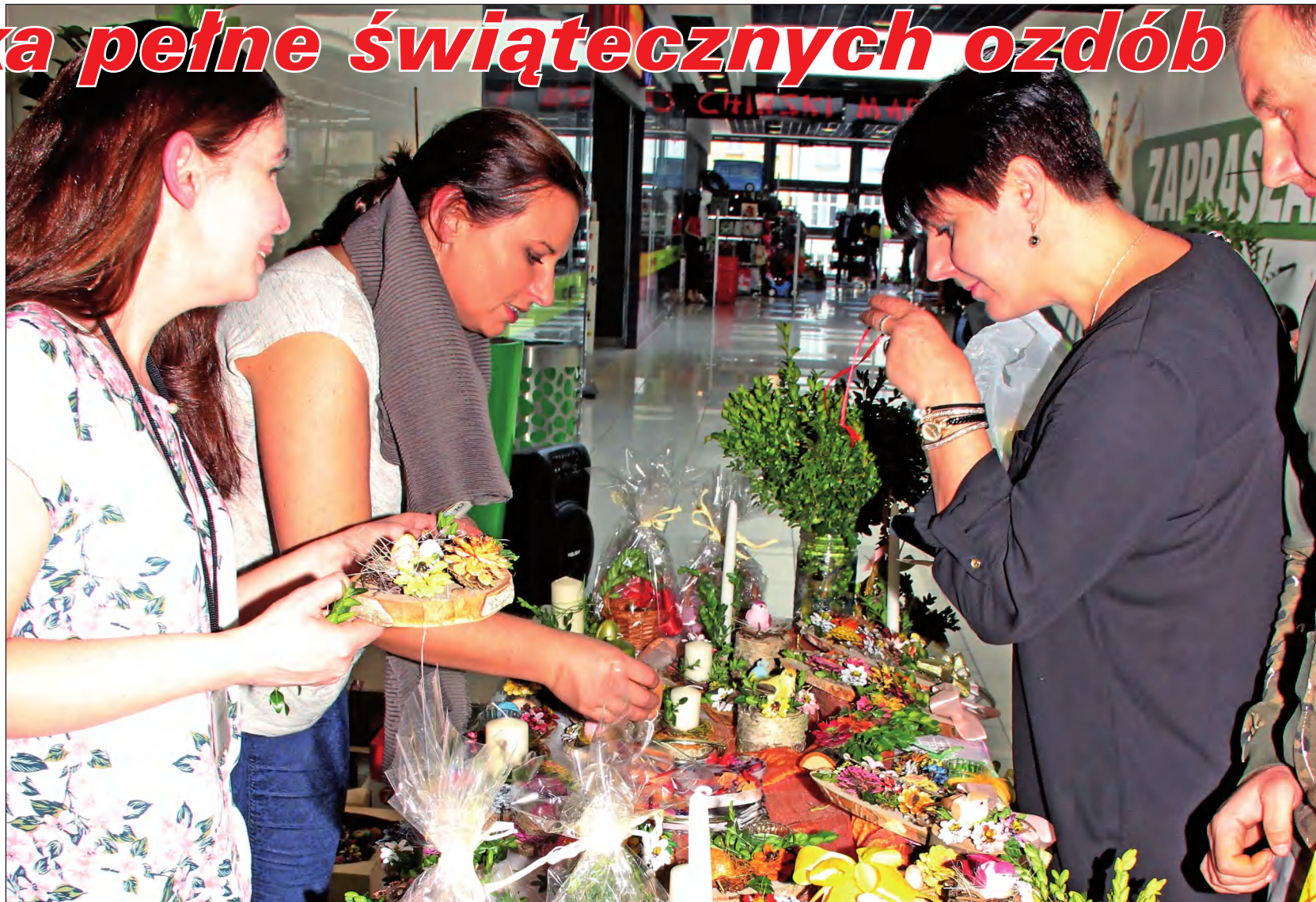
Oryginalne świąteczne ozdoby, a także przedmioty codziennego użytku, wykonane podczas zajęć prowadzonych dla niepełnosprawnych mieszkańców powiatu kwidzyńskiego, można było kupić w Centrum Handlowym „Liwa” w Kwidzynie.

Przygotowane zostały także atrakcje dla najmłodszych. Dziećmi, które podczas kiermaszu malowały świąteczne ozdoby, opiekowały się harcerki z 68 Drużyny Harcerskiej „Wesołe Włóczęgi” działającej w Młodzieżowym Ośrodku Wychowawczym w Kwidzynie. Kiermasze przedświąteczne organizowane są od 25 lat przez kwidzyński Warsztat Terapii Zajęciowej przed Wielkanocą i Bożym Narodzeniem. Dochód ze sprzedaży wszystkich wyrobów przeznaczony jest w całości na rehabilitację zawodową i społeczną niepeł-