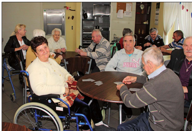
Dla wielu mieszkańców domów pomocy społecznej gra w tysiąca jest bardzo popularną formą spędzania czasu.