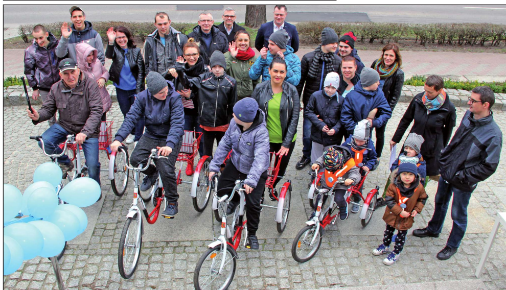
Uczestnicy otwarcia pierwszej w Kwidzynie wypożyczalni rowerów dla osób niepełnosprawnych.