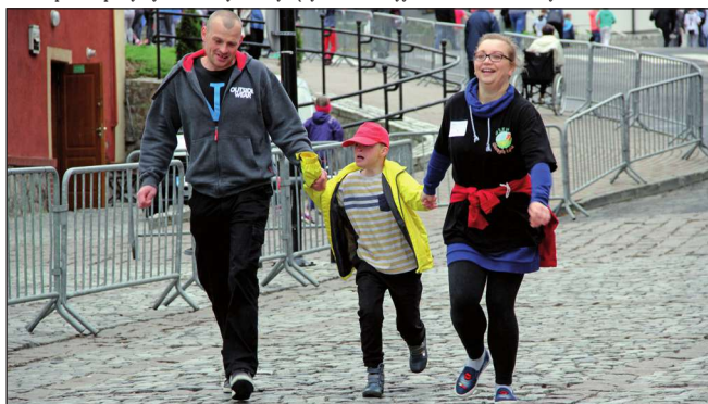
Najważniejsze było uczestnictwo w biegu i dobra zabawa, chociaż pokonanie trasy wymagało dużego wysiłku.