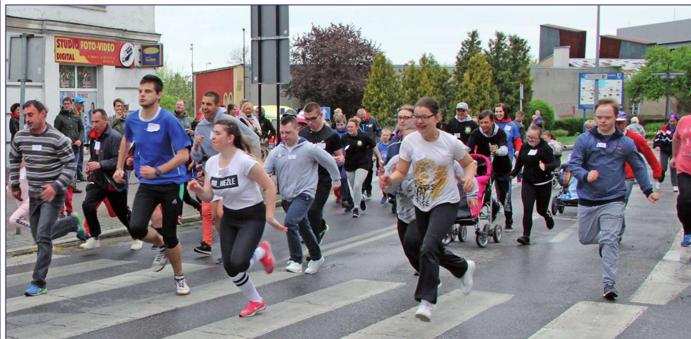
Unijny Ogólnopolski Bieg Uliczny odbył się już po raz szesnasty, natomiast o dwa lata młodszy jest bieg organizowany dla osób niepełnosprawnych.