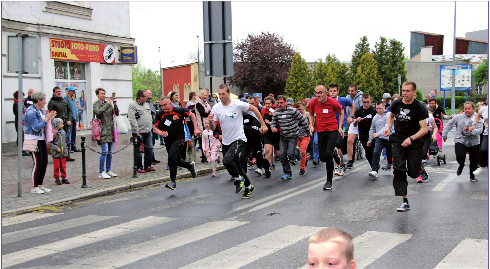
Bieg rozgrywany był w kilku kategoriach, w tym kobiety i mężczyźni do 18 lat i dzieci do lat 10, kobiety i mężczyźni powyżej 18 lat oraz osoby na wózkach

Niepełnosprawni zawodnicy wystartowali w Ogólnopolskim Unijnym Biegu Osób Niepełnosprawnych, który towarzyszył Unijnemu Ogólnopolskiemu Biegowi Ulicznemu, organizowanemu przez Kwidzyński Klub Lekkoatletyczny „Rodło”. Współorganizatorem biegu był Dom Pomocy Społecznej w Kwidzynie. Bieg rozgrywany był w kilku kategoriach, w tym kobiety i mężczyźni do 18 lat i dzieci do lat 10, kobiety i mężczyźni powyżej 18 lat oraz osoby na wózkach elektrycznych i pchanych.