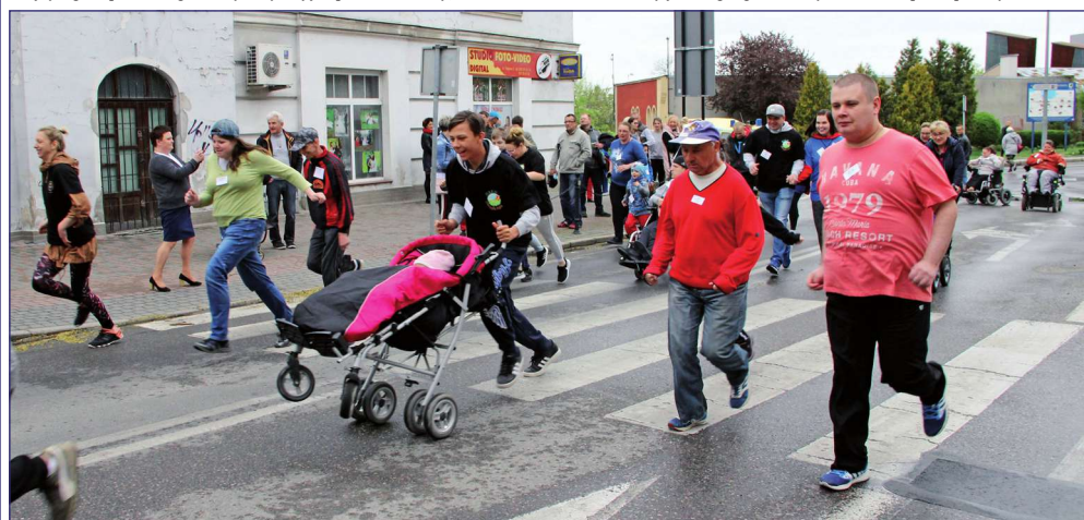
Trasa biegu przebiegała ulicami Targową, Batalionów Chłopskich oraz Braterstwa Narodów i kończyła się na ulicy Katedralnej.