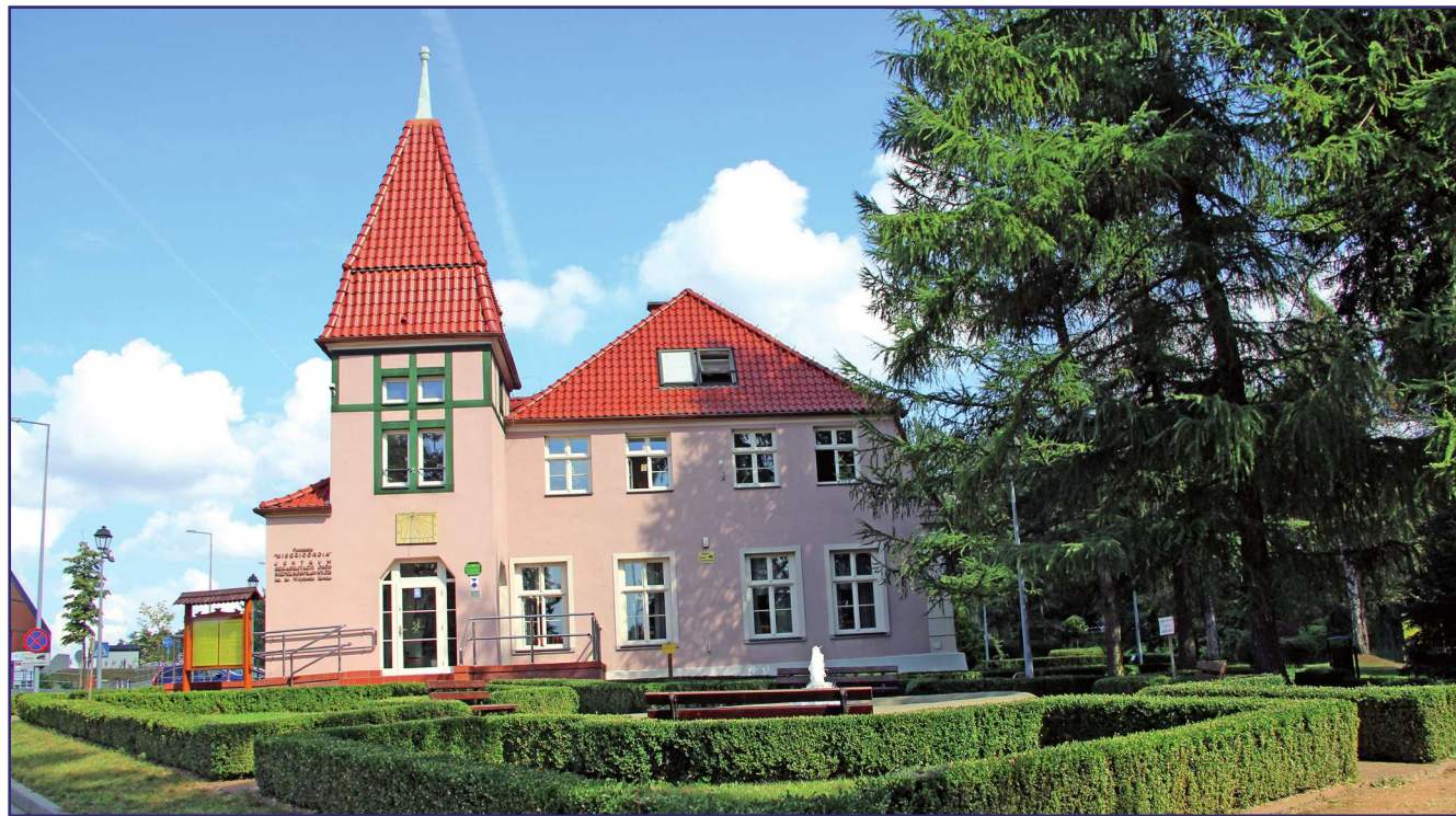
W przyszłą środę, 22 maja w zabytkowym dworku w Górkach (gmina Kwidzyn) odbędzie się międzynarodowa konferencja z udziałem przedstawicieli Niemiec, Ukrainy i Polski.

W przyszłą środę, 22 maja, w zabytkowym dworku w Górkach odbędzie się międzynarodowa konferencja z udziałem przedstawicieli Niemiec, Ukrainy i Polski. Dworek jest siedzibą kwidzyńskiego Warsztatu Terapii Zajęciowej, prowadzonego przez Fundację „Misericordia”. Spotkanie odbędzie się pod hasłem „Osoba niepełnosprawna i seniorzy w nowoczesnym społeczeństwie europejskim”.