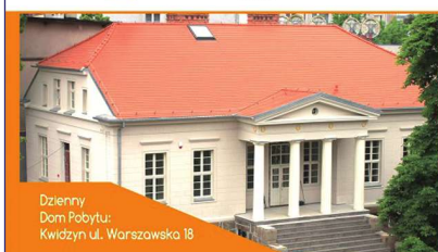
Dzienny Dom Pobytu: Kwidzyn ul. Warszawska 18