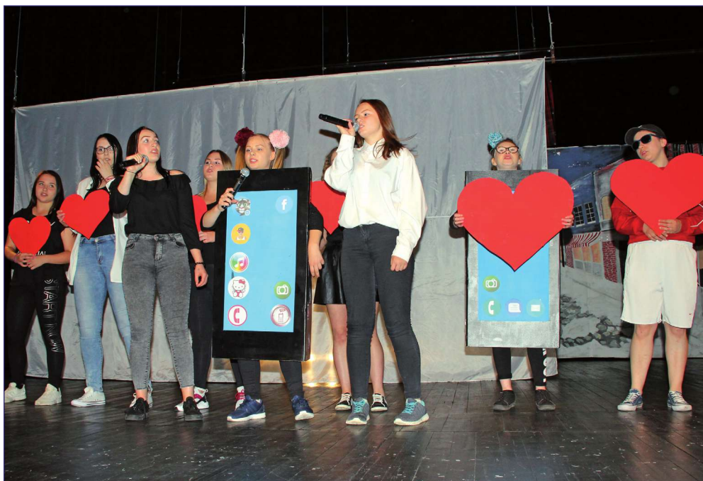
Zespół teatralny „Plama” z Młodzieżowego Ośrodka Wychowawczego w Kwidzynie w ubiegłym roku zaprezentował przedstawienie „Pocket Friend”.

Na deskach kwidzyńskiego teatru zaprezentują się dzisiaj młodzi aktorzy z placówek kształcenia specjalnego z kilku województw. Kilkanaście przedstawień odbędzie się w dniach 15 i 16 maja, w ramach Kwidzyńskiego Forum Teatralnego Placówek Kształcenia Specjalnego. Impreza odbędzie się po raz dwudziesty szósty pod honorowym patronatem Rzecznika Praw Obywatelskich. Pomysłodawcą i organizatorem Forum jest Młodzieżowy Ośrodek Wychowawczy im. Janusza Korczaka w Kwidzynie.