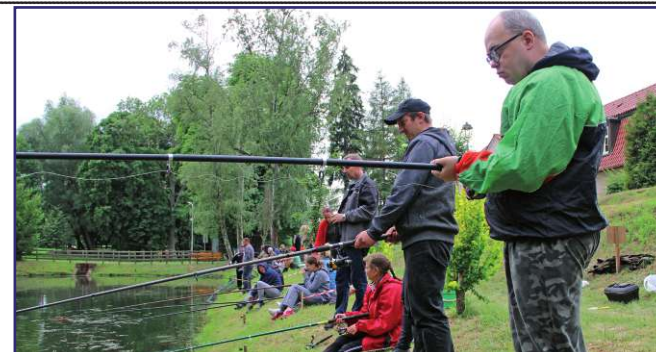
Wędkarze łowili ryby w stawach przy zabytkowym dworku, który jest siedzibą WTZ.