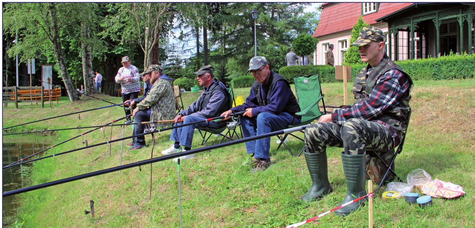
Osiem drużyn walczyło o zwycięstwo w Zawodach Wędkarskich – splotkowych, dla osób niepełnosprawnych w Górkach, w gminie Kwidzyn. Organizatorem zawodów jest Warsztat Terapii Zajęciowej w Kwidzynie, prowadzony przez Fundację „Misericordia”.