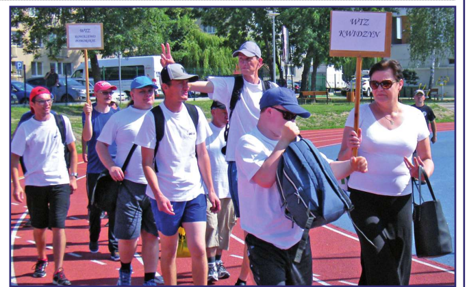
Reprezentacja kwidzyńskiego WTZ podczas ceremonii rozpoczęcia Spartakiady Osób Niepełnosprawnych w Łasinie.