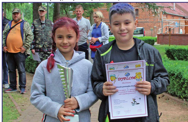
Najwięcej ryb udało się złowić „Rodzinie Kwidzyn”