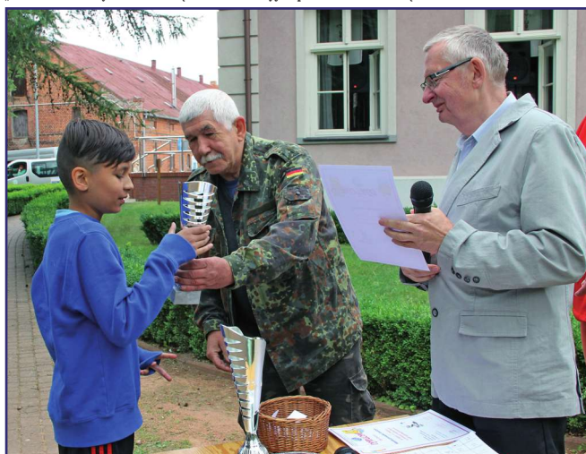
Drugie miejsce zajęła drużyna „Przyjaciele Kwidzyn”