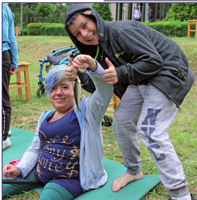
„Rodzinka Kwidzyn” okazała się bezkonkurencyjna podczas zawodów wędkarskich.