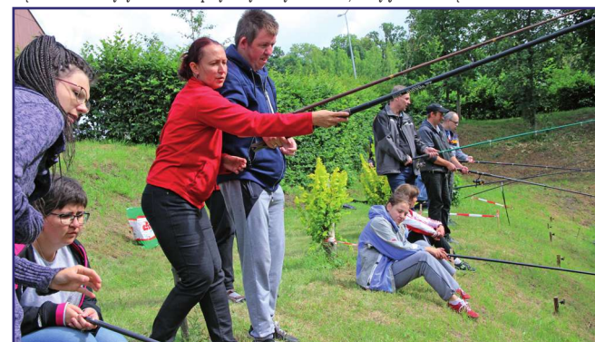
W zawodach udział wzięły reprezentacje WTZ w Koniecwałdzie, Ryjewie, Dzierzgoniu i Kwidzynie, domów pomocy społecznej w Ryjewie i Kwidzynie oraz wędkarze, reprezentujący różne środowiska osób niepełnosprawnych.