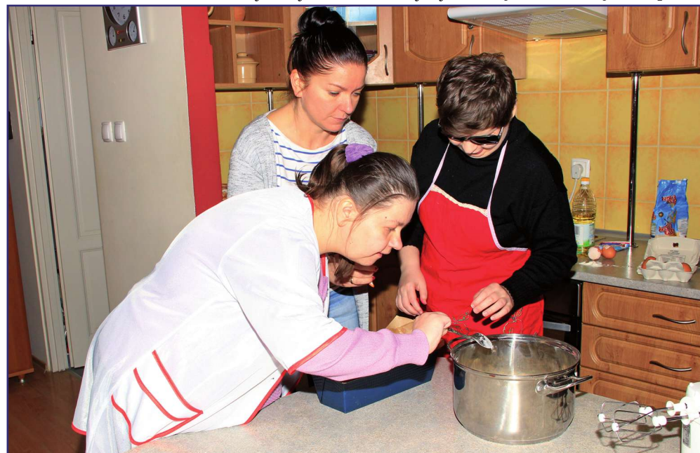
Jeżeli ktoś jest osobą niepełnosprawną, która siedzi w domu i ogranicza swoją aktywność tylko do telewizji lub komputera, a myśli o zmianie swojego życia, to nasz warsztat jest miejscem dla niej lub dla niego.