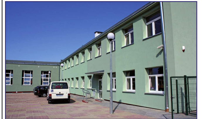
Szkoła Specjalna Przysposabiająca do Pracy zastąpiła zlikwidowany Zespół Szkół Specjalnych w Kwidzynie.

Szkoła Specjalna Przysposabiająca do Pracy zastąpiła zlikwidowany Zespół Szkół Specjalnych w Kwidzynie. W ramach ZSS funkcjonowały Gimnazjum Specjalne nr 4 oraz Szkoła Specjalna Przysposabiająca do Pracy. Poza tym w szkole organizowane były zajęcia rewalidacyjno-wychowawcze dla dzieci i młodzieży z upośledzeniem w stopniu głębokim. Powodem likwidacji ZSS i utworzenie w jej miejsce nowej placówki są zmiany w systemie oświaty, które zlikwidowały gimnazja.