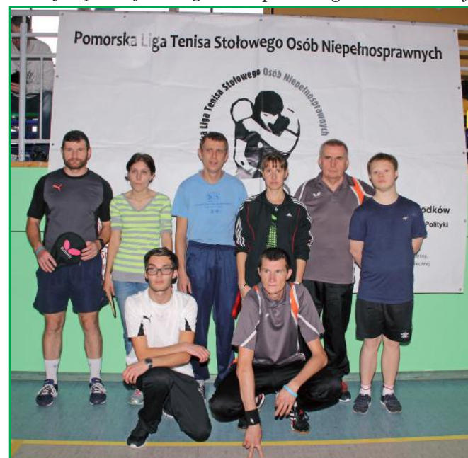
Tenisiści z Warsztatu Terapii Zajęciowej w Kwidzynie z siedzibą w Górkach rywalizowali przez cały rok w dwóch grupach Pomorskiej Ligi Tenisa Stołowego Osób Niepełnosprawnych.

klasyfikacji indywidualnej. Oprócz tego bardzo dobry