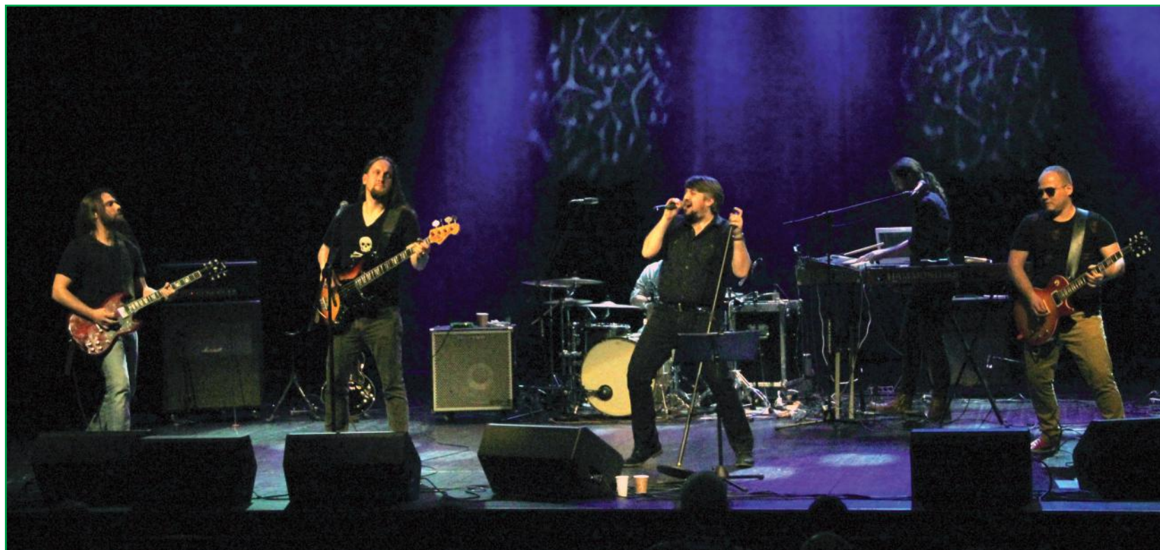
W kwidzyńskim teatrze odbył się koncert charytatywny zespołu The Rolling Stones Tribute. Koncert to wspólna inicjatywa gdańskiej Fundacji Uznanie i Stowarzyszenia na Rzecz Osób z Autyzmem SNOA.

Fundacja Uznanie postawiła sobie między innymi za cel integrację osób w różnym wieku poprzez śpiew, grę na instrumentach, fotografię, pisanstwo, malarstwo czy rzeźbę. Jest także organizatorem comiesięcznych Gdańskich Sobotnich Wieczorów Artystycznych. SNOA w Kwidzynie to organizacją pożytku publicznego, działająca na rzecz osób z całościowymi zaburzeniami rozwojowymi oraz ich rodzin i wychowawców. Prowadzi między innymi działania obejmujące bezpośrednią pomoc terapeutyczną, udziela wsparcia, organizuje szkolenia i konsultacje dla rodziców, wychowawców i innych osób mających styczność z osobami z autyzmem. Stowarzyszenie działa przeciwko izolacji społecznej osób z zaburzeniami ze spektrum autyzmu obejmując je intensywną terapią od momentu wykrycia nieprawidłowości rozwojowych po dojrze-