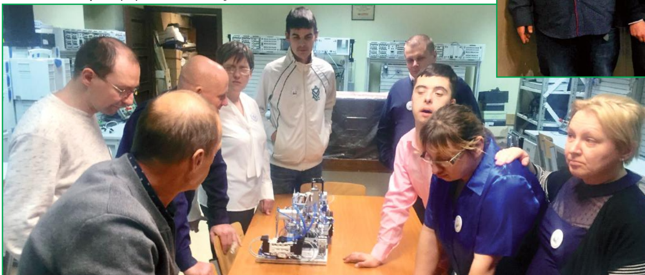
Uczestnicy sprawdzianu mogli zapoznać się z ofertą edukacyjną Zespołu Szkół Mechanicznych w Elblągu.