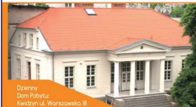
Dzienny Dom Pobytu: Kwidzyn ul. Warszawska 18