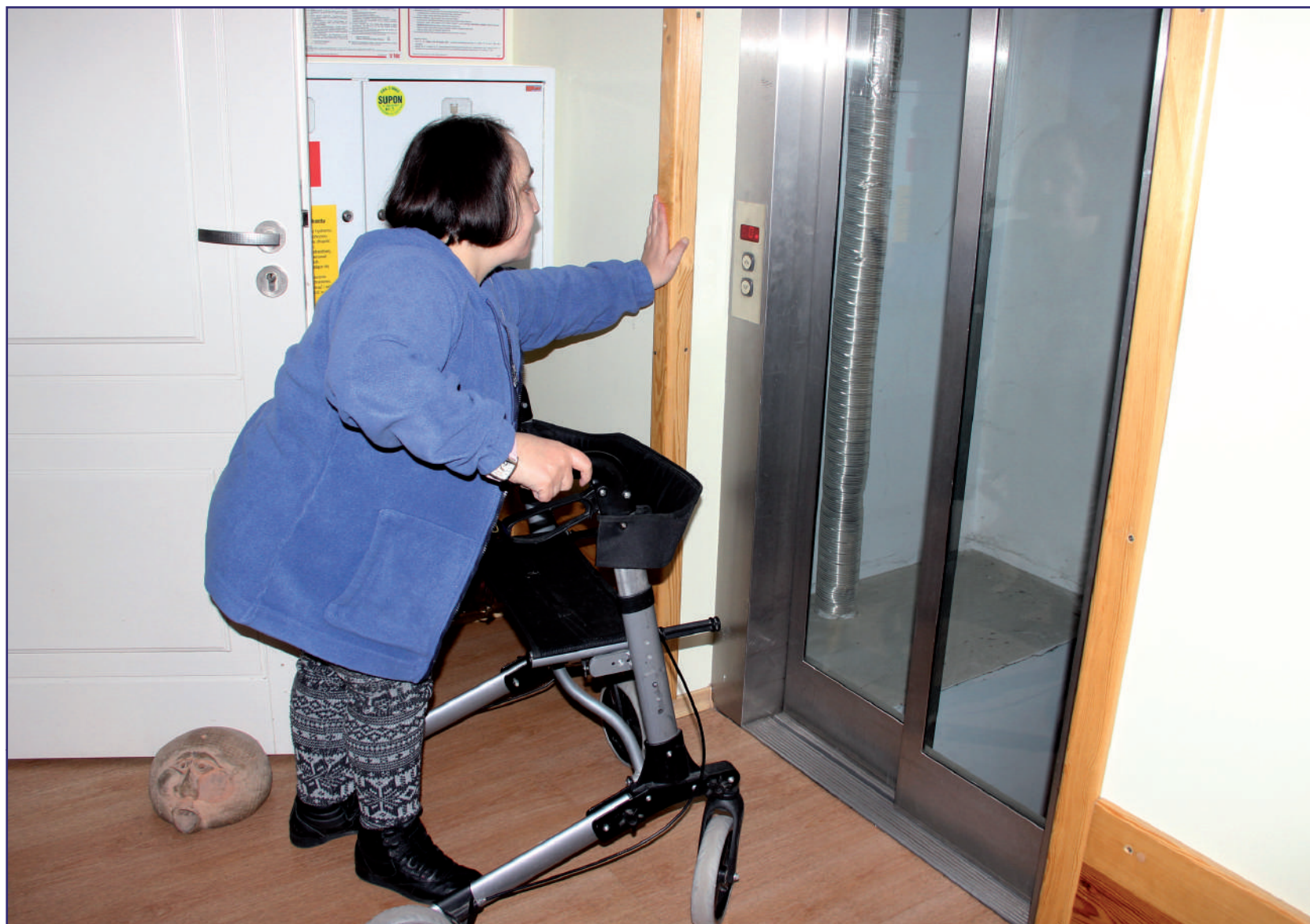
W ramach tegorocznego programu realizowanych będzie kilka obszarów, w tym dotyczących między innymi likwidacji barier. Wsparcie ma umożliwić osobom niepełnosprawnym swobodne poruszanie się w różnych budynkach.

Najczęściej ze środków PFRON przyznawanych w ramach programu wyrównywania różnic między regionami korzystano do tej pory w przypadkach likwidacji barier w urzędach,