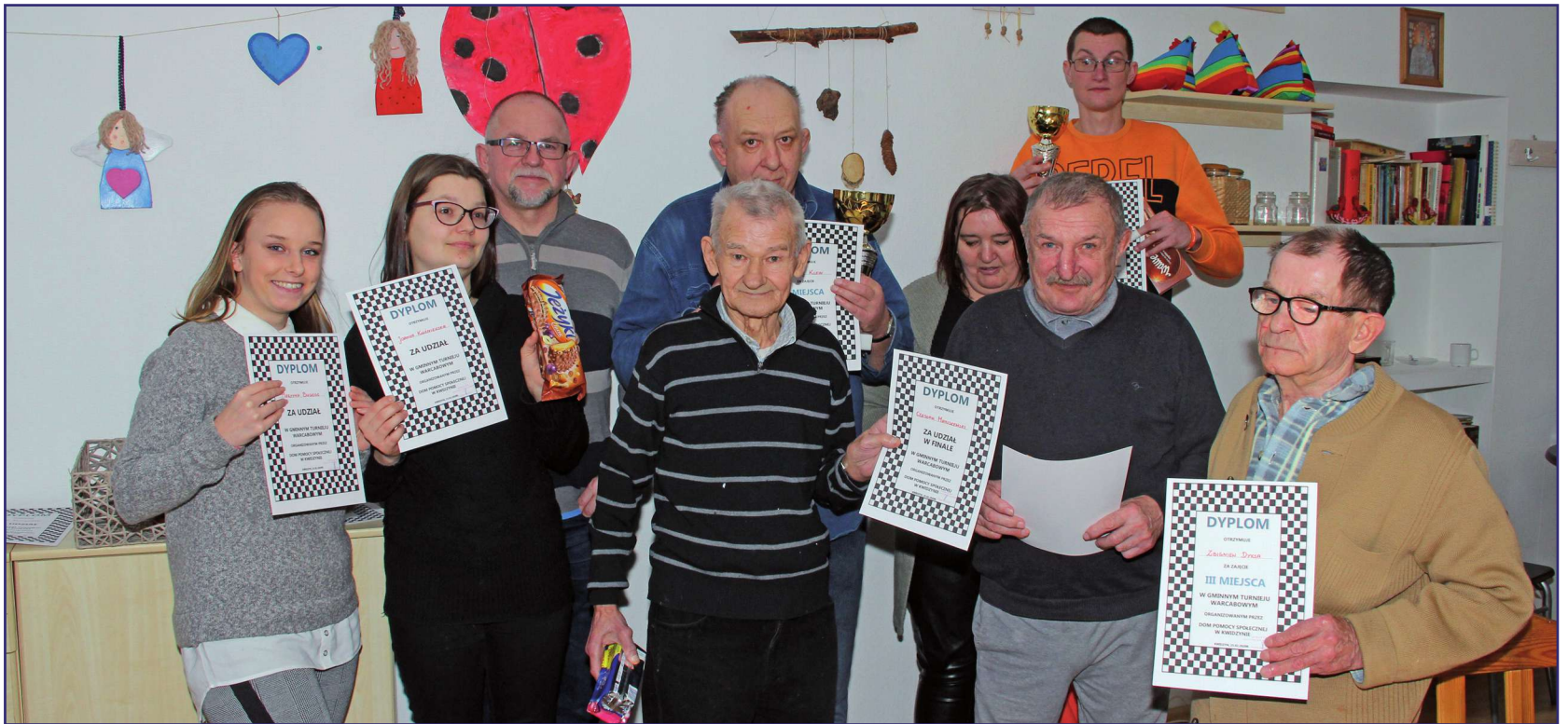
Turniej Warcabowy o Puchar Dyrektora Domu Pomocy Społecznej odbył się już po raz dziewiętnasty. Rywalizacja jak zawsze jest bardzo zacięta. Czwórka finalistów długo walczyła o miejsca na podium.