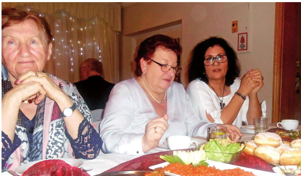
Członkowie Stowarzyszenia „Seniorzy 50+” w Kwidzynie spotkali się w tłusty czwartek.

Członkowie Stowarzyszenia „Seniorzy 50+” w Kwidzynie spotkali się w tłusty czwartek. Nie zabrakło pączków i pożegnania karnawału. W spotkaniu udział wzięło udział ok. 50 osób.