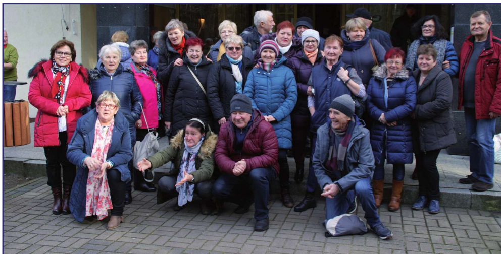
Krynica Morska była miejscem walentynkowego spotkania seniorów ze Stowarzyszenia „Seniorzy 50+” w Kwidzynie.

Krynica Morska była miejscem walentynkowego spotkania seniorów ze Stowarzyszenia „Seniorzy 50+” w Kwidzynie. Nad morze wybrało się 78 osób.