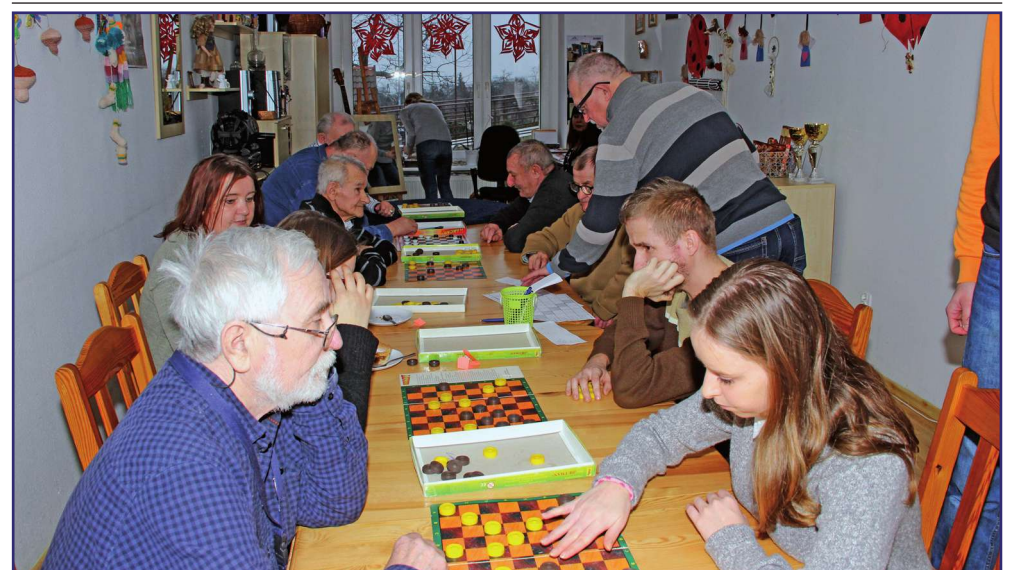
Turniej powiatowy pozwala wyłonić najlepszych, niepełnosprawnych zawodników z powiatu kwidzyńskiego, którzy powalczą w XVIII Pomorskim Turnieju Warcabowym Osób Niepełnosprawnych.