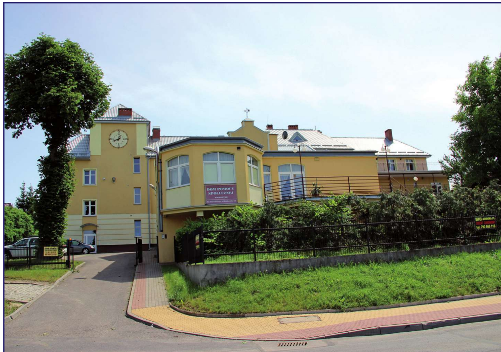
(op) Rodziny mieszkańców Domu Pomocy Społecznej w Kwidzynie mogą się kontaktować pod numerami telefonów 55 279 3721 lub 603 537 395.

Rodziny mieszkańców Domu Pomocy Społecznej w Kwidzynie mogą się kontaktować pod numerami telefonów 55 279 3721 lub 603 537 395. Wszelkie sprawy urzędowe można realizować za pomocą poczty elektronicznej: e-mail: dom@dpskwidzyn.pl lub ePUAP. Zakaz wstępu na teren obiektów placówki oraz ich opuszczania przez mieszkańców obowiązuje w Domu Pomocy Społecznej „Słoneczne Wzgórze” w Ryjewie. Z domem można się kontaktować dzwoniąc pod numer 55 277 42 36. Sprawy urzędowe można załatwić również drogą elektroniczną poprzez pocztę elektroniczną: dom@dpsryjewo.pl lub pozostawiając wniosek w skrzynce na portierni przy bramie wjazdowej.