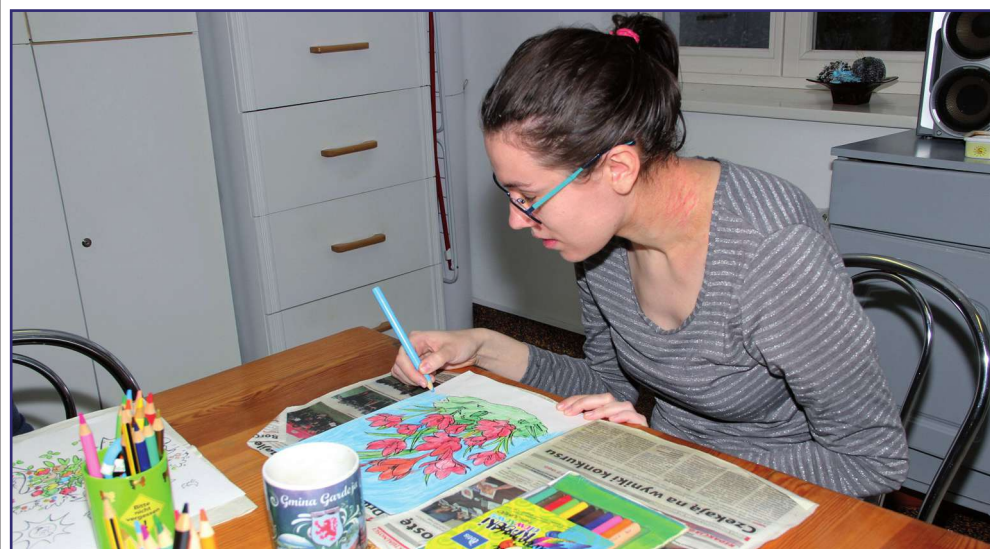
Do 10 kwietnia zawieszono zostały zajęcia w warsztatach terapii zajęciowych i innych placówkach pomocy dziennej.

Do 10 kwietnia zawieszono będą zajęcia w warsztatach terapii zajęciowych i innych placówkach pomocy dziennej. Jak zapewnia Państwowy Fundusz Rehabilitacji Osób Niepełnosprawnych, pomimo braku zajęć wszystkie placówki mogą liczyć na finansowanie.