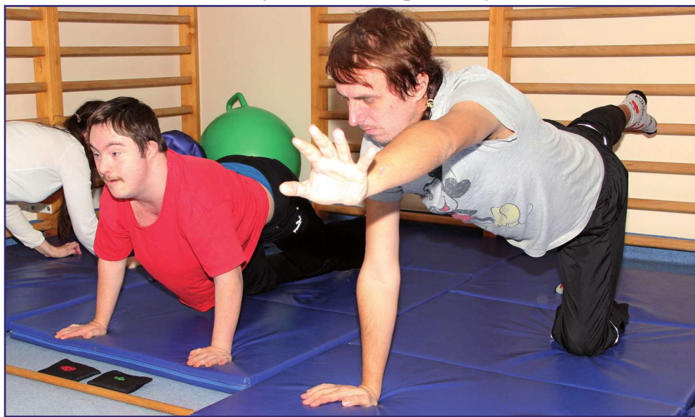
Zarząd Państwowego Funduszu Rehabilitacji Osób Niepełnosprawnych podjął uchwałę w sprawie podziału środków finansowych na 2020 rok z tzw. algorytmu. Pieniądze na rehabilitację społeczną i zawodową powinny w najbliższym czasie trafić do powiatu kwidzyńskiego.

Zarząd Państwowego Funduszu Rehabilitacji Osób Niepełnosprawnych podjął uchwałę w sprawie podziału środków finansowych na 2020 rok z tzw. algorytmu. Pieniądze na rehabilitację społeczną i zawodową powinny w najbliższym czasie trafić do powiatu kwidzyńskiego. Nie wiadomo jednak czy wszystkie zadania uda się zrealizować. Dotyczy to szczególnie turnusów rehabilitacyjnych. Wnioski o dofinansowanie można składać przez cały czas.