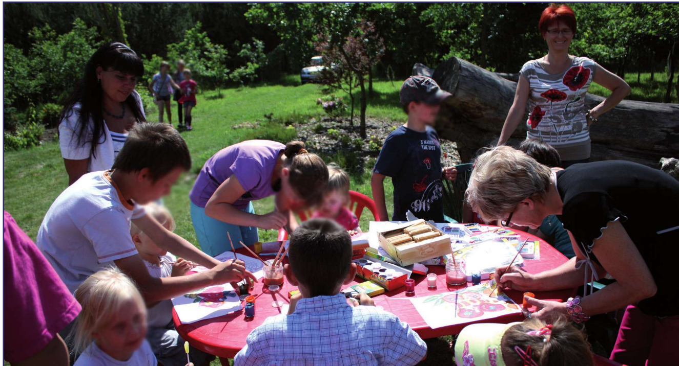
Rodziny zastępcze, a także rodzinne domy dziecka przeżywają trudne chwile. Z powodu zagrożenia koronawirusem dzieci nie tylko nie mogą opuszczać domów.

- Jesteśmy w kontakcie telefonicznym z rodzinami. Pracownicy w obecnej sytuacji nie wyjeżdżają. Nie ma takiej potrzeby. Największym problemem jest zdalne nauczanie. W domu są dwa, trzy komputery, a kilkoro dzieci w różnym wieku. Bardzo trudno jest to pogodzić. To oczywiście także problem rodzin wielodzietnych. W domach dziecka też nie ma tylu komputerów, aby przy nich jednocześnie posadzić dziesięciorgo dzieci. Nie wszyscy rodzice mają także dostateczną wiedzę, aby pomóc dziecku w matematyce czy fizyce na poziomie szkoły średniej. Poza tym rodzice zgłaszają nam, że ich dzieci otrzymują zadania do wykonania, które nie do końca