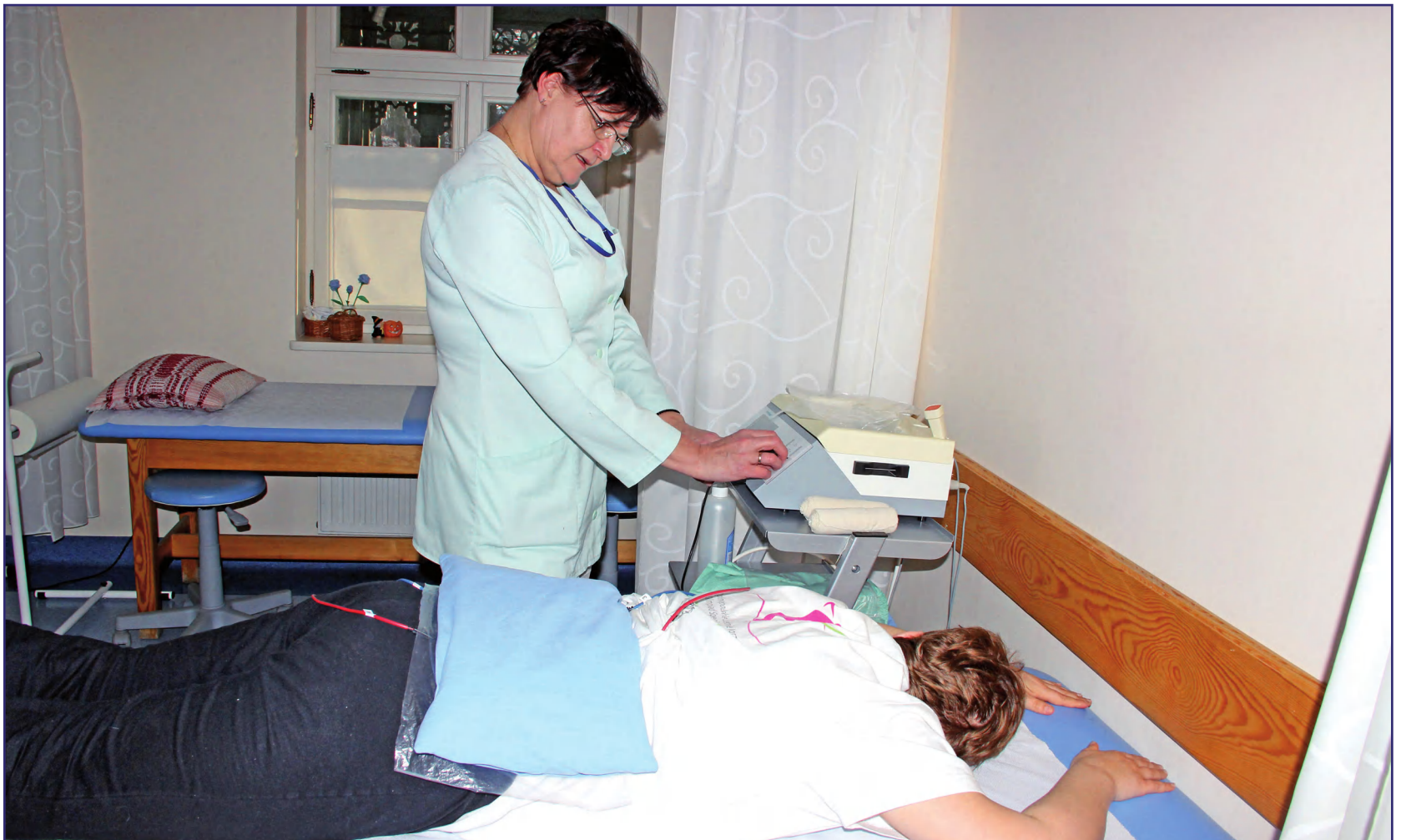
Pomoc finansowa udzielana będzie osobom niepełnosprawnym, które na skutek wystąpienia stanu epidemii utraciły, w okresie od 9 marca do 4 września 2020 roku, możliwość opieki świadczonej w placówce rehabilitacyjnej.

- Pomoc finansowa udzielana będzie osobom niepełnosprawnym, które na skutek wystąpienia stanu epidemii utraciły, w okresie od 9 marca do 4 września 2020 roku, możliwość opieki świadczonej w placówce rehabilitacyjnej. Pomoc ta udzielana jest w formie dofinansowania kosztów związanych z zapewnieniem opieki w warunkach domowych. Wysokość pomocy wynosi 500 zł miesięcznie na jedną osobę niepełnosprawną, z tym że okres, na jaki może zostać przyznane świadczenie, nie może być dłuższy niż 3 miesiące. Z programu mogą skorzystać między innymi niepełnosprawni podopieczni środowiskowych domów samopomocy, dziennych domów pomocy społecznej, uczestnicy zajęć rewalidacyjno-wychowawczych oraz wychowankowie specjalnych ośrodków szkolno-wychowawczych i specjalnych ośrodków wychowawczych. Aby otrzymać wsparcie, należy wypełnić wniosek i wskazać konkretny ośrodek, którego działalność została zawieszona uniemożliwiając korzystanie z rehabilitacji przynajmniej przez 5 dni w miesiącu, w związku z zagrożeniem epidemicznym. Polecam złożenie wniosku przez System Obsługi Wsparcia. Wystarczy wejść na stronę: sow.pfron.org.pl . Tak jest najprościej. Wnioski są już skła-