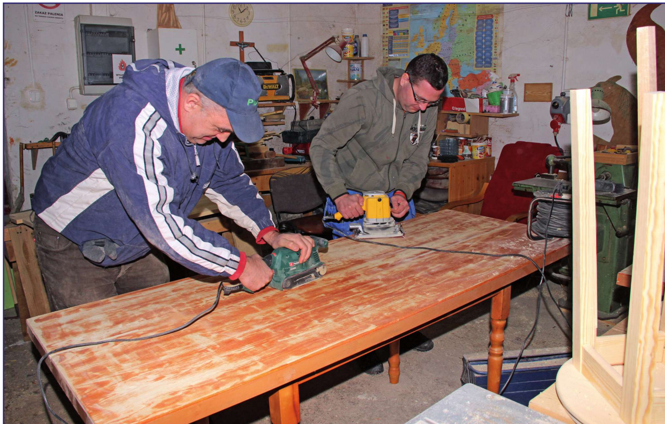
Na dofinansowanie kosztów działania warsztatów terapii zajęciowej w Kwidzynie i Ryjewie przeznaczono ponad 1,8 mln zł. Na zdjęciu: zajęcia prowadzone w pracowni stolarsko-edukacyjnej w kwidzińskim WITZ.

Ponad 2,7 mln zł trafiło do powiatu z Państwowego Funduszu Rehabilitacji Osób Niepełnosprawnych. To o ok. 300 tys. zł więcej na rehabilitację społeczną i zawodową niż w ubiegłym roku. Samorząd powiatu podzielił już pieniądze na poszczególne zadania podczas nietypowej sesji, która odbyła się korespondencyjnie.