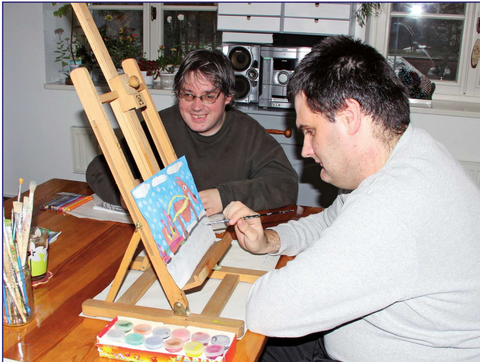
Do 24 kwietnia zawieszona będą zajęcia w warsztatach terapii zajęciowych i innych placówkach pomocy dziennej.

- Dotyczy to placówek wsparcia dziennego, centrów integracji społecznej, klubów integracji społecznej, dziennych domów i klubów seniora, środowiskowych domów samopomocy oraz warsztatów terapii zajęciowej. Oczywiście zawieszenie działalności ma na celu ochronę zdrowia i bezpieczeństwa uczestników i pracowników wnaszych placówek. Wszyscy musimy się