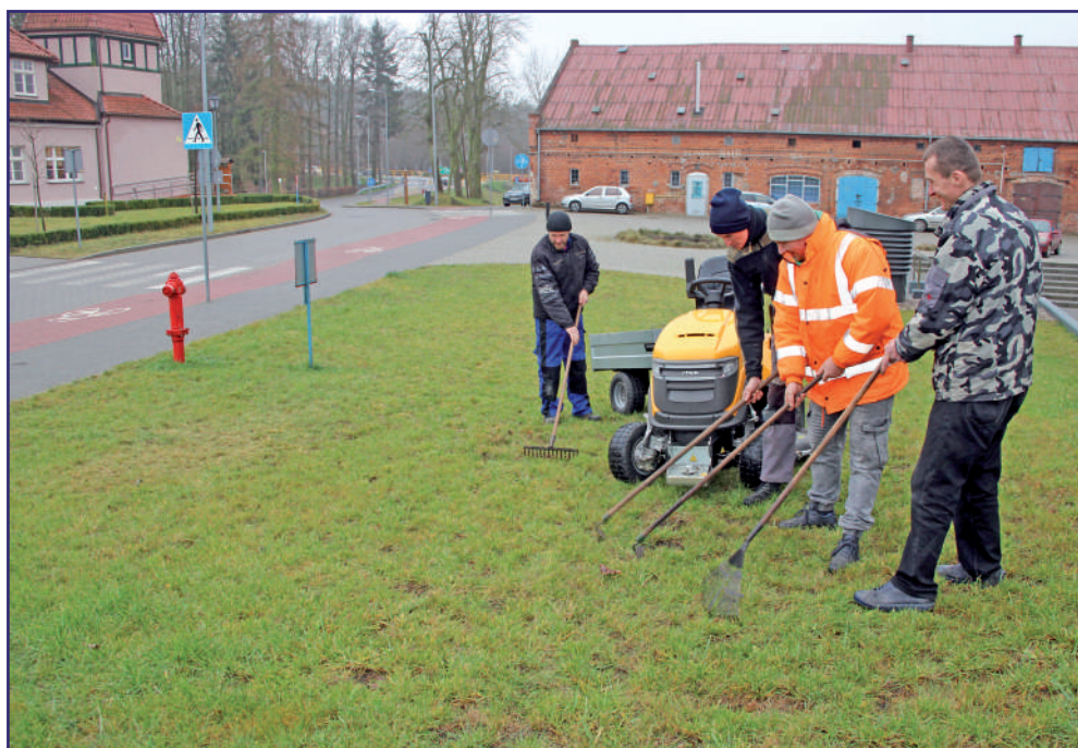
Z pomocy PFRON mogą skorzystać między innymi uczestnicy warsztatów terapii zajęciowej, ale tylko ci, którzy nie są mieszkańcami domów pomocy społecznej.

Świadczenie nie przysługuje za miesiąc, w którym nastąpiła wypłata dodatko-