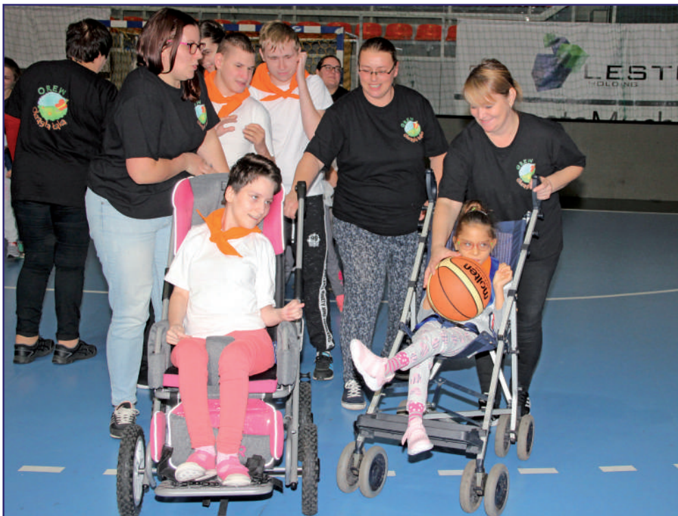
Organizacje pozarządowe, które każdego roku realizują różne projekty dla osób niepełnosprawnych znalazły się w trudnej sytuacji. Nie mogą na razie realizować swoich planów. Być może po poluzowaniu obostrzeń związanych z pandemią przynajmniej część zadań doczeka się realizacji.

Organizacje pozarządowe, które każdego roku realizują różne projekty dla osób niepełnosprawnych, znalazły się w trudnej sytuacji. Nie mogą na razie realizować swoich planów. Być może po poluzowaniu obostrzeń związanych z pandemią przynajmniej część z nich doczeka się realizacji.