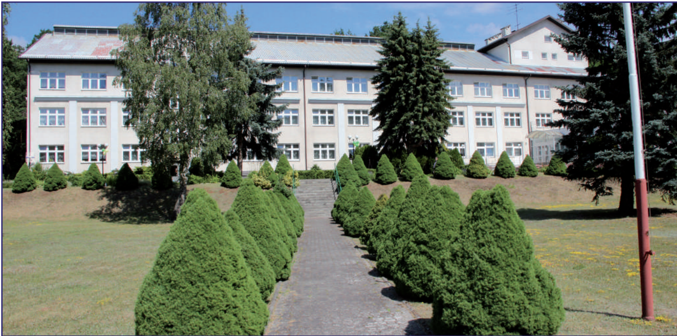
Mieszkańcy i pracownicy domów pomocy społecznej zostaną objęci testami na obecność koronawirusa. W domach nadal obowiązuje zakaz odwiedzin.

Mieszkańcy i pracownicy domów pomocy społecznej zostaną objęci testami na obecność koronawirusa. W domach nadal obowiązuje zakaz odwiedzin. Obowiązują także rygorystyczne zasady związane z ochroną mieszkańców i pracowników przed zagrożeniem koronawirusem.