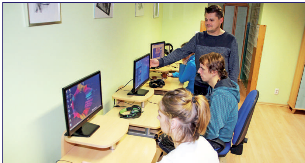
Do 24 maja wojewoda pomorski przedłużył zawieszenie zajęć między innymi w warsztatach terapii zajęciowej.

Zawieszenie dotyczy placówek wsparcia dziennego, centrów integracji społecznej, klubów integracji społecznej, dziennych domów i klubów seniora, środowiskowych domów samopomocy oraz warsztatów terapii zajęciowej. Zawieszona