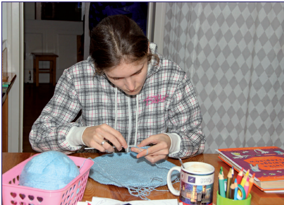
Po ponad dwóch miesiącach Warsztat Terapii Zajęciowej w Kwidzynie z siedzibą w Górkach wznowia działalność. WTZ opracował już procedury związane z przewozami uczestników oraz prowadzeniem zajęć.

Działalność wznowił między innymi Warsztat Terapii Zajęciowej w Kwidzynie z siedzibą w Górkach, który opracował już procedury związane z przewozami uczestników oraz prowadzeniem zajęć. Kupił też między innymi środki dezynfekcyjne, dozowniki i przybory dla