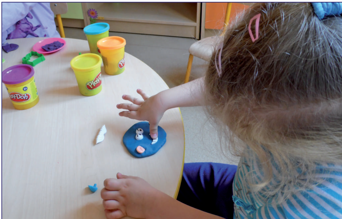
Specjalny Ośrodek Szkolno-Wychowawczy w Barcicach przygotowuje się do przyjęcia dzieci w klasach I-III, do rozpoczęcia zajęć opiekuńczych i w miarę możliwości dydaktycznych oraz rewalidacji i wczesnego wspomaganie rozwoju.

- Przygotowujemy się do przyjęcia dzieci w klasach I-III, do rozpoczęcia zajęć opiekuńczych i w miarę możliwości dydaktycznych oraz rewalidacji i wczesnego wspomaganie rozwoju. Obecnie mamy rodziców, którzy są chętni, aby dziecko rozpoczęło zajęcia w naszej placówce, ale są także tacy, którzy mają obawy i proszą o kontynuowanie edukacji zdalnej. Można zachować wszelkie środki ostrożności, ale 100 proc. gwarancji nie ma. Dobrze by było, gdyby wszystkich objął testami, ale takiego odgórnego zalecenia nie ma. Obaw ze strony rodziców, dzieci i nas samych jest dużo, ale musimy powoli przywracać ośrodek do życia. Przygotowujemy się do przyjęcia dzieci, ale robimy to bez pośpiechu. Musimy wszystko bardzo dobrze przemyśleć i zastosować wszelkie niezbędne środki, aby było to możliwe. Działania odbywają się na wielu polach. Przewoźnicy muszą zapewnić bezpieczny dowóz. Musimy też spełnić wszystkie zalecenia Głównego Inspektora Sanitarnego. Dzieci przyjmiemy tylko w takim wymiarze, jaki rekomenduje Ministerstwo Edu-