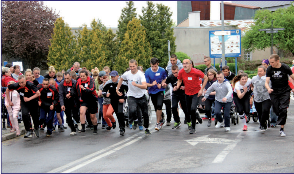
Bieg Osób Niepełnosprawnych, który towarzyszył Unijnemu Ogólnopolskiemu Biegowi Ulicznemu w Kwidzynie nie odbędzie się. Co roku organizował go Kwidzyński Klub Lekkoatletyczny „Rodło”.

Bieg Osób Niepełnosprawnych, który towarzyszył Unijnemu Ogólnopolskiemu Biegowi Ulicznemu w Kwidzynie nie odbędzie się. Co roku organizował go Kwidzyński Klub Lekkoatletyczny „Rodło”. Z powodu pandemii organizacje pozarządowe muszą rezygnować z organizacji wielu imprez lub zmieniać terminy ich realizacji.