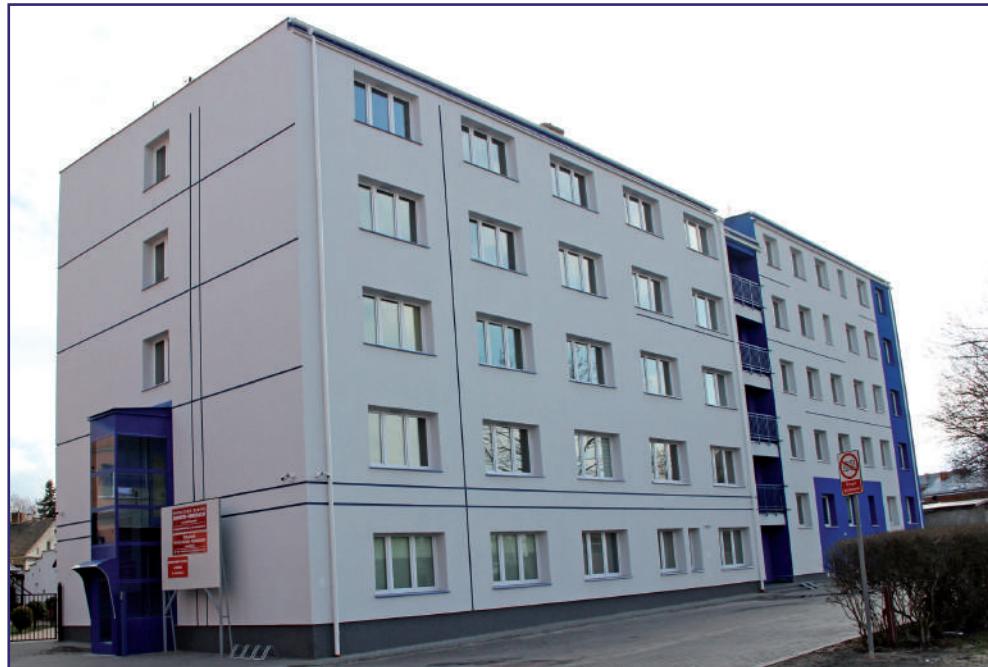
Poradnia Psychologiczno-Pedagogiczna w Kwidzynie na bieżąco diagnozuje dzieci pod kątem gotowości szkolnej, a także te, które podlegają kształceniu specjalnemu.

- Najpierw dzwoniemy do rodzica i przedstawiamy procedury przyjmowania dziecka w poradni. Telefonicznie przeprowadzamy wywiad z rodzicem, który zawsze poprzedza badanie. Po wywiadzie wyznaczamy termin. Mówimy rodzicom, aby nie przychodzili z dzieckiem za wcześnie, tylko o określonej godzinie. Nie chcemy, żeby dużo osób w tym samym czasie gromadziło się w poradni. Oczywiście wszyscy przychodzą w maseczkach i rękawiczkach. Jeżeli nie mają rękawic, to mamy punkt, w którym można zdezynfe-