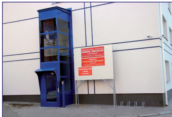
Wchodząc do poradni należy mieć na twarzy maseczkę oraz rękawiczki na rękach.

stać z dziećmi, to mamy dużo miejsca, aby rozstawić krzesła w taki sposób, aby zachowali odpowiedni dystans. Rodzice chętnie przychodzą z dziećmi. Terminy składania orzeczeń