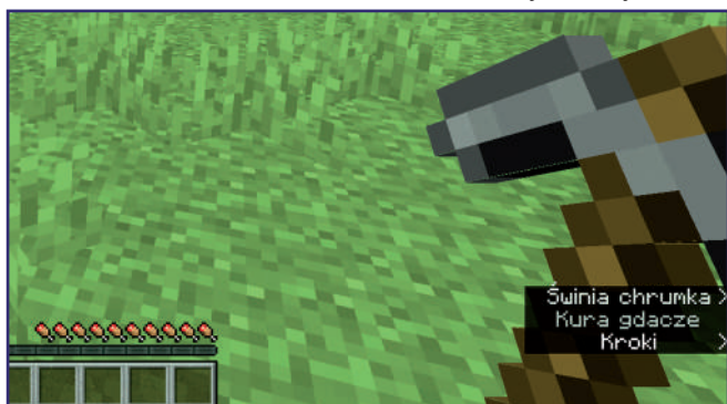
Gra Minecraft oferuje napisy dla źródeł dźwięku w pobliżu gracza. Gracz otrzymuje również informację o tym, z której strony dochodzi dany dźwięk.