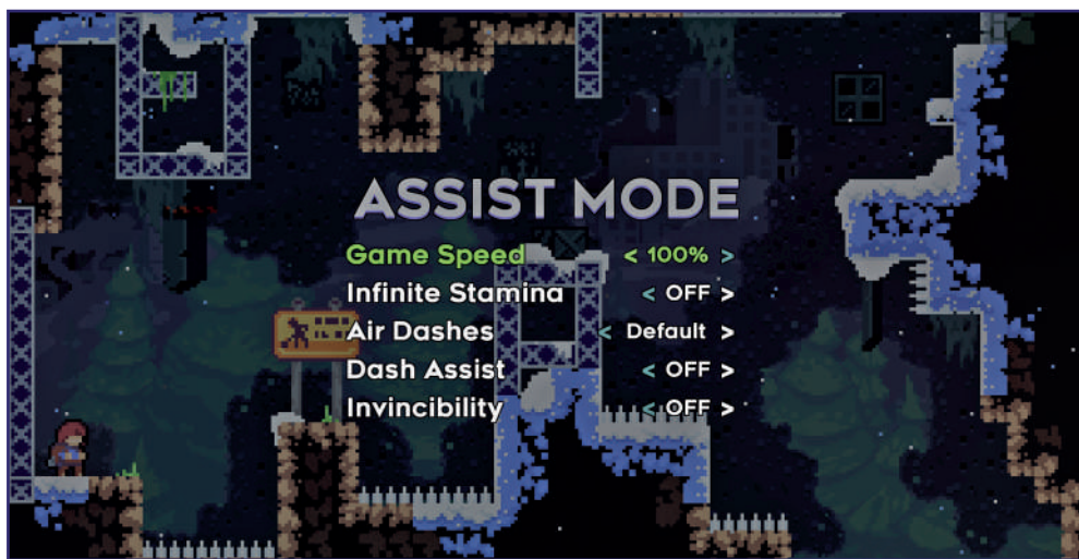
Gra Celeste jest znana z wysokiego poziomu trudności. Aby mógł się nią cieszyć każdy bez względu na umiejętności, gra oferuje tryb asysty umożliwiający graczowi m.in. włączenie nieśmiertelności lub zmniejszenie prędkości gry.

Bardzo istotna kwestia dla osób niesłyszących i niedosłyszących. Napisy są niezbędne, aby te osoby były w stanie zrozumieć dialogi mówione w grze. W grach, w których istotną rolę odgrywają dźwięki otoczenia powinny się znaleźć napisy także dla nich. Napisy powinny być też odpowiednio duże (najlepiej z możliwością dostosowania ich wielkości) i wyraźne – dobrze jest je umieścić na nieprzezroczystym lub półprzezroczystym tle. Ciesząca się wysoką popularnością gra Minecraft szwedzkiego studia Mojang Studios oferuje graczowi funkcję napisów dla źródeł dźwięku w pobliżu. Oprócz nazwy źródła dźwięku gracz otrzymuje informację o kierunku, z którego dochodzi dźwięk. Ułatwia to orienta-