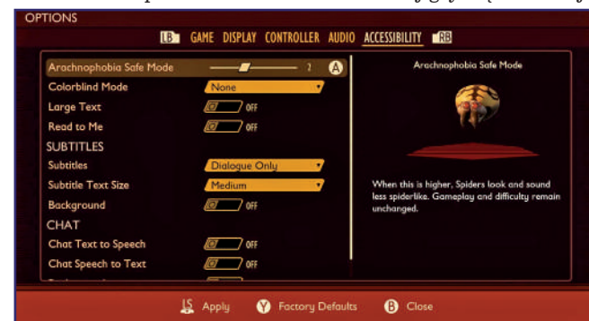
Tryb arachnofobii w grze Grounded umożliwia sprawienie aby występujące w grze pająki wyglądały i brzmiały mniej niż pająki, dzięki czemu gra jest bardziej dostępna dla osób cierpiących na arachnofobię. Podgląd pająka w menu ustawień nie zostanie wyświetlony dopóki gracz nie wcisnie odpowiedniego klawisza lub przycisku.

istoty przypominające wyglądem pająki. Tryb arachnofobii w grze umożliwia zastąpienie ich hologramami kotów. Również tutaj zmiana jest jedynie wizualna. Co zabawne, społeczność tej gry często żartuje,