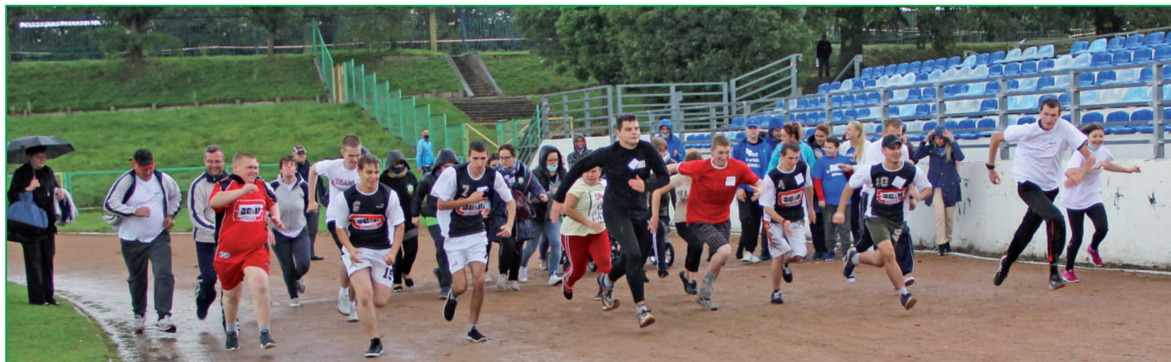
Niepełnosprawni zawodnicy wystartowali w Ogólnopolskim Unijnym Biegu Osób Niepełnosprawnych.

Zawodników na starcie powitał deszcz, jednak bardzo szybko pogoda się poprawiła