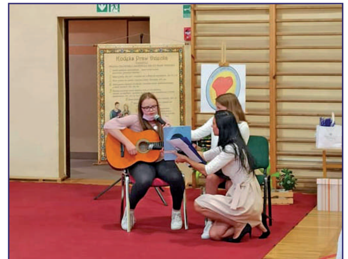
Wolontariusze przygotowali krótki występ artystyczny.

Nasi wolontariusze czynią wiele dobrego, a w tym roku to dopiero początek działań prowadzonych w ramach