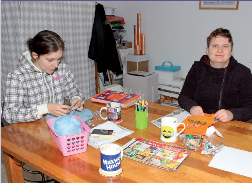
Zawieszono zostały zajęcia dla niepełnosprawnych osób w Warsztacie Terapii Zajęciowej w Kwidzynie z siedzibą w Górkach. WTZ będzie zamknięty do odwołania. To już drugie w tym roku zawieszenie działalności warsztatu spowodowane pandemią.

Zawieszono zostały zajęcia dla osób niepełnosprawnych w Warsztacie Terapii Zajęciowej w Kwidzynie z siedzibą w Górkach. WTZ będzie zamknięty do odwołania. To już drugie w tym roku zawieszenie działalności warsztatu spowodowane pandemią.