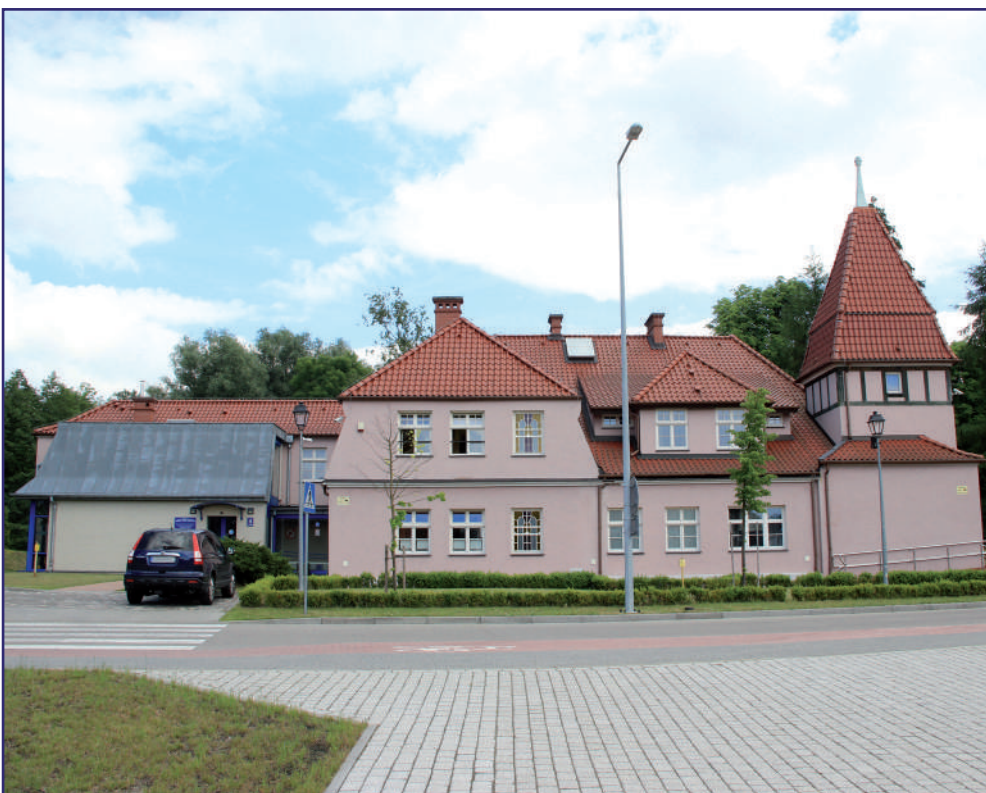
To już drugie w tym roku zawieszenie zajęć w kwidzyńskim WTZ. Z powodu pandemii zajęcia zawieszono były od 13 marca do 28 maja.

maja. Zawieszenie działalności nie oznacza jednak rezygnacji z zajęć, które będą prowadzone zdalnie.