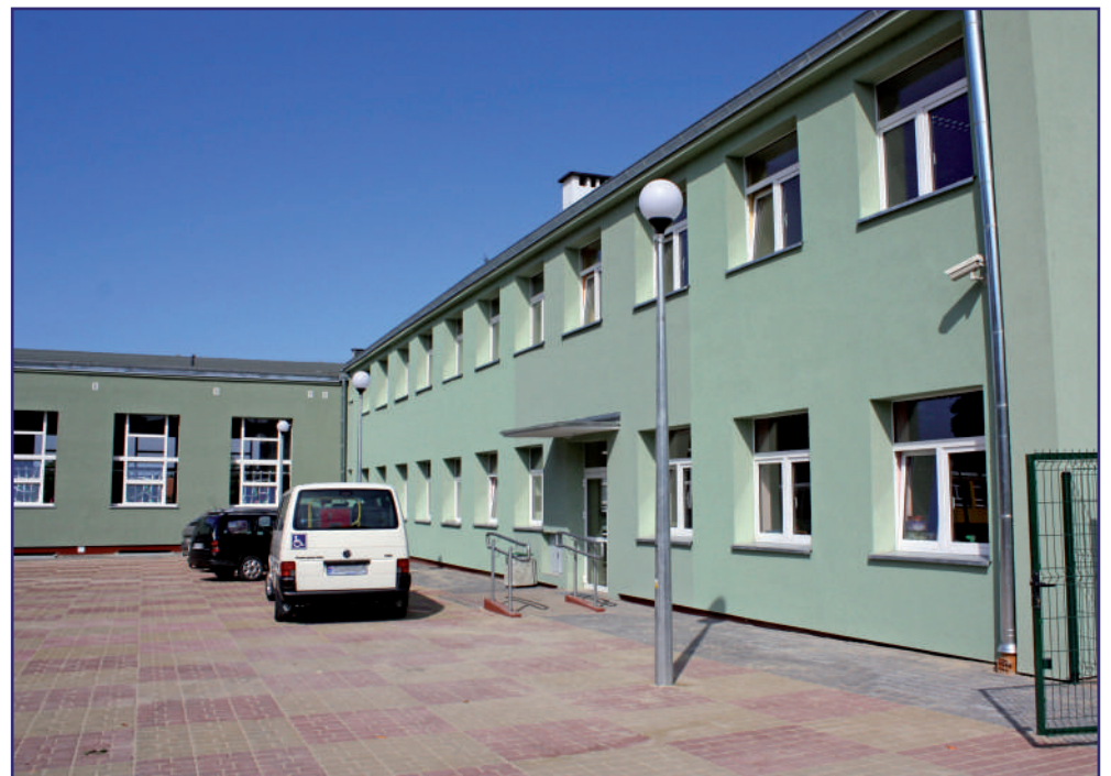
Zwiększona została liczba miejsc w Powiatowym Środowiskowym Domu Samopomocy w Kwidzynie. To placówka wspierająca osoby z zaburzeniami psychicznymi.

Zwiększona została liczba miejsc w Powiatowym Środowiskowym Domu Samopomocy w Kwidzynie. To placówka wspierająca osoby z zaburzeniami psychicznymi. Ośrodek mieści się w wydzielonej części budynku przy ul. Ogrodowej 2, w którym znajduje się także Szkoła Specjalna Przysposabiająca do Pracy.