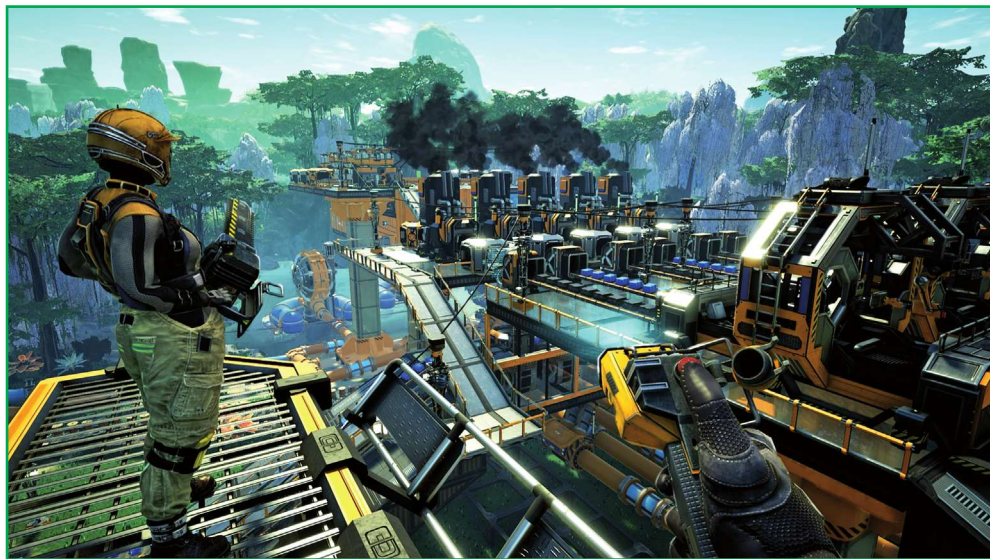
Szwedzkie studio Coffee Stain Studios stworzyło grę Satisfactory.