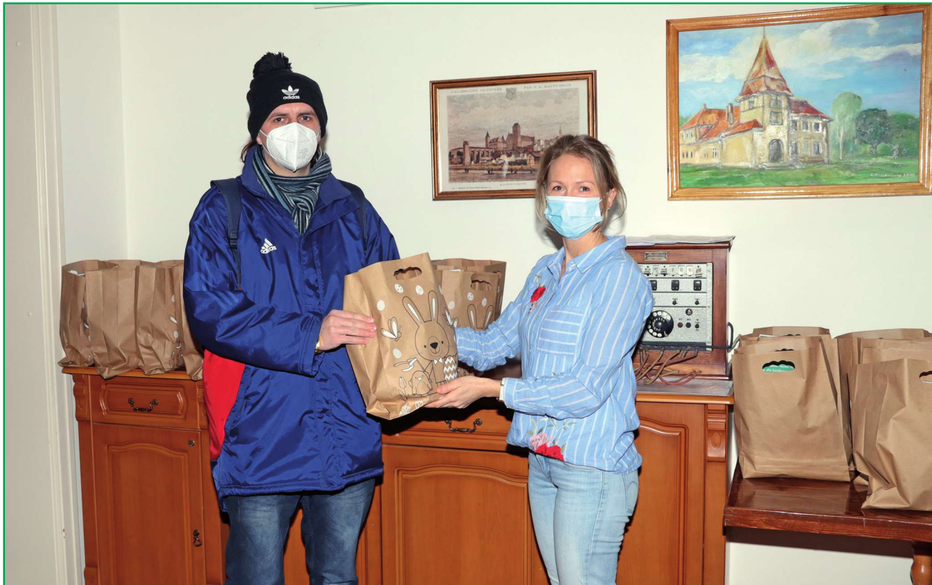
Zajęczek nie zapomniał o uczestnikach Warsztatu Terapii Zajęciowej w Kwidzynie z siedzibą w Górkach. Mimo zawieszenia działalności pracownicy warsztatu prowadzonego przez Fundację „Misericordia” przygotowali dla wszystkich paczki.

Zajęczek nie zapomniał o uczestnikach Warsztatu Terapii Zajęciowej w Kwidzynie z siedzibą w Górkach. Mimo zawieszenia działalności pracownicy warsztatu prowadzonego przez Fundację „Misericordia” przygotowali dla wszystkich paczki.