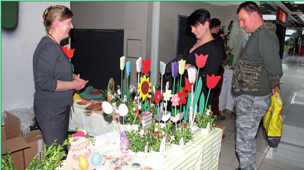
To już trzeci, w tym drugi przedświąteczny kiermasz wielkanocny, który nie odbędzie się z powodu pandemii. Organizatorem kiermaszów od ponad 20 lat jest kwidzyński Warsztat Terapii Zajęciowej, prowadzony przez Fundację „Misericordia”. Zdjęcia. archiwum

To już trzeci, w tym drugi przedświąteczny kiermasz wielkanocny, który nie odbędzie się z powodu pandemii. Organizatorem kiermaszów od ponad 20 lat jest kwidzyński Warsztat Terapii Zajęciowej, prowadzony przez Fundację „Misericordia”. W ubiegłym roku odwołany został zarówno kiermasz organizowany przed Wielkanocą, jak i przed świętami Bożego Narodzenia.