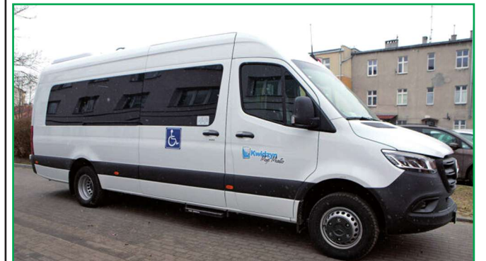
Miejski Ośrodek Pomocy Społecznej w Kwidzynie ma nowy samochód do przewozu osób niepełnosprawnych.

Miejski Ośrodek Pomocy Społecznej w Kwidzynie ma nowy samochód do przewozu osób niepełnosprawnych. Auto zostało kupione w ramach „Programu wyrównywania różnic między regionami” Państwowego Funduszu Rehabilitacji Osób Niepełnosprawnych. Program funkcjonuje od 2003 roku. Nowym pojazdem będą dowożone osoby niepełnosprawne do placówek oświatowo-wychowawczych i środowiskowych domów samopomocy