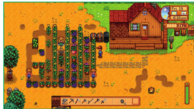
Stworzona przez amerykańskiego programistę Erica Barone'a gra Stardew Valley jest symulatorem życia na farmie inspirowanym głównie serią Harvest Moon.

Stworzona przez amerykańskiego programistę Erica Barone'a gra Stardew Valley jest symulatorem życia na farmie inspirowanym głównie serią Harvest Moon. Bohater gry