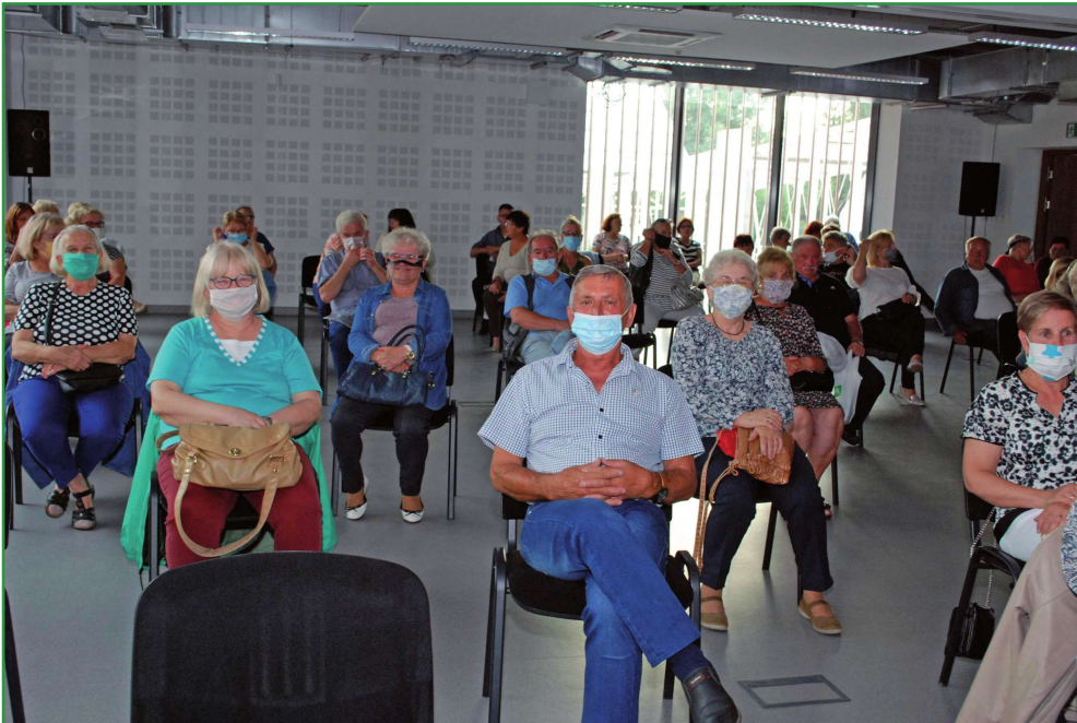
Mimo pandemii członkowie Stowarzyszenia „Seniorzy 50+” starają się organizować różne spotkania zachowując wszelkie środki ostrożności.

Do końca kwietnia zawieszono zostały dyżury pełnione przez członków zarządu Stowarzyszenia Seniorzy 50+. Siedziba organizacji mieści się w budynku przy placu Plebiscytowym. Z powodu pandemii wstrzymane zostały także inne zajęcia organizowane dla seniorów.