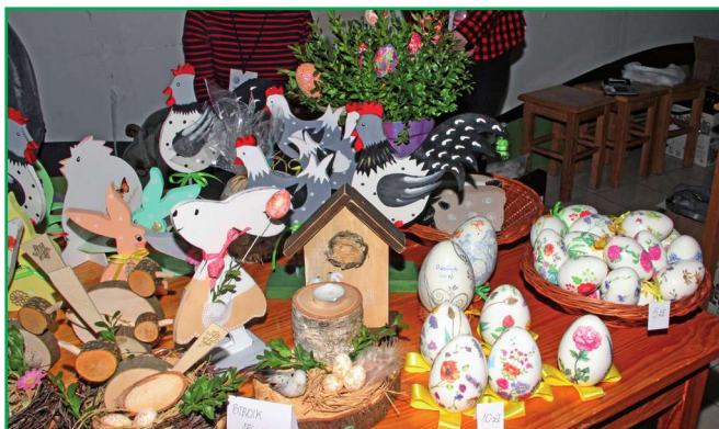
Kiermasz to nie tylko sprzedaż wyrobów wykonanych podczas terapii zajęciowej, ale także okazja do promocji i prezentacji form rehabilitacji zawodowej i społecznej prowadzonej w warsztacie dla niepełnosprawnych mieszkańców powiatu kwidzyńskiego.

Kiermasz to nie tylko sprzedaż wyrobów wykonanych podczas terapii zajęciowej, ale także okazja do promocji i prezentacji form rehabilitacji zawodowej i społecznej prowadzonej w warsztacie dla niepełnosprawnych mieszkańców powiatu kwidzyńskiego. Cały dochód ze sprzedaży był przeznaczony na rehabilitację uczestników warsztatu. Współorganizatorem kiermaszów od kilku lat było Centrum Handlowe „Liwa”, które także musi zmagać się z ograniczeniami związanymi z pandemią. Siedziba kwidzyńskiego Warsztatu Terapii Zajęciowej znajduje się w zabytkowym dworze w Górkach, w gminie Kwidzyn. Od stycznia 2004 roku prowadzi go kwidzyńska Fundacja „Misericordia”. Podczas zajęć niepełnosprawni mieszkańcy powiatu kwidzyńskiego zdobywają wiele umiejętności, które przydają się w życiu codziennym, ale przede wszystkim w przyszłej pracy zawodowej. W Warsztacie funkcjonuje dziewięć specjalistycznych pracowni. W zajęciach terapeutycznych uczestniczy 47 niepełnosprawnych osób. (jk)