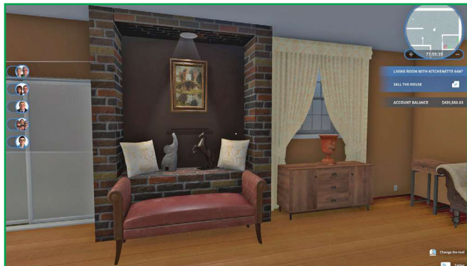
Gra House Flipper została stworzona przez polskie studio Empyrean. Wcielamy się w niej we właściciela firmy remontowej. www.steamcommunity.com

podłogowych, montaż urządzeń sanitarnych, wyburzanie ścian i urządzenie wnętrz zgodnie z życzeniami klientów. Zlecenia można wykonywać częściowo kosztem mniejszego wynagrodzenia. Gracz w miarę wykonywania prac otrzymuje punkty umiejętności, których wydanie umożliwia wykonywanie poszczególnych prac szybciej i efektywniej. Po zarobieniu odpowiedniej ilości pieniędzy gracz może kupować opuszczone i zaniedbane domy, które może wyremontować i sprzedać z zyskiem albo zatrzymać i urządzić według własnego uznania. Grę można kupić za około 70 zł. Za dodatkowe 50 zł można kupić rozszerzenie, które dodaje możliwość wykonywania prac ogrodowych, takich jak koszenie trawników, sadzenie roślin i ścinanie drzew.