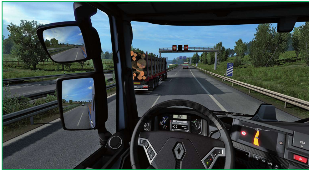
Stworzone przez czeskie studio SCS Software gry Euro Truck Simulator i American Truck Simulator są symulatorami kierowcy ciężarówki.

Stworzone przez czeskie studio SCS Software gry Euro Truck Simulator i American Truck Simulator są symulatorami kierowcy ciężarówki. Jak sugerują nazwy gier, ich akcja toczy się odpowiednio w Europie i Stanach Zjednoczonych. Gracz ma za zadanie przewożenie różnych ładunków - często podróżując przez kilka krajów. Na początku gry gracz nie ma własnej ciężarówki i musi przyjmować zlecenia od różnych firm, które udostępniają swoje ciężarówki i pokrywają wydatki na paliwo i opłaty drogowe. Za zarobione pieniądze gracz może rozwijać własną firmę przewozową kupując własne ciężarówki oraz garaże i zatrudniając kierowców. W miarę postępów w grze gracz otrzymuje punkty umiejętności,