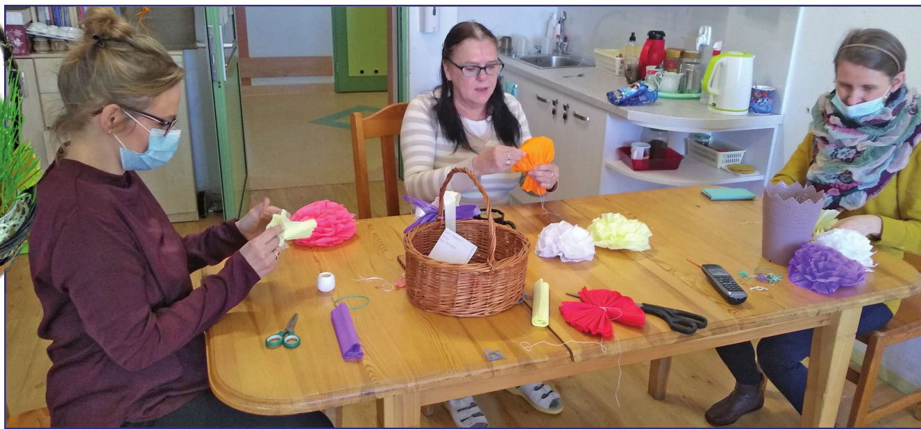
Mieszkańcy Domu Pomocy Społecznej w Kwidzynie przygotowawali się przez cały marzec do Świąt Wielkanocnych. Tworzyli świąteczne ozdoby i aby wprowadzić do domu powiew wiosny przygotowali papierowe kwiaty, które ozdobiły pomieszczenia.

- Z tej okazji nasza świetlica zamieniła się w kawiarnię, do której zaprosiliśmy wszystkie mieszkanki naszego domu. Panie zostały ugoszczone pyszną kawą i herbatką, a czas umilała im muzyka z czasów ich młodości. Każda z pań została poczęstowana pysznymi kruchymi ciasteczkami upieczonymi specjalnie dla nich przez pracowników naszego domu. Zgodnie ze zwyczajem