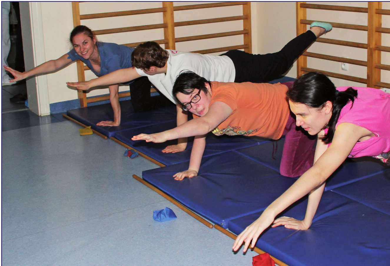
Samorząd powiatu przyjął uchwałę w sprawie określenia zadań i wysokości środków Państwowego Funduszu Rehabilitacji Osób Niepełnosprawnych na rehabilitację społeczną i zawodową osób niepełnosprawnych. Z projektem zapoznała się wcześniej Powiatowa Społeczna Rada ds. Osób Niepełnosprawnych, która zaopiniowała go pozytywnie. Wysokość środków przypadających według algorytmu na 2021 rok dla powiatu kwidzyńskiego to ponad 3,1 mln zł.

- Przez wiele lat było bardzo mało środków i znacznie je ograniczyliśmy. W turnusach uczestniczyli w zasadzie tylko dzieci i młodzież i niewiele dorosłych osób niepełnosprawnych. W ubiegłym roku także na to zadanie była przeznaczona znaczna kwota, ale z uwagi na zamknięcie ośrodków z powodu pandemii nie można było w pełni wykorzy-