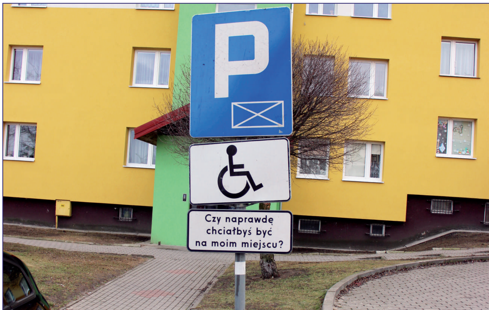
Karta parkingowa jest wydawana wyłącznie osobie niepełnosprawnej zaliczonej do znacznego albo umiarkowanego stopnia niepełnosprawności, która ma znacznie ograniczone możliwości samodzielnego poruszania się oraz osobie niepełnosprawnej, która nie ukończyła 16 roku życia, która również ma znacznie ograniczone możliwości samodzielnego poruszania się.

Do odbioru karty i legitymacji można upoważnić kierownika Powiatowego Centrum Pomocy Rodzinie w Kwidzynie. Kierownik PCPR co drugi tydzień w miesiącu odbiera legitymacje i karty parkingowe z Malborka. Do-