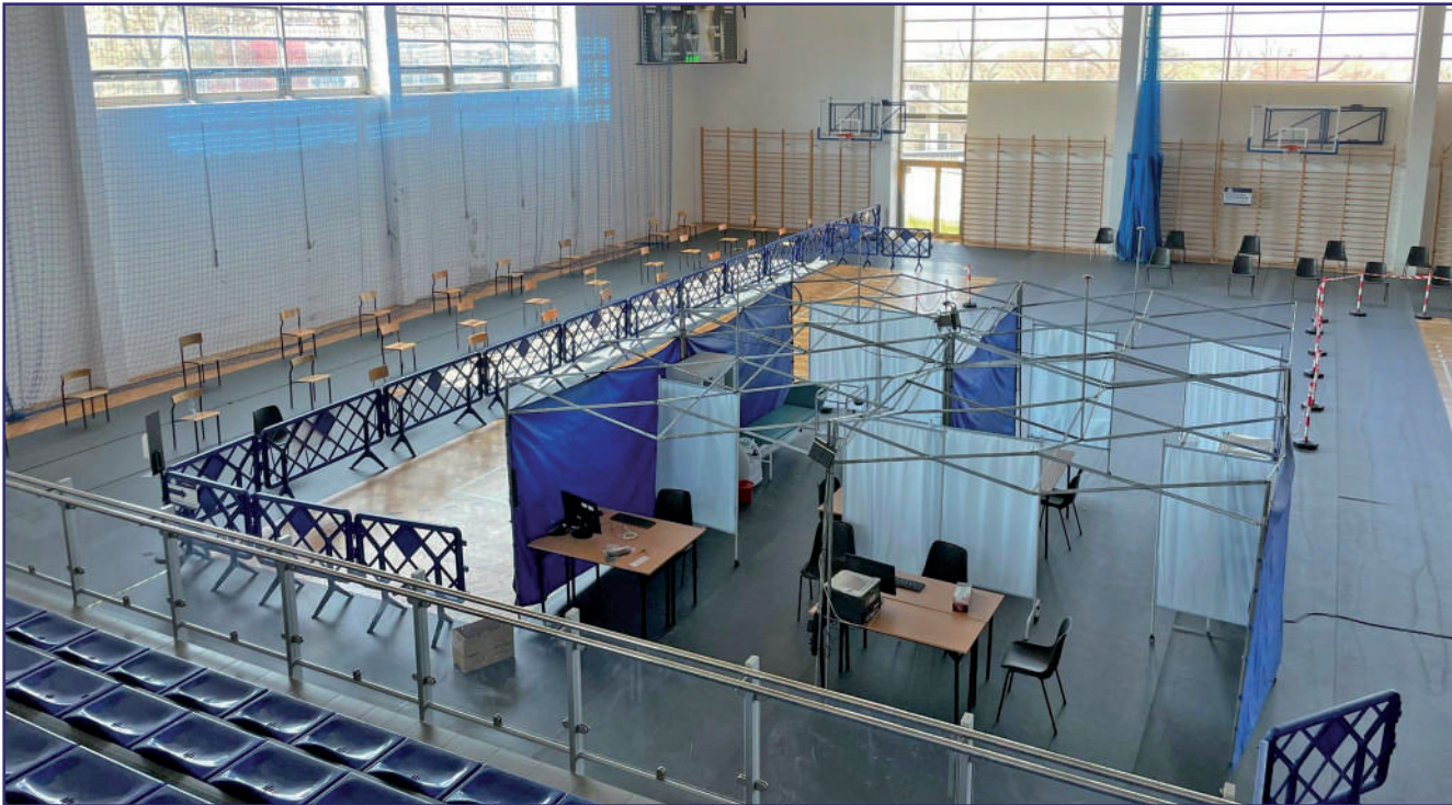
Sala gimnastyczna Zespołu Szkół Nr 2 przy ulicy Żwirki i Wigury 1 w Kwidzynie stanie się Punktem Szczepień Masowych. Punkt powstał przy współpracy samorządów powiatu i miasta Kwidzyna oraz Spółki Zdrowie - Ratownictwo Medyczne.

Przy współpracy samorządów powiatu i miasta Kwidzyna oraz Spółki Zdrowie - Ratownictwo Medyczne powstał Punkt Szczepień Masowych. Szczepienia będą prowadzone w sali gimnastycznej Zespołu Szkół Nr 2 przy ulicy Żwirki i Wigury 1 w Kwidzynie stanie się Punktem Szczepień Masowych. Punkt powstaje. Większość udziałów w spółce ma samorząd powiatu. Spółka będzie odpowiedzialna za stronę medyczną przedsięwzięcia.