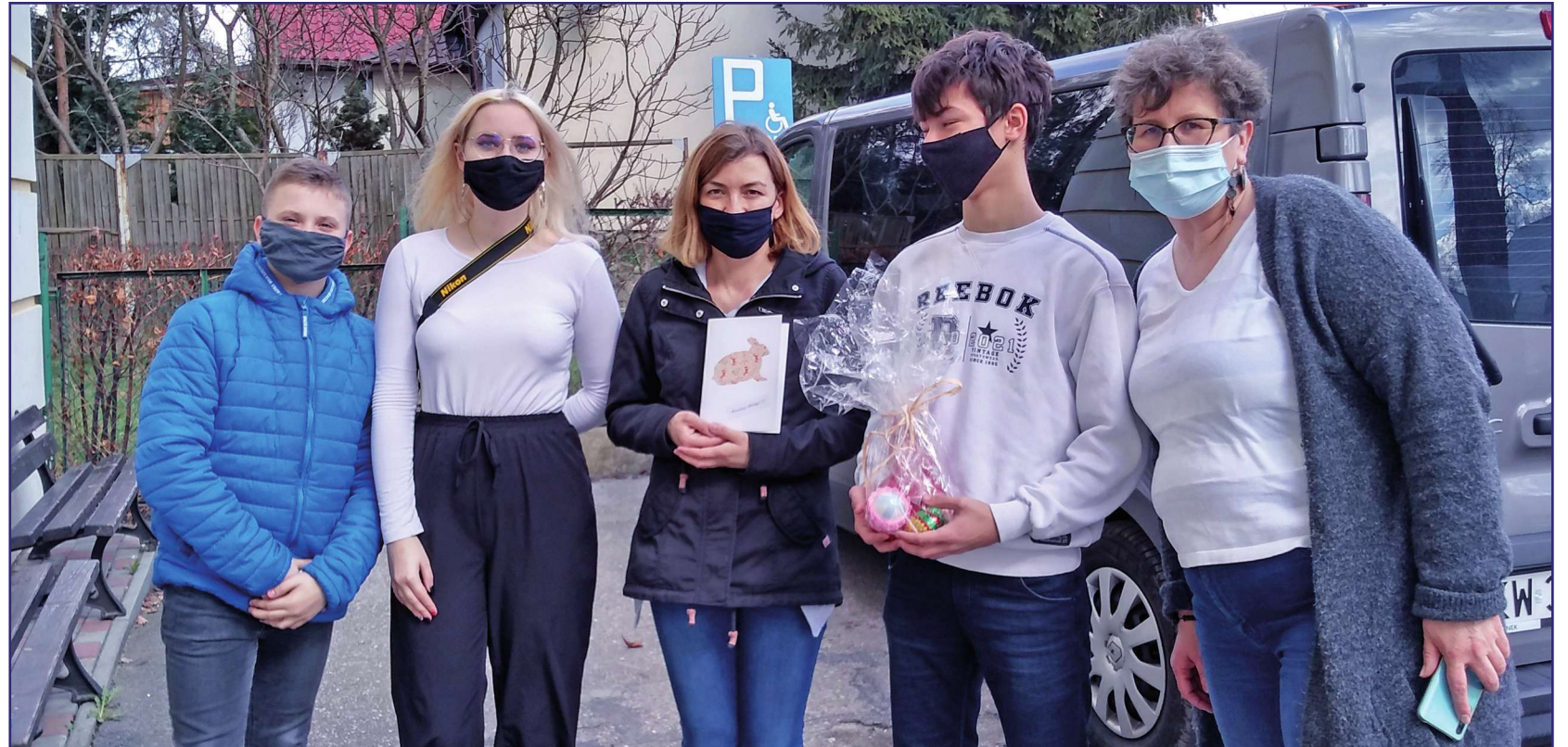
Podopieczni Rodzinnego Centrum Razem Fundacji Flow złożyli mieszkańcom i pracownikom Domu Pomocy Społecznej w Kwidzynie życzenia wielkanocne. Ponieważ w domu nadal obowiązuje rygor sanitarny własnoręcznie wykonaną kartkę z życzeniami przekazały na ręce terapeuty zajęciowego.