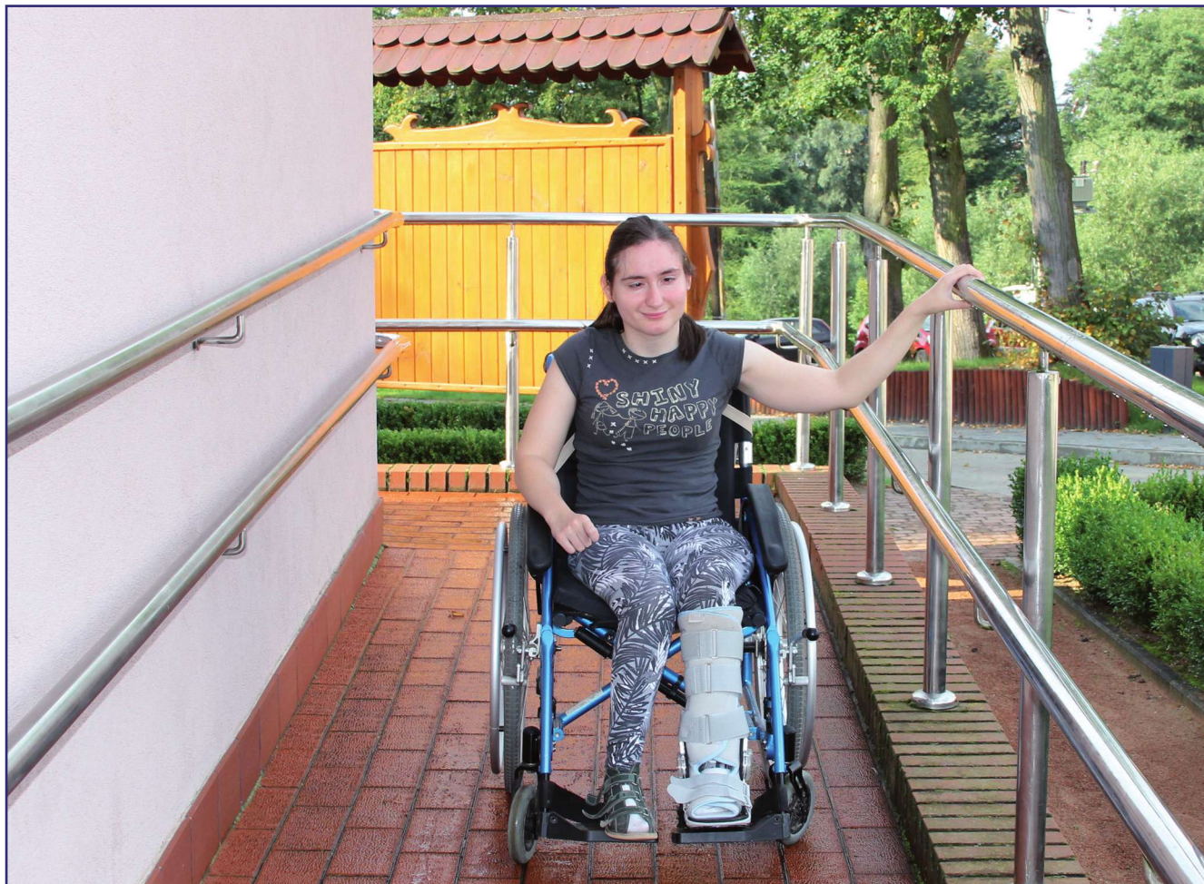
Wsparcie asystenta ma wpłynąć na poprawę jakości życia osób niepełnosprawnych, w szczególności ma im umożliwić jak największą niezależność w życiu. Osoby niepełnosprawne będą mogły korzystać z pomocy asystenta przy wykonywaniu codziennych czynności, w tym wyjścia z domu, w zakupach, dojazdach na rehabilitację, a także w załatwieniu różnych formalności w urzędach. Fot. archiwum

Ponad 123 tys. zł uzyskał samorząd powiatu na realizację programu „Asystent osobisty osoby niepełnosprawnej”. To program opracowany przez Ministerstwo Rodziny, Pracy i Polityki Społecznej. Pieniądze na jego realizację pochodzą ze środków Solidarnościowego Funduszu Wsparcia Osób Niepełnosprawnych.