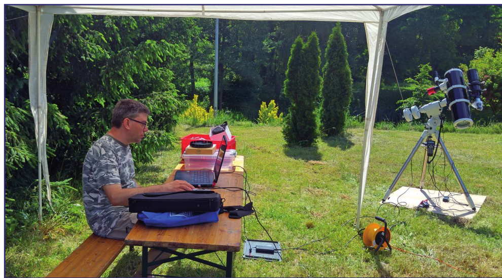
Dla zwiększenia bezpieczeństwa obraz Słońca można było obserwować na monitorze komputera