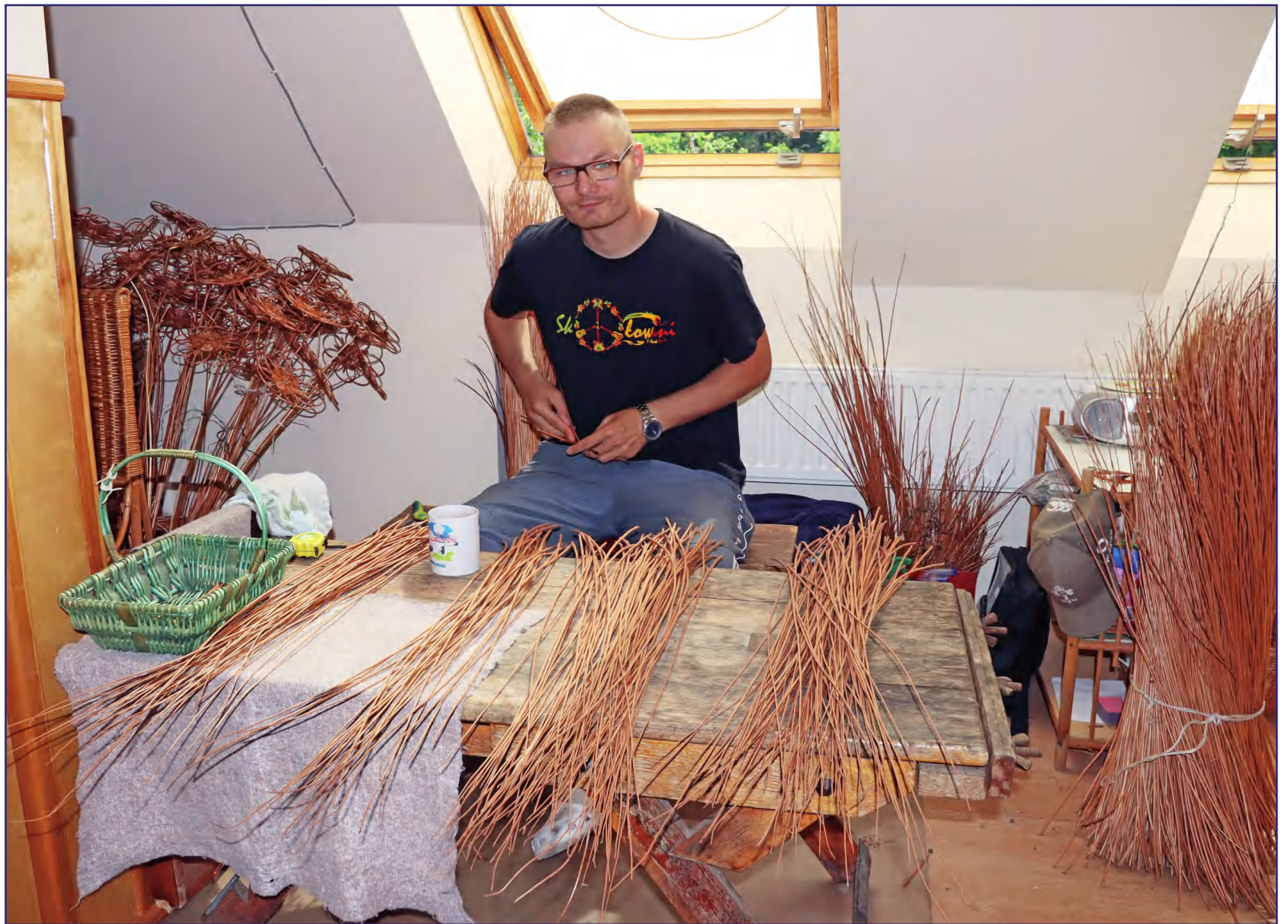
Pozytywna decyzja dotycząca wznowienia zajęć w warsztatach terapii zajęciowej w Ryjewie i Kwidzynie oraz Powiatowym Środowiskowym Domu Samopomocy w Kwidzynie była uzależniona od poziomu wyszczepialności. Na zdjęciach: pierwszy tydzień zajęć w Warsztacie Terapii Zajęciowej w Kwidzynie z siedzibą w Górkach, prowadzonym przez kwidzyńską Fundację „Misericordia”.

Z powodu pandemii 13 marca ubiegłego roku wojewoda pomorski zawiesił działalność w takich placówkach, jak warsztaty terapii zajęciowej czy środowiskowe domy samopomocy. Wznowienie działalności nastąpiło 28 maja. Kolejna przerwa trwała od 2 listopada ubiegłego roku do 7 czerwca tego roku.