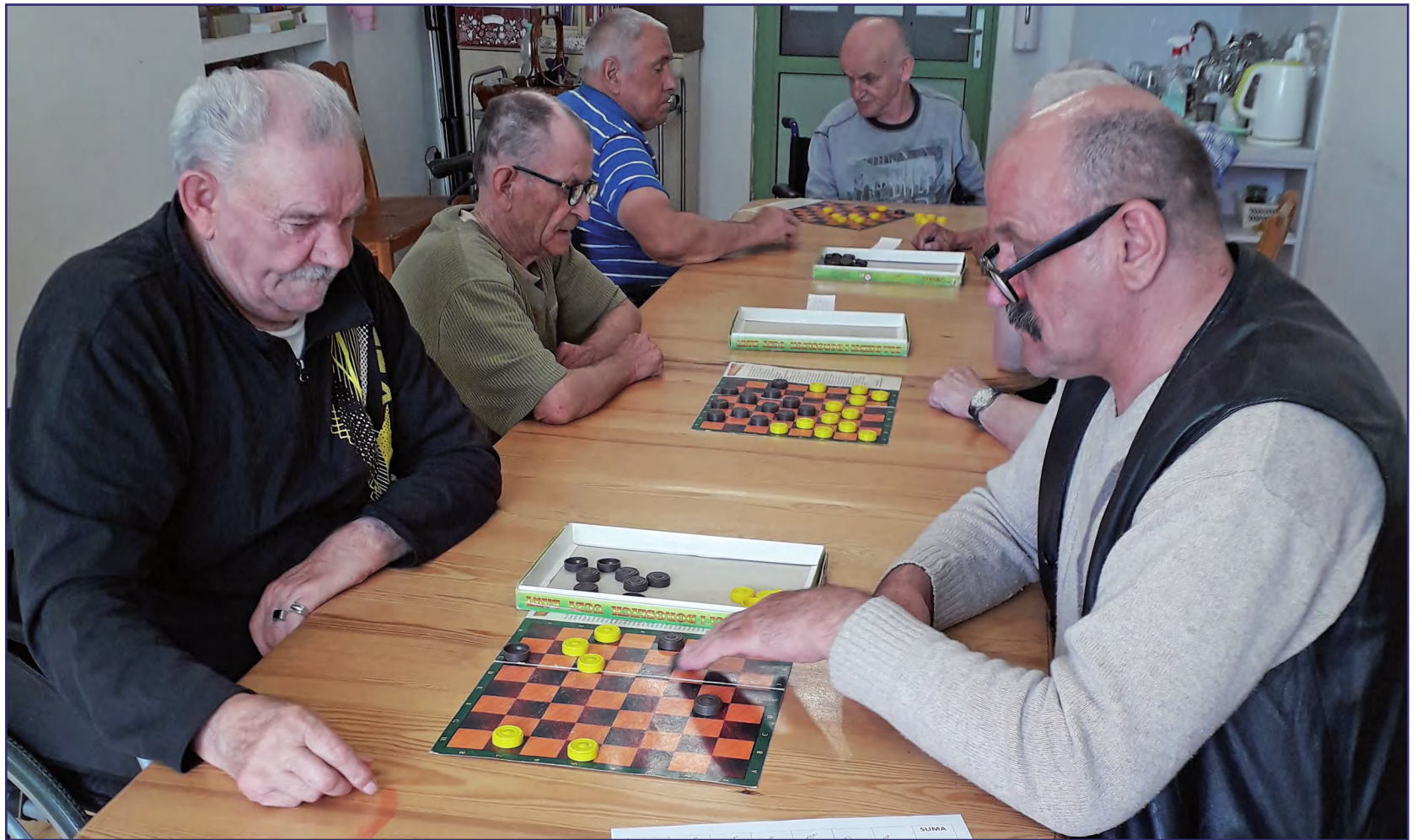
24 maja rozpoczęto wewnętrzny turniej gry w warcaby o puchar dyrektora Domu Pomocy Społecznej w Kwidzynie. Do rywalizacji stanęło 12 mieszkańców.