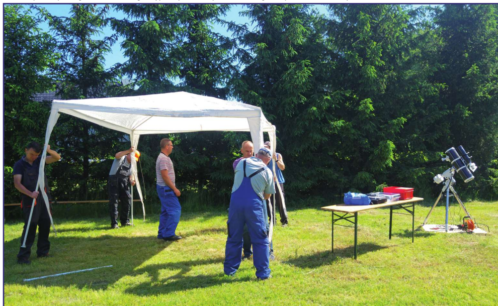
Stanowisko do obserwacji przygotowali uczestnicy zajęć w pracowni ogrodniczo-gospodarczej.