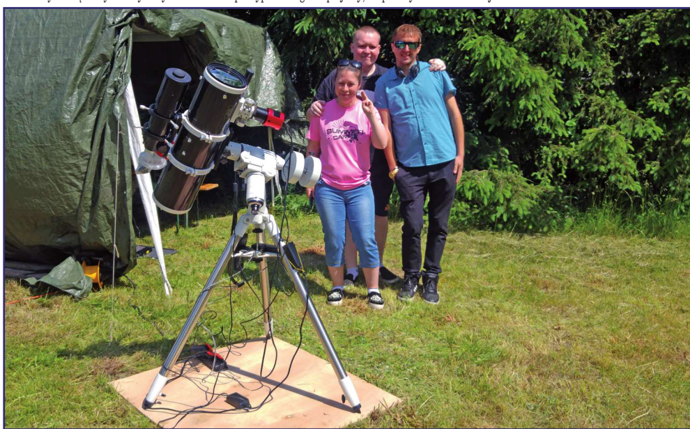
Uczestnicy kwidzyńskiego Warsztatu Terapii Zajęciowej z siedzibą w Górkach mogli na żywo obserwować częściowe zaćmienie Słońca.