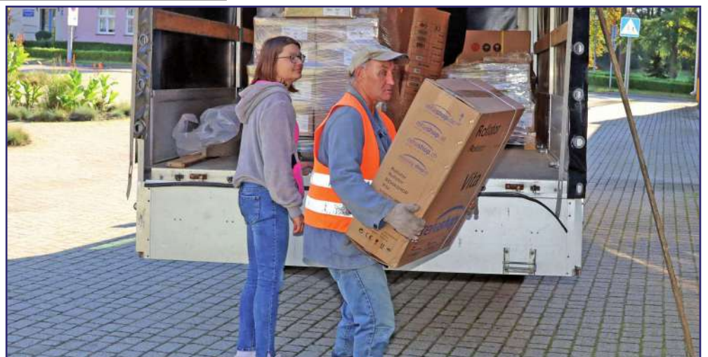
Fundacja „Misericordia” otrzymała dary, które pomogą chorym oraz osobom niepełnosprawnym w rehabilitacji.