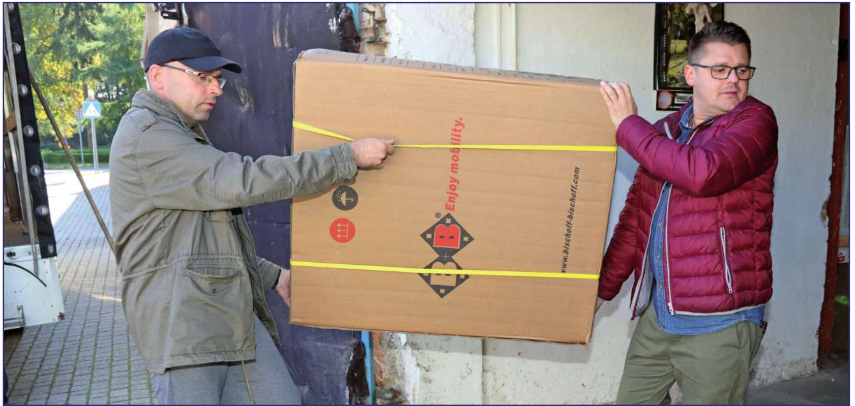
Przekazany sprzęt to między innymi jedenaście chodzików, dwa wózki inwalidzkie oraz maty do ćwiczeń.