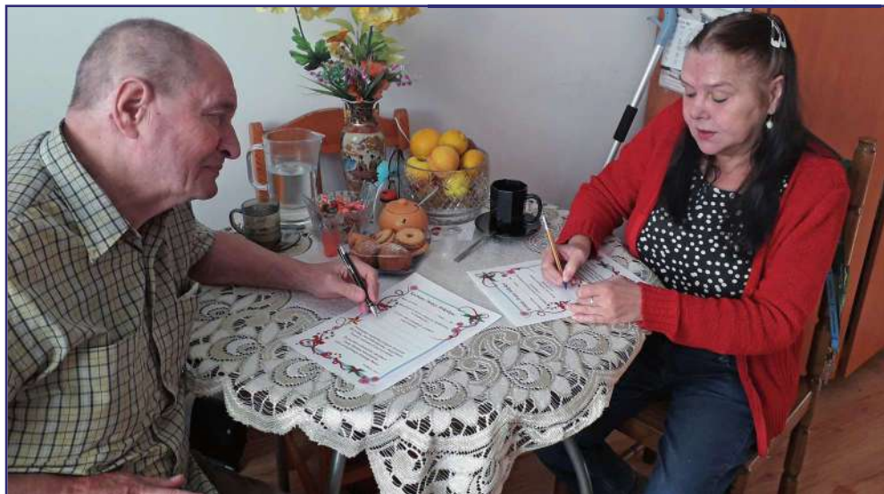
Dom Pomocy Społecznej w Kwidzynie zgłosił swój udział w kolejnej edycji akcji Fundacji „Święty Mikołaj dla Seniora”.