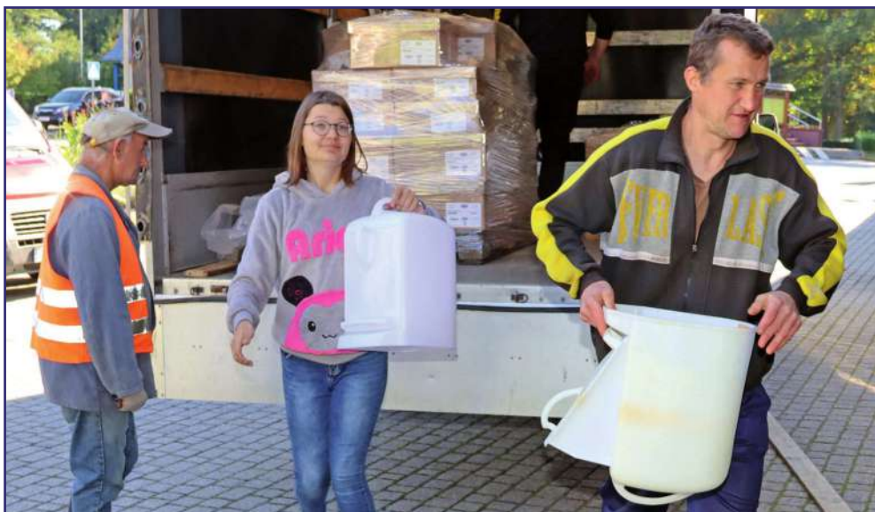
Wypożyczalnia funkcjonuje przy zabytkowym dworku w Górkach, który jest siedzibą Warsztatu Terapii Zajęciowej, prowadzonego przez Fundację „Misericordia”.