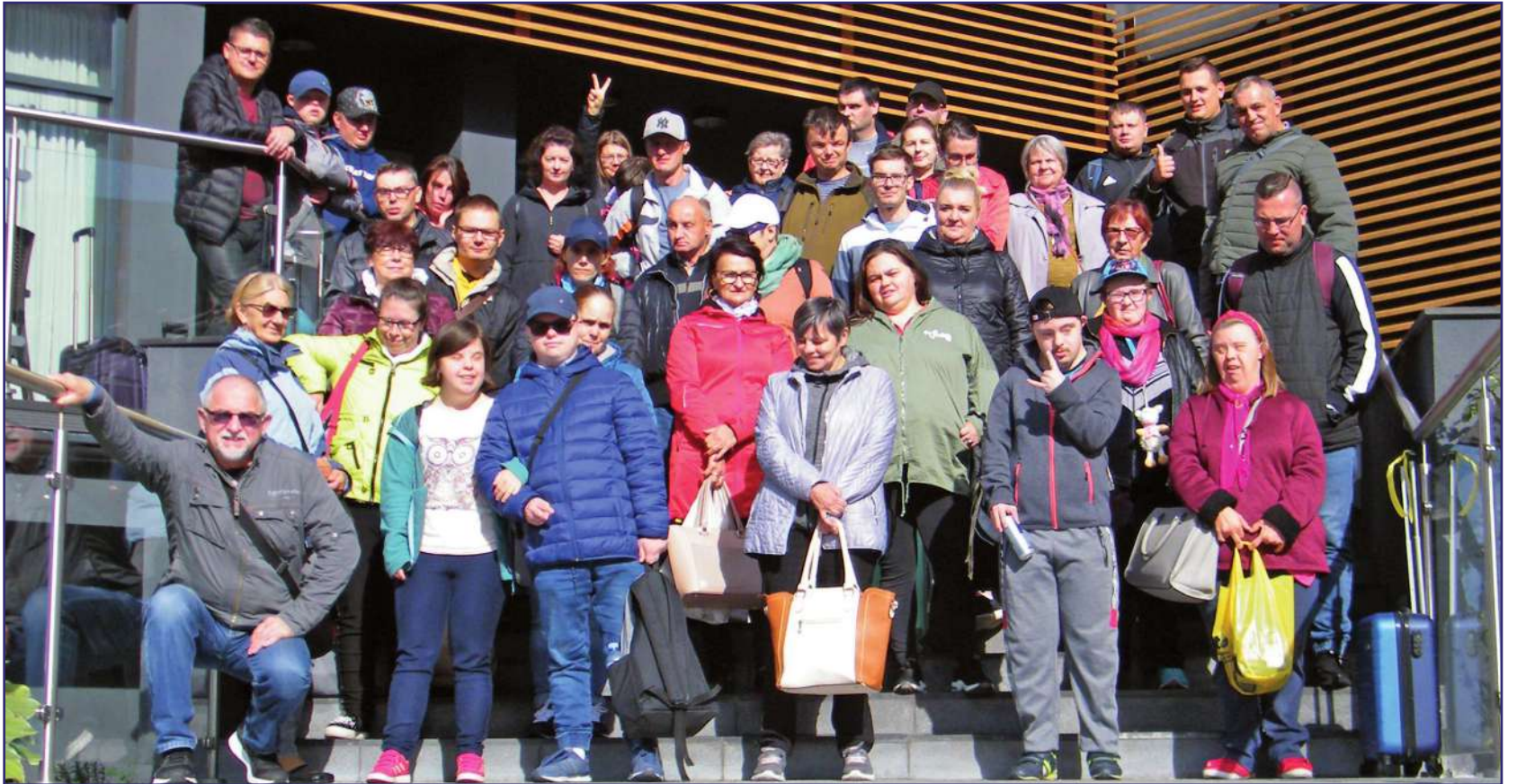
Uczestnicy Warsztatu Terapii Zajęciowej w Górkach wraz z instruktorami i opiekunami pojechali na dwudniową wycieczkę do Gietrzwałdu i Olsztyna.

Po spotkaniu z księdzem, który opowiedział o historii sanktuarium i objawieniach Matki Bożej w Gietrzwałdzie, uczestnicy zjedli wspólny obiad, a następnie wyruszyli do Olsztyna. Tam podczas wycieczki z przewodnikiem zobaczyli m.in. fontannę „Dziecko na rybie” w parku Podzamecze, pomnik Mikołaja Kopernika, Zamek Kapituły Warmińskiej, Stare Miasto i Wysoką Bramę. Od przewodnika uczestnicy usłyszeli miejską legendę, która mówi, że każdemu kto przejdzie przez Wysoką Bramę spełni się życzenie o którym pomyśli, o ile nie zdradzi tego życzenia innym i nie przejdzie przez bramę drugi raz tego samego dnia. Kolejny dzień rozpoczął się od wizyty w Olsztyńskim Teatrze Lalek, w którym uczestnicy obejrżeli godzinny spektakl pod tytułem „Mamu-Ty” opowiadający o młodym mamucie, który przeniósł się z epoki lodowcowej do współczesnego świata przez tajemniczy portal znajdujący się w jaskini. Wycieczka dotarła z powrotem do Kwidzyna oko-