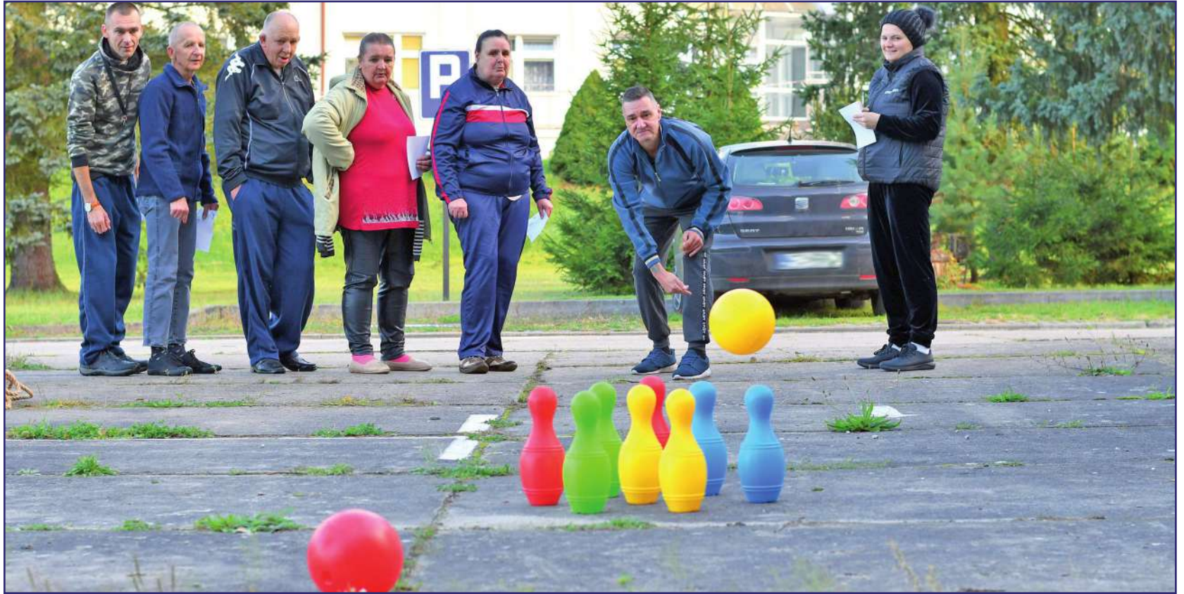
Mieszkańcy Domu Pomocy Społecznej „Słoneczne Wzgórze” w Ryjewie bawili się podczas Dnia Sportu. Rywalizowano w różnych konkurencjach sportowych.

Uczestnicy startowali w kilku konkurencjach: kręgle, tor przeszkód, strzał piłką do bramki, rzut do celu oraz dmuchanie balonów na czas. W tych zawodach nie było przegranych. Każdy, kto ukończył wszystkie konkurencje otrzymał nagrodę i dyplom. Dodatkową atrakcją były słodki poczęstunek, ciepłe napoje oraz kiełbasa z grilla. Nie zabrakło muzyki i wspólnej, tanecznej zabawy. Ważną częścią imprezy było wręczenie nagród przyznawanych w ramach rehabilitacji społecznej. Wyróżnienie przyznawane jest mieszkańcom domu, którzy aktywnie i systematycznie