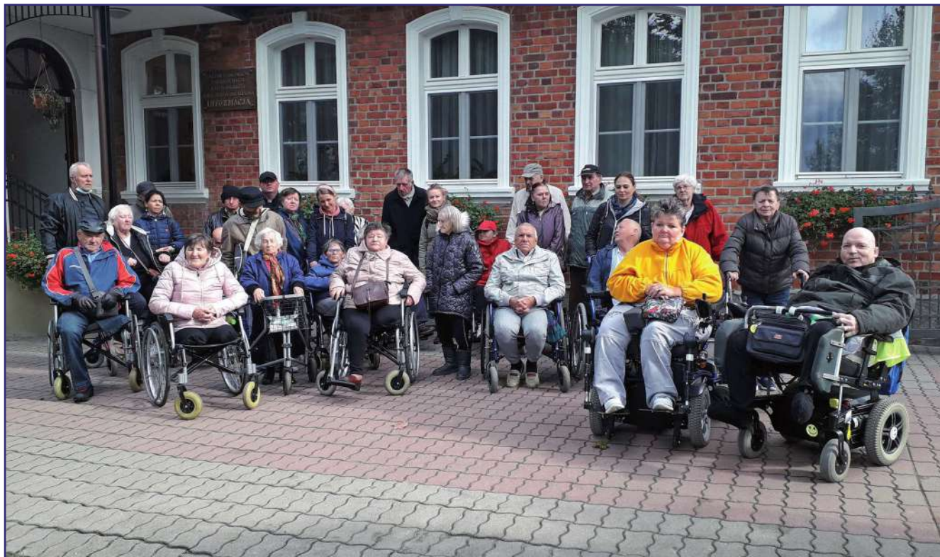
Mieszkańcy Domu Pomocy Społecznej w Kwidzynie nie mogą narzekać na brak zajęć. We wrześniu zorganizowana została wycieczka do Gietrzwałdu.

Mieszkańcy Domu Pomocy Społecznej w Kwidzynie nie mogą narzekać na brak zajęć. We wrześniu zorganizowano wycieczkę do Gietrzwałdu. Obchodzono Dzień Chłopaka, a jeden z utalentowanych mieszkańców domu wziął udział w ogólnopolskim konkursie plastycznym organizowanym przez Państwowy Fundusz Rehabilitacji Osób Niepełnosprawnych.