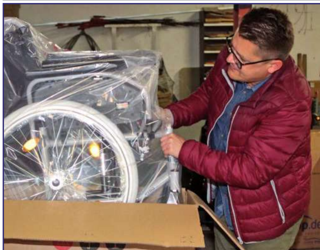
Sprzęt przekazany Fundacji „Misericordia” do wypożyczalni jest nowy.