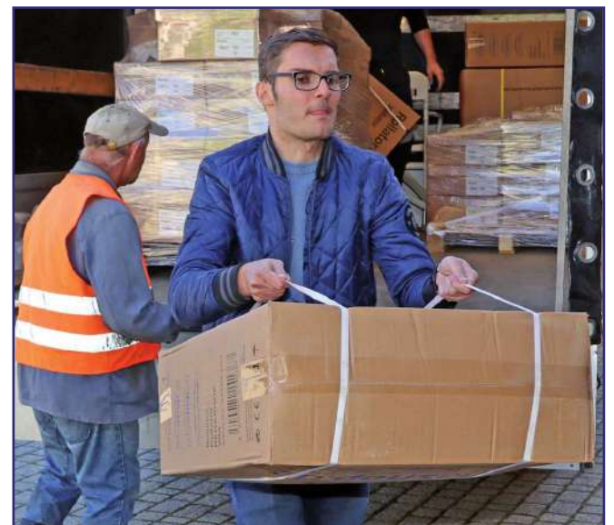
To już kolejny w tym roku transport darów. Sprzęt niedługo będzie można wypożyczać.