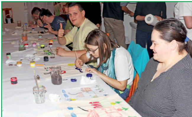
Płótnem były ekologiczne torby. Pomysłów nie brakowało, a efekty zaskakiwały udowadniając, że niepełnosprawność intelektualna nie ogranicza wyobraźni i malarskich zdolności.